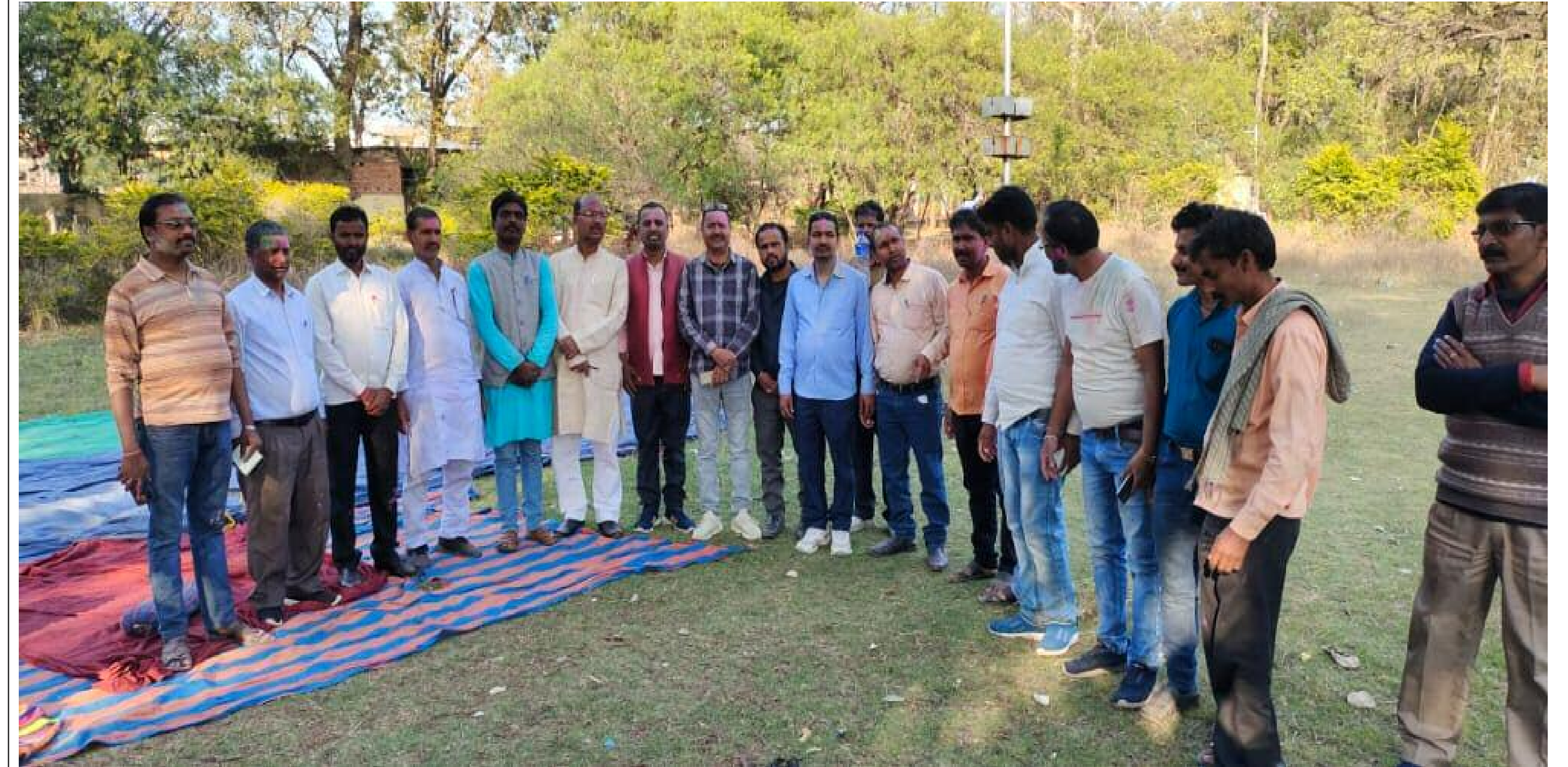
होली मिलन समारोह में शामिल लोग