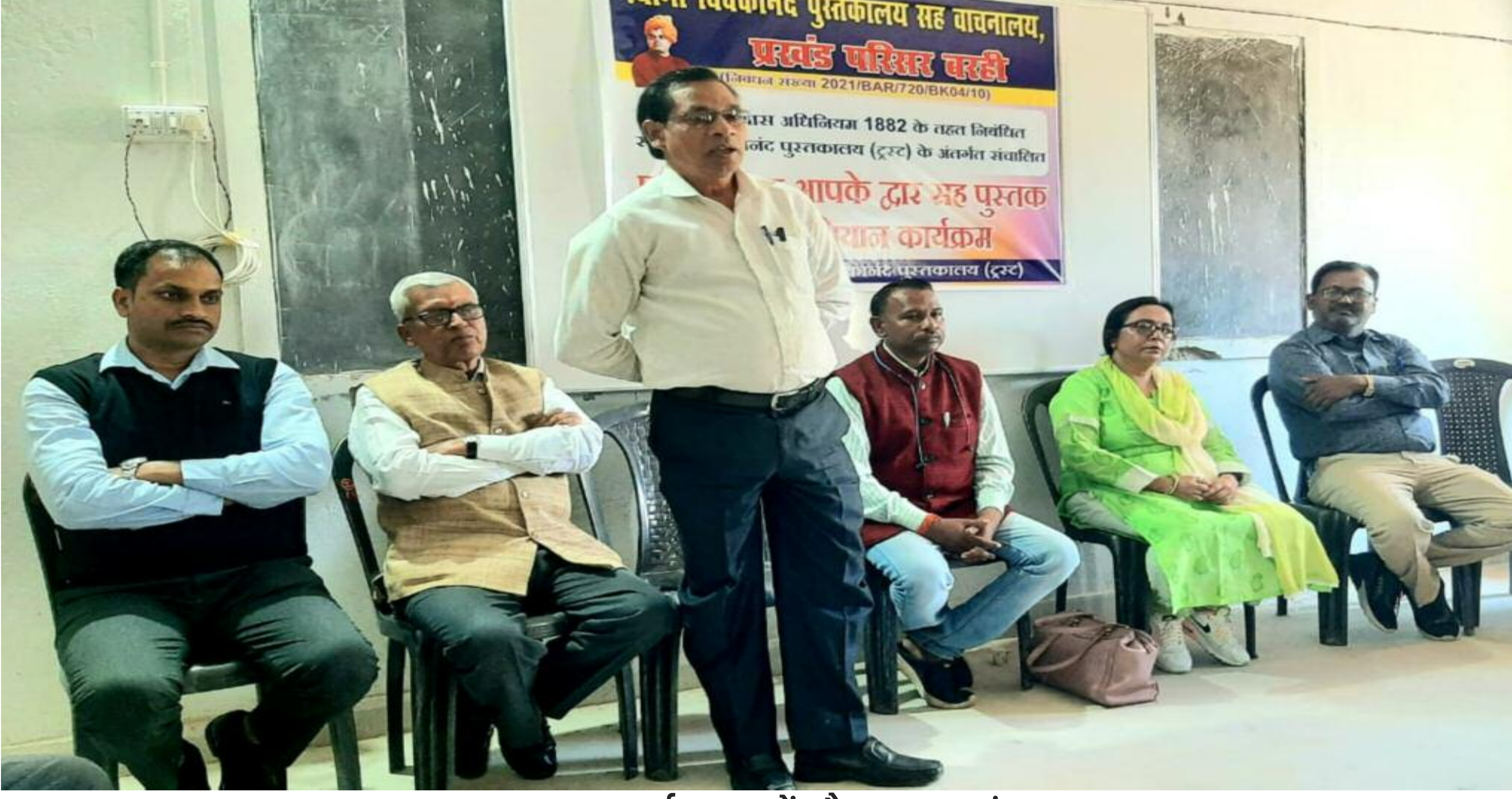
कार्यशाला में मौजूद छात्राएं

पुस्तकालय आपके द्वार कार्यक्रम के तहत परियोजना बालिका उच्च विद्यालय में कार्यशाला का आयोजन