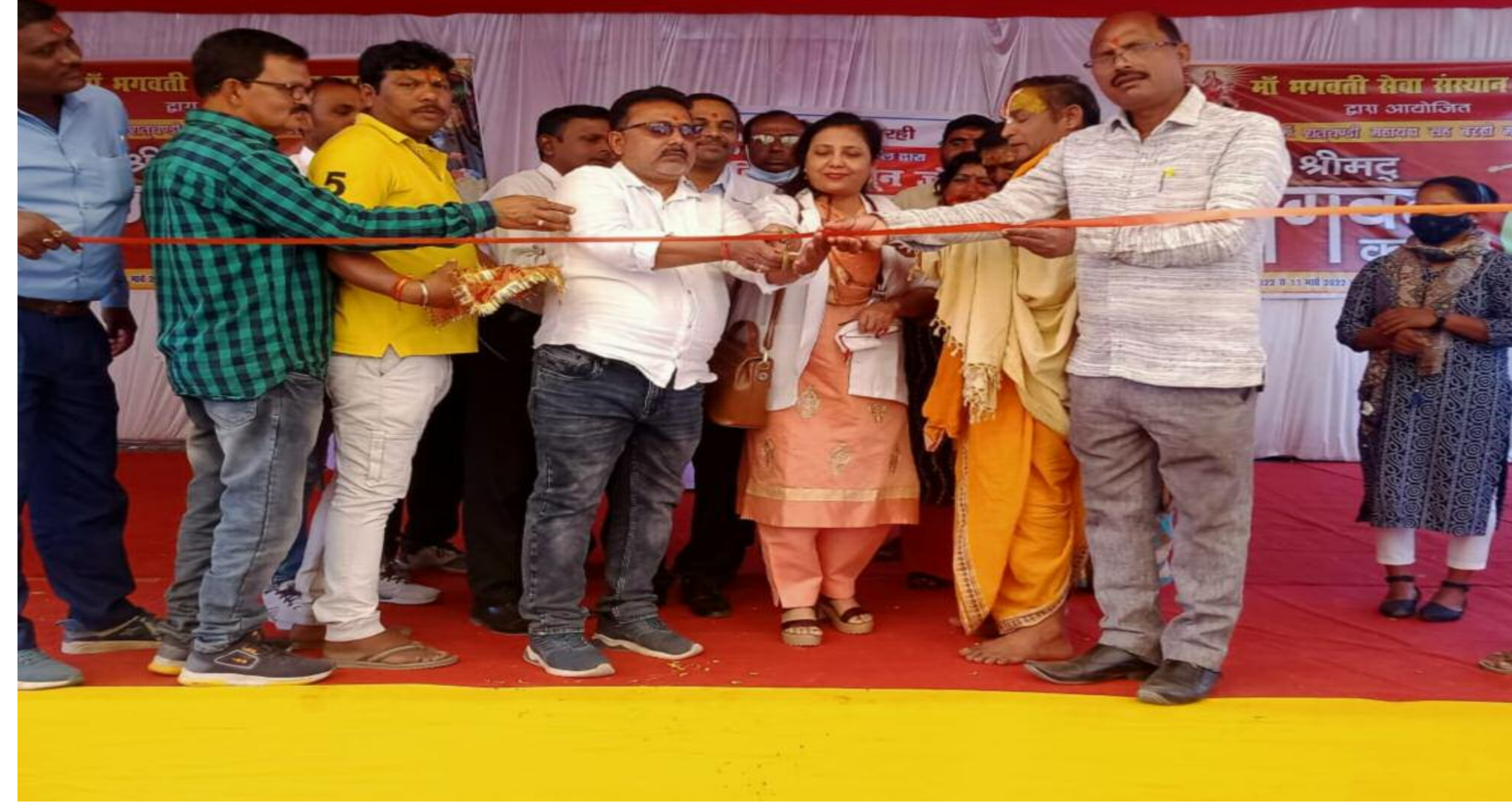
कार्यक्रम का उद्घाटन करते हुए

ओम नर्सिंग होम ने शिविर आयोजित कर विशेषज्ञ डॉक्टरों से कराई जांच, निशुल्क बांटे दवाइयां