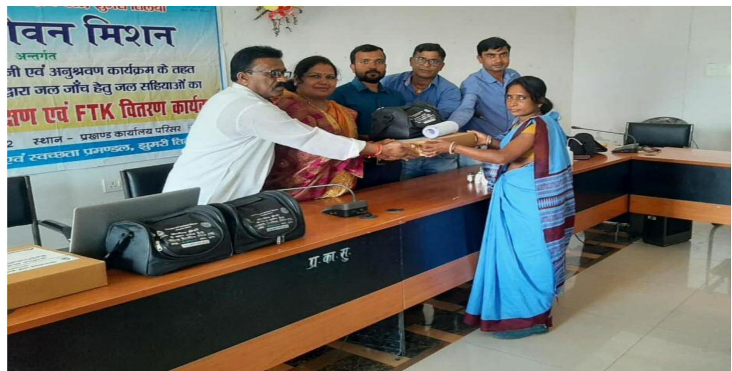
जल जीवन मिशन कार्यक्रम के दौरान किट वितरित करते अतिथि

जल गुणवत्ता एवं वर्षा जल के संचय एवं सेनेटरी सर्वे पर हुई चर्चा