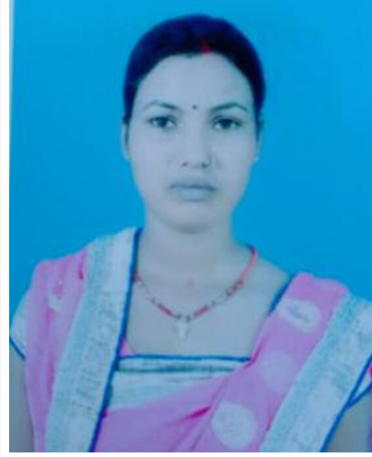
मृतक का फाइल फोटो