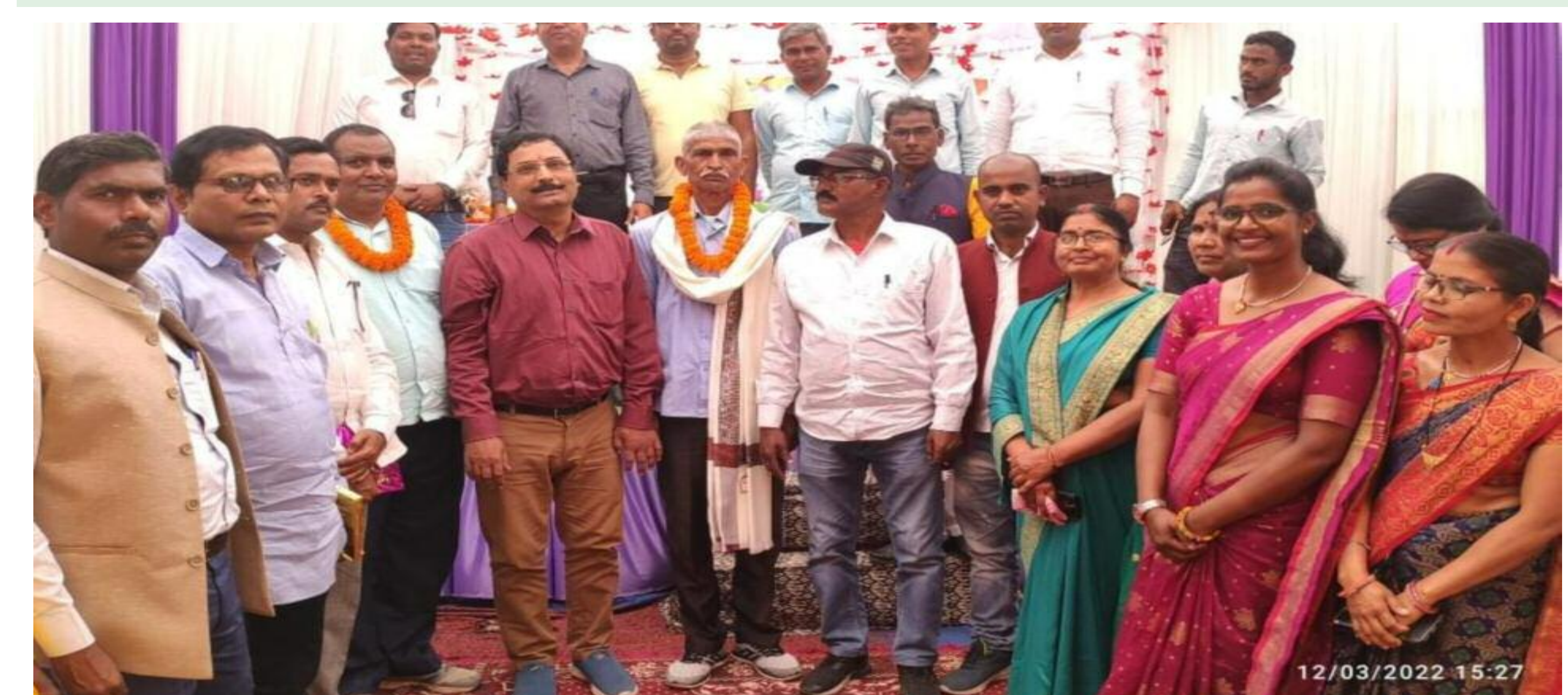
विदाई सह होली मिलन समारोह में मौजूद लोग