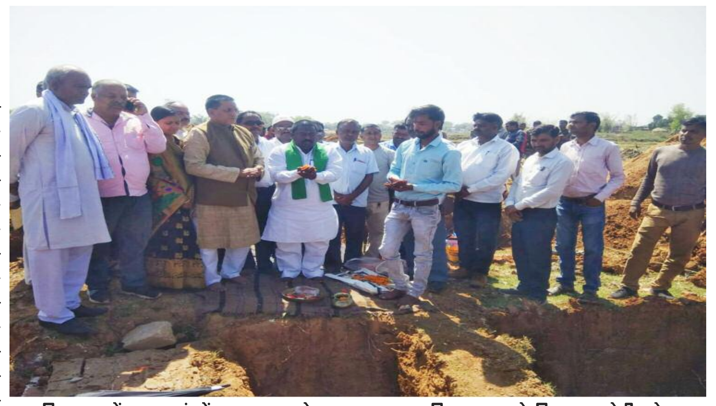
विष्णुगढ़ में ब्रास एवं ब्रॉज कलस्टर के नए भवन का भूमिपूजन करते विधायक जेपी पटेल

विष्णुगढ़ ब्रास एंड ब्रॉज कलस्टर के कारखाने के भवन निर्माण कार्य का शनिवार को भूमिपूजन किया गया। विष्णुगढ़ के देवी मंडप राजागढ़ के समीप मांडू विधायक जयप्रकाश भाई पटेल ने पूजा अर्चना कर इसकी आधारशिला रखी। उन्होंने कहा कि विष्णुगढ़ में कांसा एवं पीतल एक उद्योग का रूप ले चुका है। दुर्भाग्य से यहां अभी भी पुराने तकनीक से बर्तनों का निर्माण होता रहा है। आधु. निकता के कारण नए डिजाइन की मांग होने से यह उद्योग समाप्ति के कगार पर पहुंच रहा था। इसे संज्ञान में लेते हुए एमएसएमई मंत्रालय के अत्याधुनिक मशीनों के नितिन गडकरी से मिलकर नए प्रोजेक्ट को प्राथमिकता