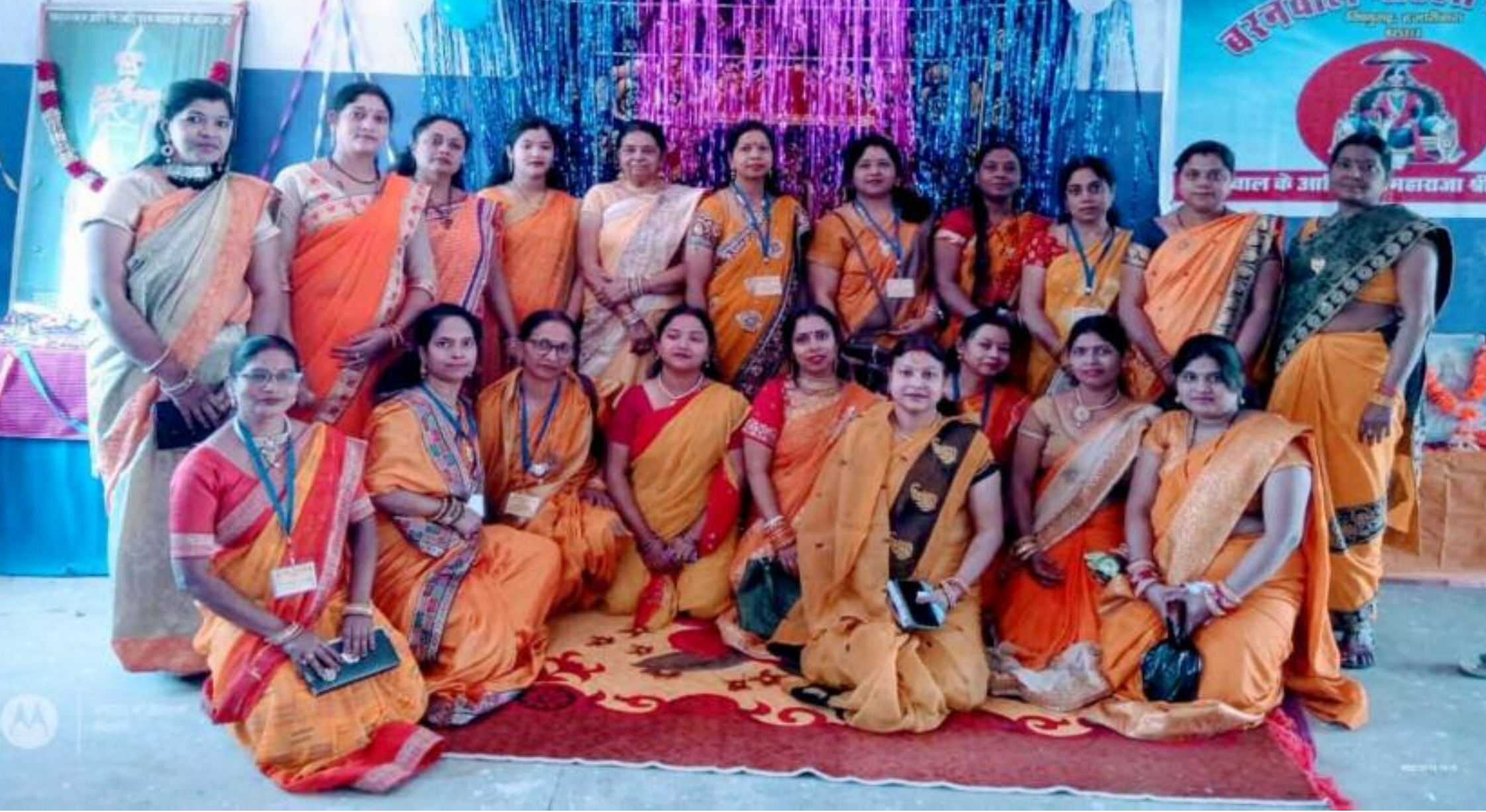
विष्णुगढ़ में बरनवाल महिला समिति के होली मिलन समारोह में मौजूद महिलाएं

बरनवाल महिला समिति विष्णुगढ़ कमेटी द्वारा होली मिलन समारोह सह सांस्कृतिक कार्यक्रम का आयोजन किया गया। बरनवाल सेवा सदन में आयोजित कार्यक्रम में समाज की बड़ी संख्या में महिलाएं शामिल हुईं। कार्यक्रम की शुरुआत आदिपुरुष अहिबर्न जी के चित्र पर श्रद्धासुमन तथा दीप प्रज्वलित कर किया गया। मिलन समारोह से पूर्व समाज के बच्चे-बच्चियों एवं महिलाओं द्वारा प्रस्तुत विविध गीत-संगीत कार्यक्रम ने माहौल को होलीमय बना दिया। फगुवा गीतों के अलावा विविध सांस्कृतिक गीतों पर लोग खूब झूमते रहे। कई लोगों ने नृत्य की भी प्रस्तुति दी। इसके उपरांत महिलाओं ने एक