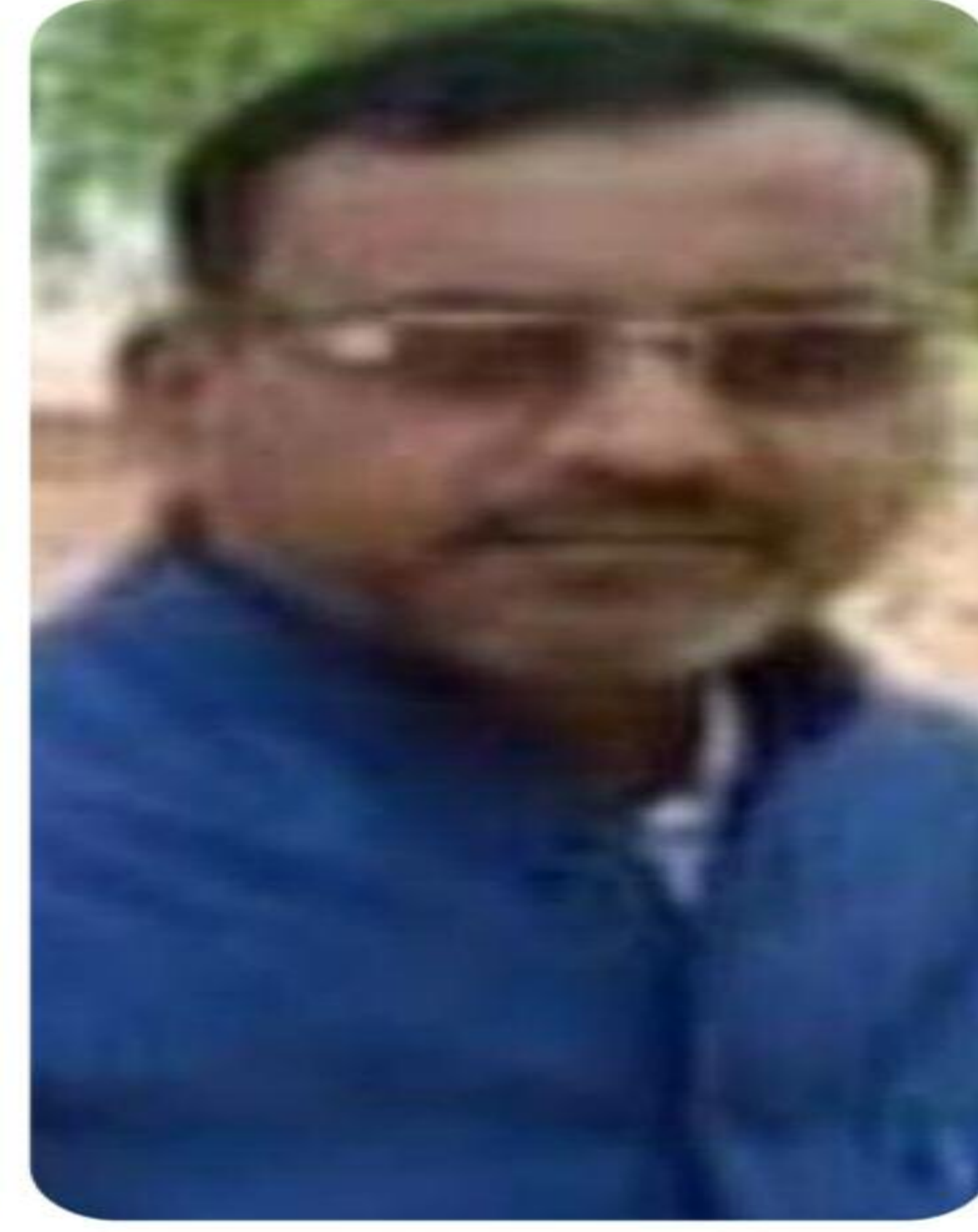
मृतकों की फाइल फोटो