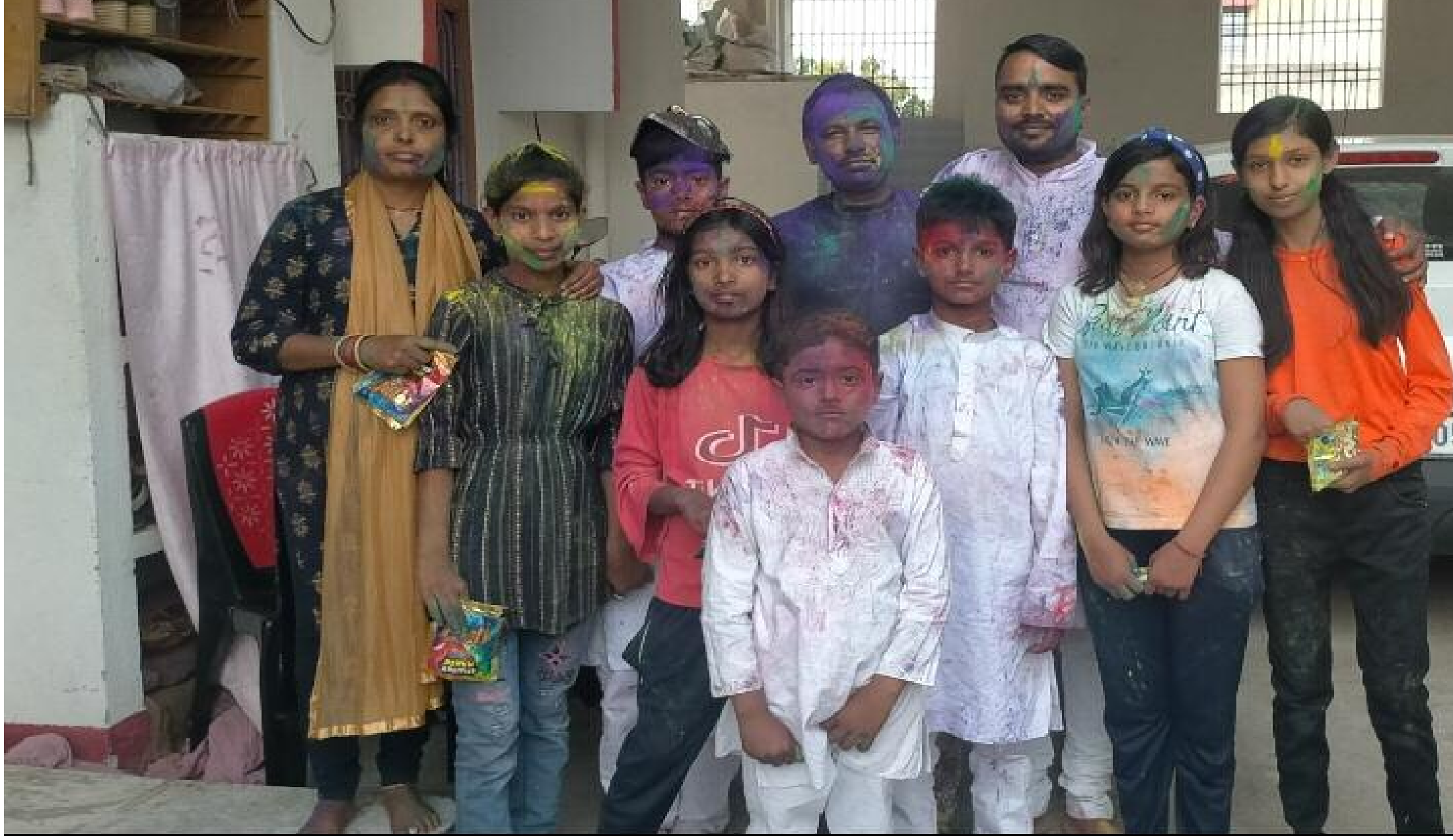
होली खेलते लोग