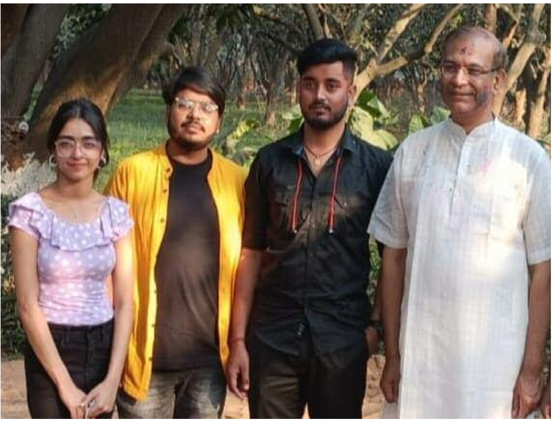
सांसद जयंत सिन्हा से मिल अपनी समस्या से अवगत कराते यूक्रेन से लौटे मेडिकल छात्र

रूस यूक्रेन युद्ध के भुक्तभोगी मेडिकल छात्रों को अब सताने लगी है भविष्य की चिंता, सांसद जयंत सिन्हा से मिल कराई शैक्षणिक समस्या से अवगत