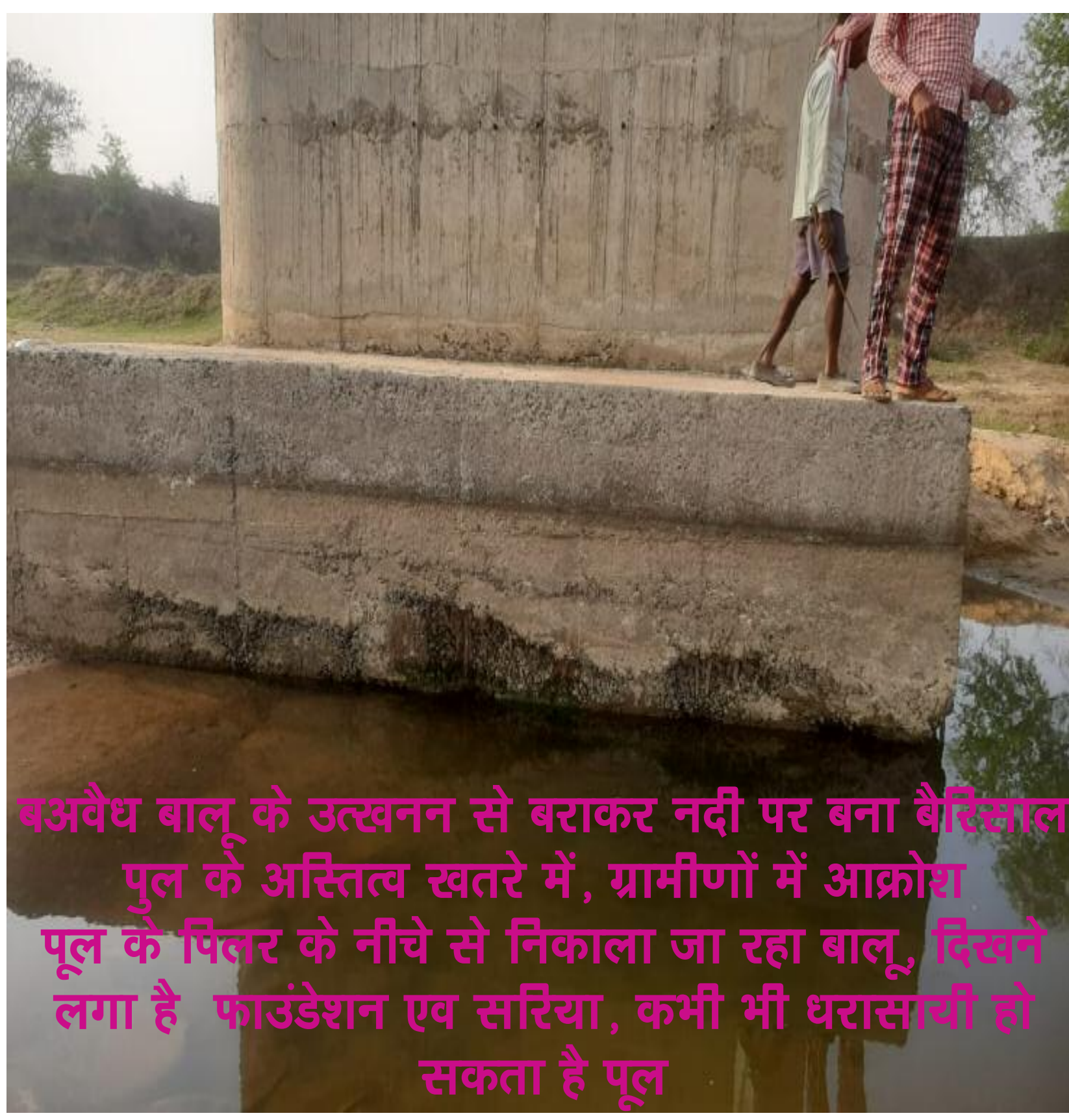
अवैध बालू के उत्खनन से बराकर नदी पर बना बैरिसाल पुल के अस्तित्व खतरे में, ग्रामीणों में आक्रोश पुल के पिलर के नीचे से निकाला जा रहा बालू, दिखने लगा है फाउंडेशन एव सरिया, कभी भी धरासायी हो सकता है पुल