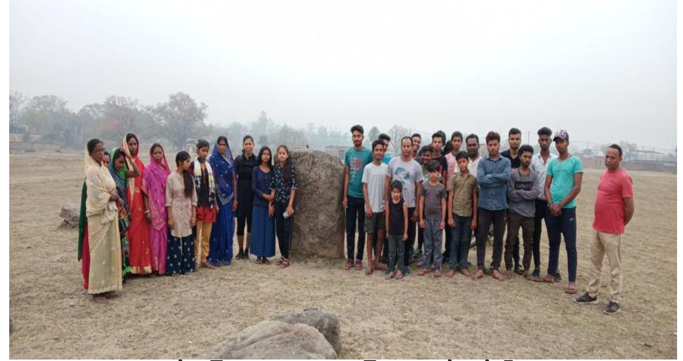
मेगालिथ स्थल पर उपस्थित खगोल प्रेमी