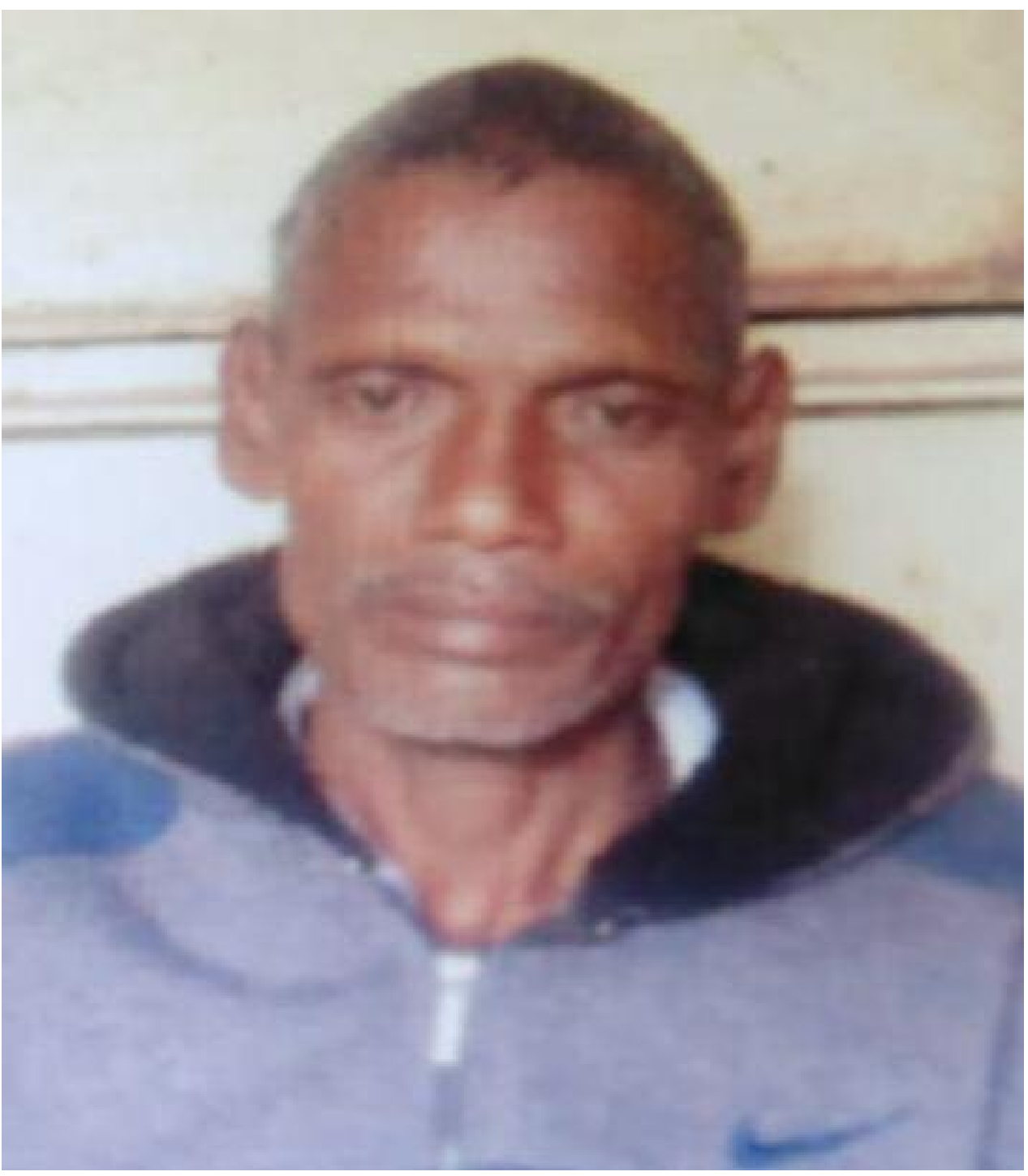
मृतक का फाइल फोटो

तालाब में डूबने से 52 वर्षीय वृद्ध की मौत