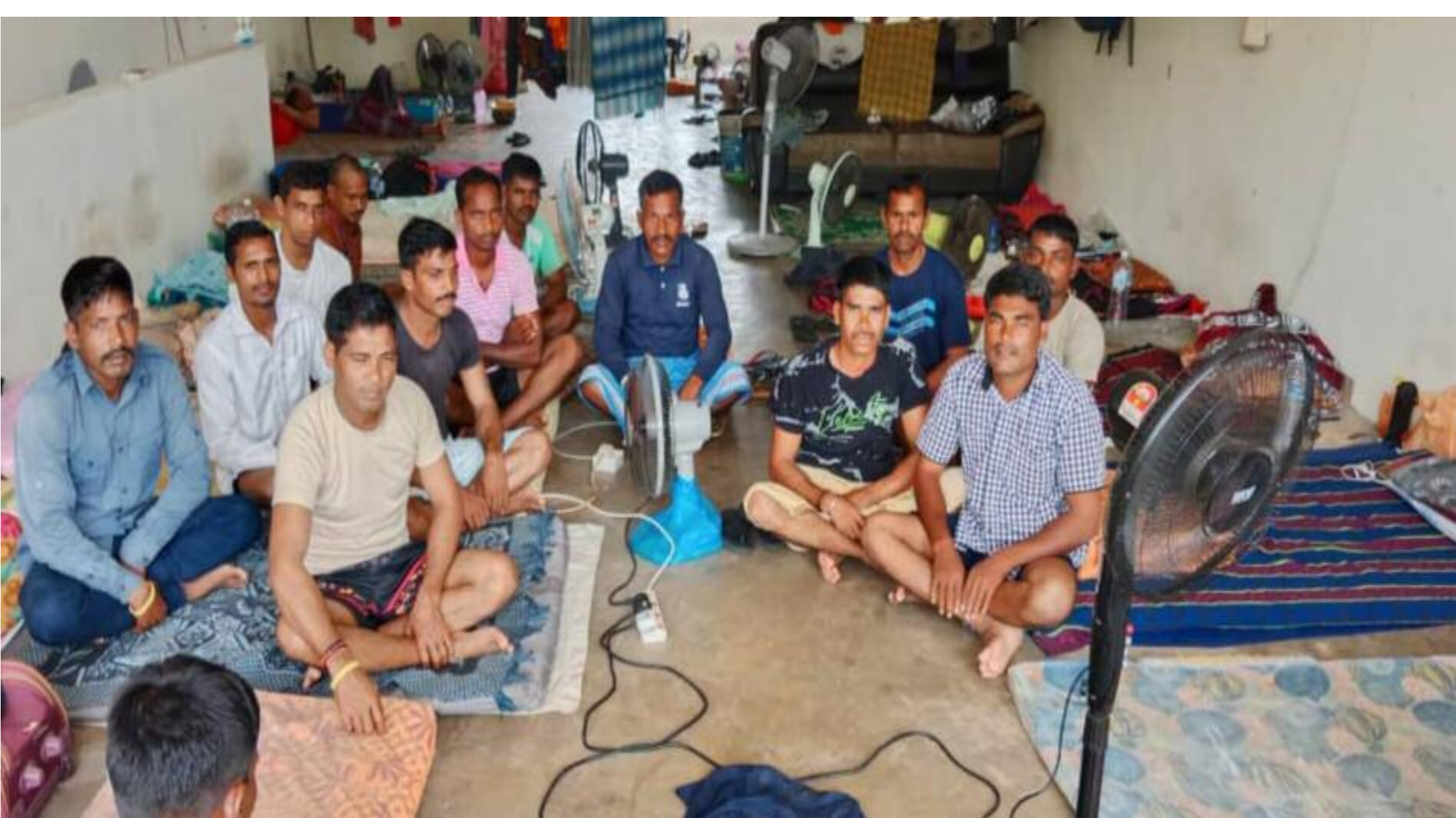
मलेशिया में फंसे झारखंड के मजदूर

दो माह बीतने के बावजूद मलेशिया में फंसे झारखंड के 30 मजदूरों की वापसी की कोई सार्थक पहल नहीं हुई है। इससे मजदूरों में निराशा है। मजदूरों के परिजन भी वापसी नहीं होने से काफी चिंतित हैं। फंसे हुए सभी मजदूर हजारीबाग, बोकारो तथा गिरिडीह जिले के रहने वाले हैं। मजदूरों ने सोशल मीडिया में पुनः वीडियो संदेश जारी कर सरकार से वतन वापसी कराने की गुहार लगाई है। वीडियो संदेश में मजदूरों ने कहा है कि सभी लीडमास्टर इंजिनियरिंग एंड कंस्ट्रक्शन एसडीएन बीएचडी के साथ तीन साल के कंन्ट्रैक्ट पर 30 जनवरी 2019 को काम करने मलेशिया गए थे। वहां मलेशिया की रा. जधानी क्वालालम्पुर के बेंटोंग में कार्यरत थे। बीते 30 जनवरी को तीन साल के एग््रीमेंट वीजा अवधि समाप्त हो चुकी है। बीते चार माह का वेतन भी बकाया है। कंपनी बकाया वेतन देने में आनाकानी