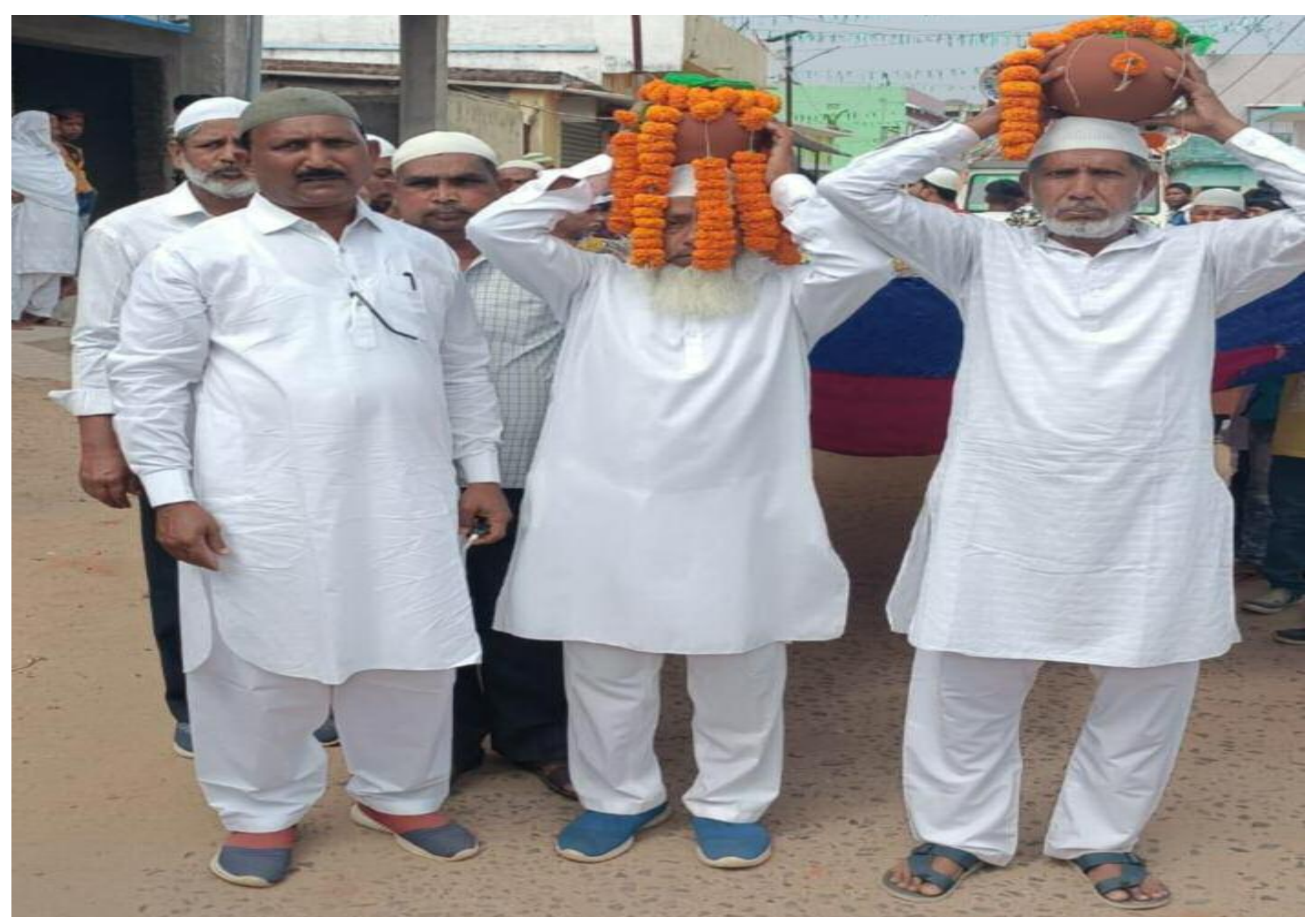
हजरत दाता मेहराब शाह की मजार पर चादरपोशी करने जाते अकीदतमंद

विष्णुगढ़ में हजरत दाता मेहराब शाह रहमतुल्लाह अलैय का 87वां दो दिवसीय सालाना उर्स महोत्सव धूमधाम से मनाया गया। इस मौके पर इस्लामिया अंजुमन कमेटी चेडरा द्वारा गाजे-बाजे के साथ चादरपोशी जुलूस निकाली गई। विष्णुगढ़ के मुख्य मार्गों से होते हुए जुलूस मजार शरीफ पहुंची। जहां दाता मेहराब शाह बाबा की मजार पर बड़ी संख्या में अकीदतमंदों ने चादरपोशी कर शांति, सौहार्द एवं सलामती की दुआएं मांगी। चादरपोशी में विष्णुगढ़ के अलावा हजारीबाग, सरिया, नवादा, बनासो, मुरगांवो, सारुकुदर, गैड़ा, बरांय, बगोदर, डुमरी, गोमियां समेत कई इलाकों से भी बड़ी संख्या में जायरीन पहुंचे। जायरीनों की सुविधा के लिए कमेटी द्वारा प्रांगण में विशेष इंतजाम किए गए थे। मजार प्रांगण में शिरनी और चादर की कई दुकानें सजी थी। वहीं, मजार प्रांगण में दिनभर कच्वाली का मुकाबला चलता रहा। मंगलवार को उर्स महोत्सव का समापन हुआ। मजार पर पहुंचे जायरीनों ने बताया कि