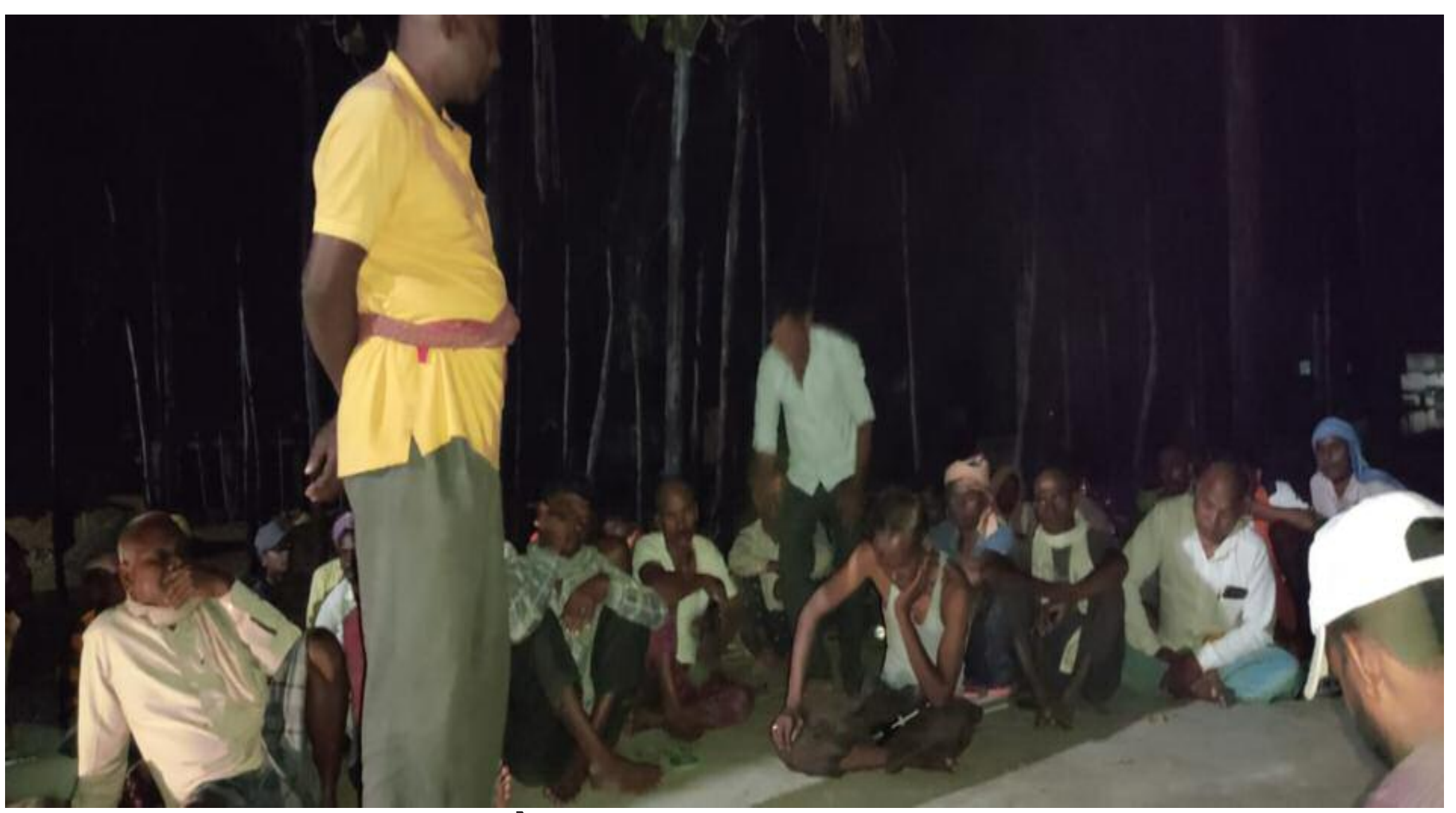
बैठक में शामिल ग्रामीण