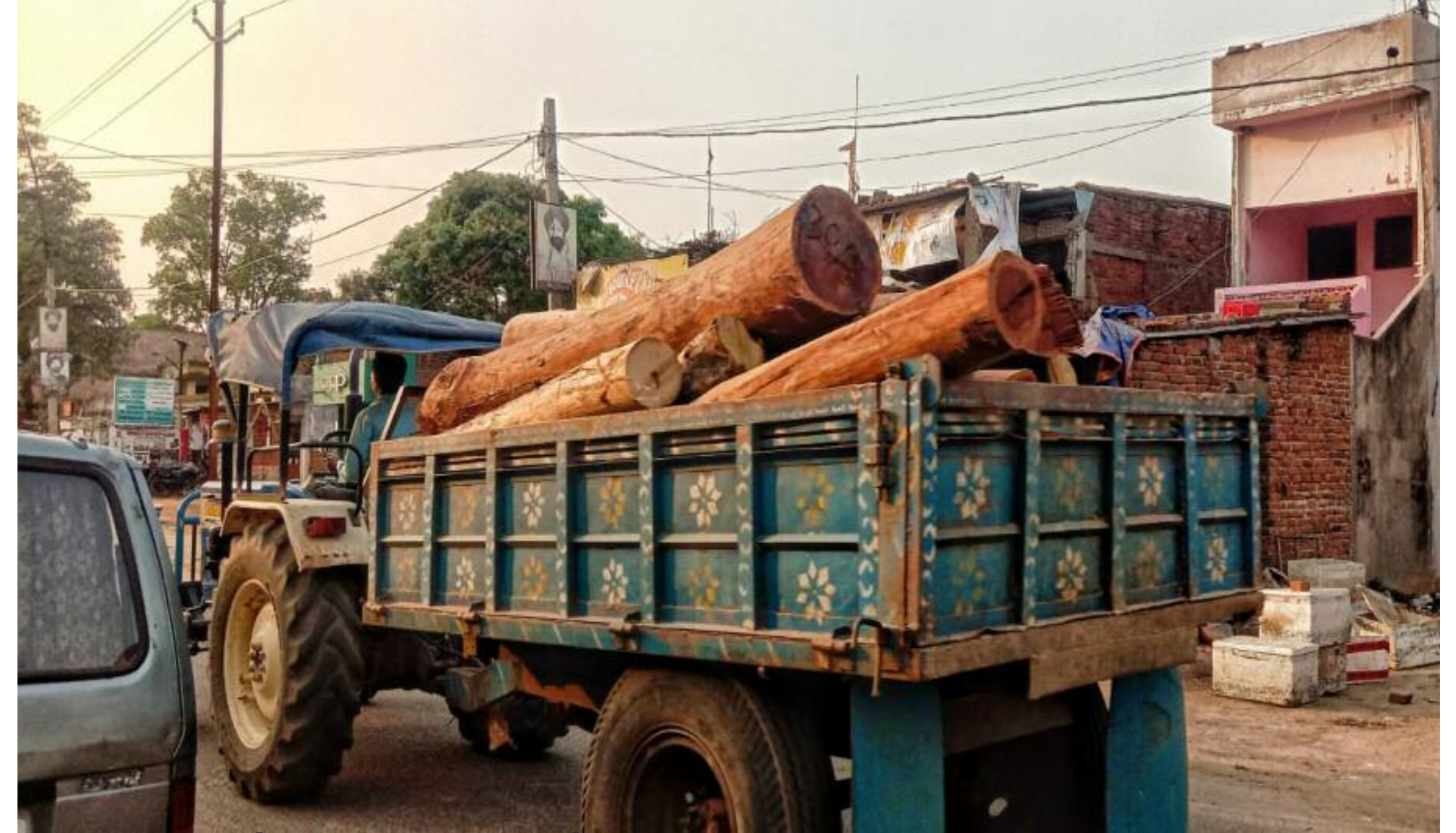
जब्त अवैध लकड़ियों को ट्रैक्टर पर लादकर ले जाती प्रशासन की टीम

प्रखंड के पूर्वी क्षेत्र स्थित जोबर पंचायत अंतर्गत बंदखारो, बलकमक्का तथा नागी में शनिवार को अवैध रूप से संचालित तीन आरा मीलों पर सघन छापेमारी की गई। गुप्त सूचना पर जिला प्रशासन की टीम द्वारा की गई औचक छापेमारी में आरा मील में बड़ी मात्रा में चीरान के लिए रखे गए लकड़ी बोटा बरामद किया गया। अवैध आरा मीलों में काम करने वाले कुछ मजदूरों को भी गिरफ्तार किया गया है। बताया जाता है कि स्थानीय प्रशासन को इसकी भनक भी नहीं लगी। जानकारी पाकर बाद में स्थानीय प्रशासन तथा वन विभाग की टीम मौके पर पहुंची। वन विभाग की टीम के पहुंचने के बाद तीनों आरा मीलों में प्रयुक्त हाथी मशीन, आरा दाती