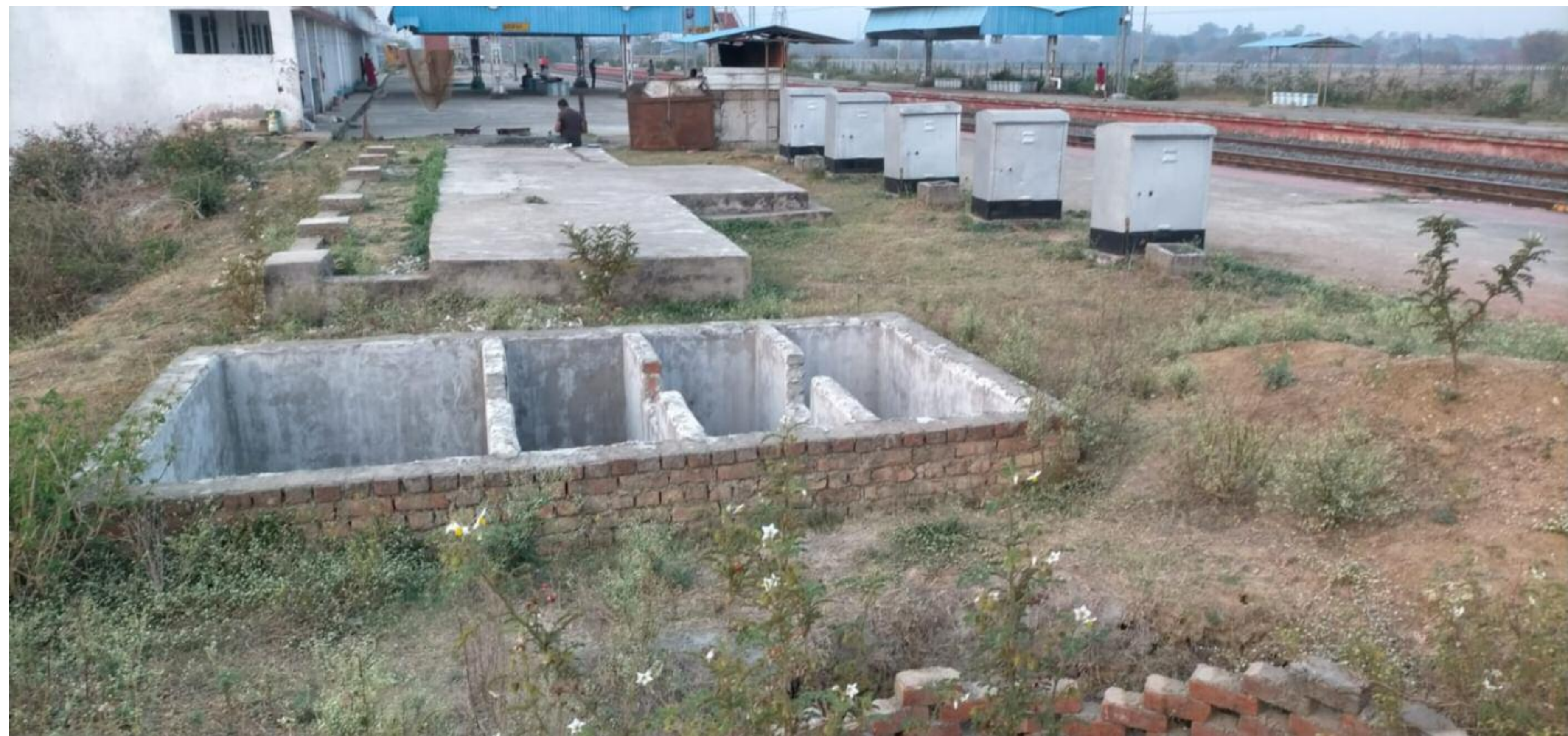
अधूरा पड़ा सार्वजनिक शौचालय

बरही रेलवे स्टेशन से काफी संख्या में यात्रियों का आवागमन होता है। इनमें महिलाओं की संख्या काफी रहती है। लेकिन इन यात्रियों के लिए जो मूलभूत सुविधाएं होनी चाहिए थी। वह उपलब्ध नहीं हो पा रही है। बरही रेलवे स्टेशन तीन तीन नेशनल हाइवे के संगम पर अवस्थित है। जिसके कारण रेलवे से यात्रा करने वाली यात्रियों की संख्या काफी रहती है। लेकिन बिडम्बना है कि इतने बड़े रेलवे स्टेशन में एक भी सार्वजनिक शौचालय नहीं है। जिसके कारण यात्रियों को खुले में शौच के लिए मजबूर होना पड़ता है। खुले में शौच के वजह से स्टेशन परिसर एवं आस पास गंदगी का अंबार रहता है। दुर्घटन फैल रहा है। एक वर्ष पहले सार्वजनिक शौचालय बनाने की पहल की गई थी। फ्लोर, सेफ्टी टैंक एवं पनसोखा आधा अधूरा बनाकर छोड़ दिया गया है। एक साल से वह अधूरा पड़ा है। सेफ्टी टैंक मात्र 6 फिट गहरा है। जबकि उसे कम से कम 10 फिट गहरा होनी चाहिए थी। पनसोखा का निर्माण भी घटिया सामग्री से किया गया है।