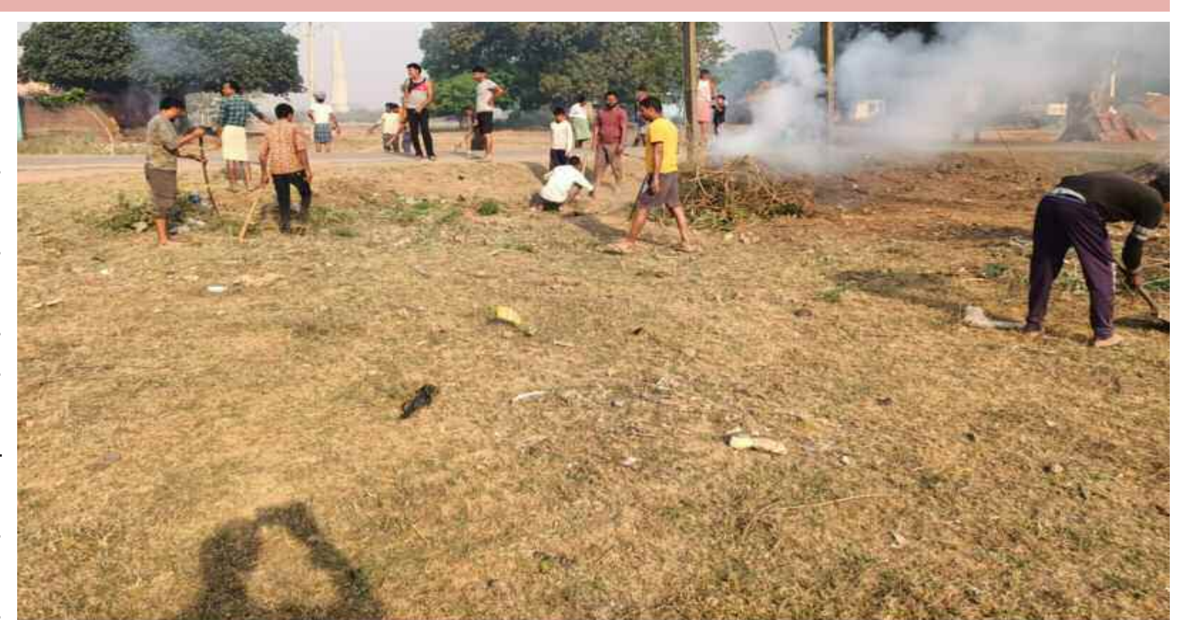
यज्ञ स्थल की साफ सफाई करते लोग।