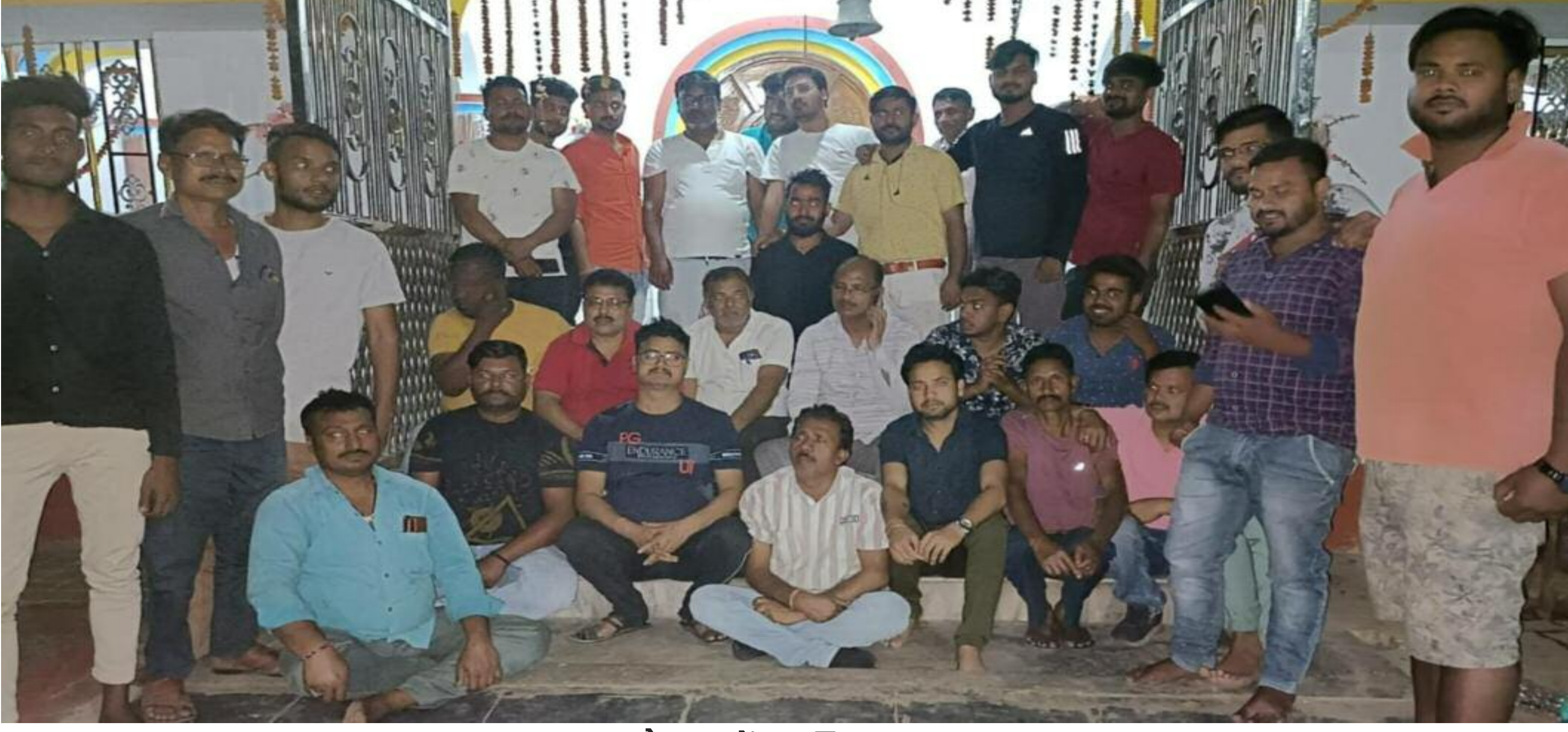
बैठक में शामिल श्रद्धालु