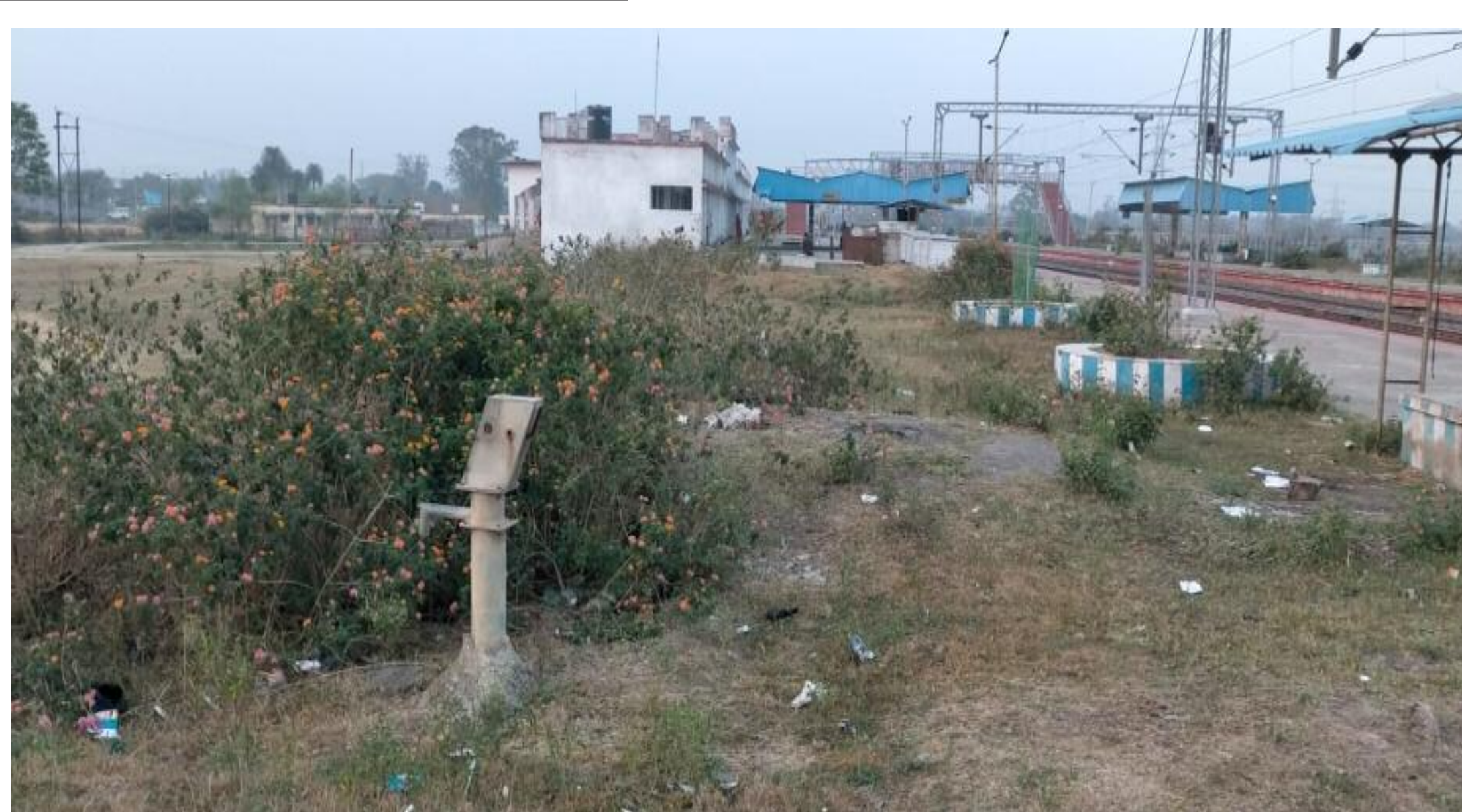
वर्षों से खराब पड़ा चापाकल