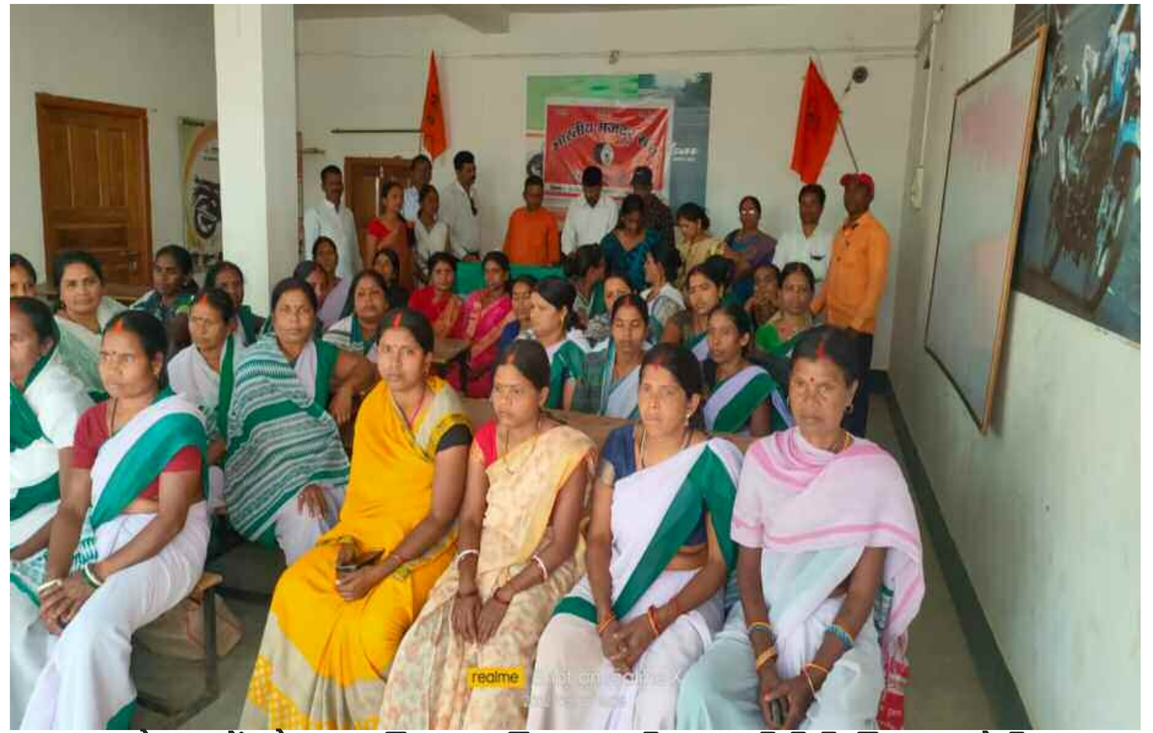
बैठक में मौजूद सहिया, सहिया साथी तथा बीटीटी जिला कमेटी