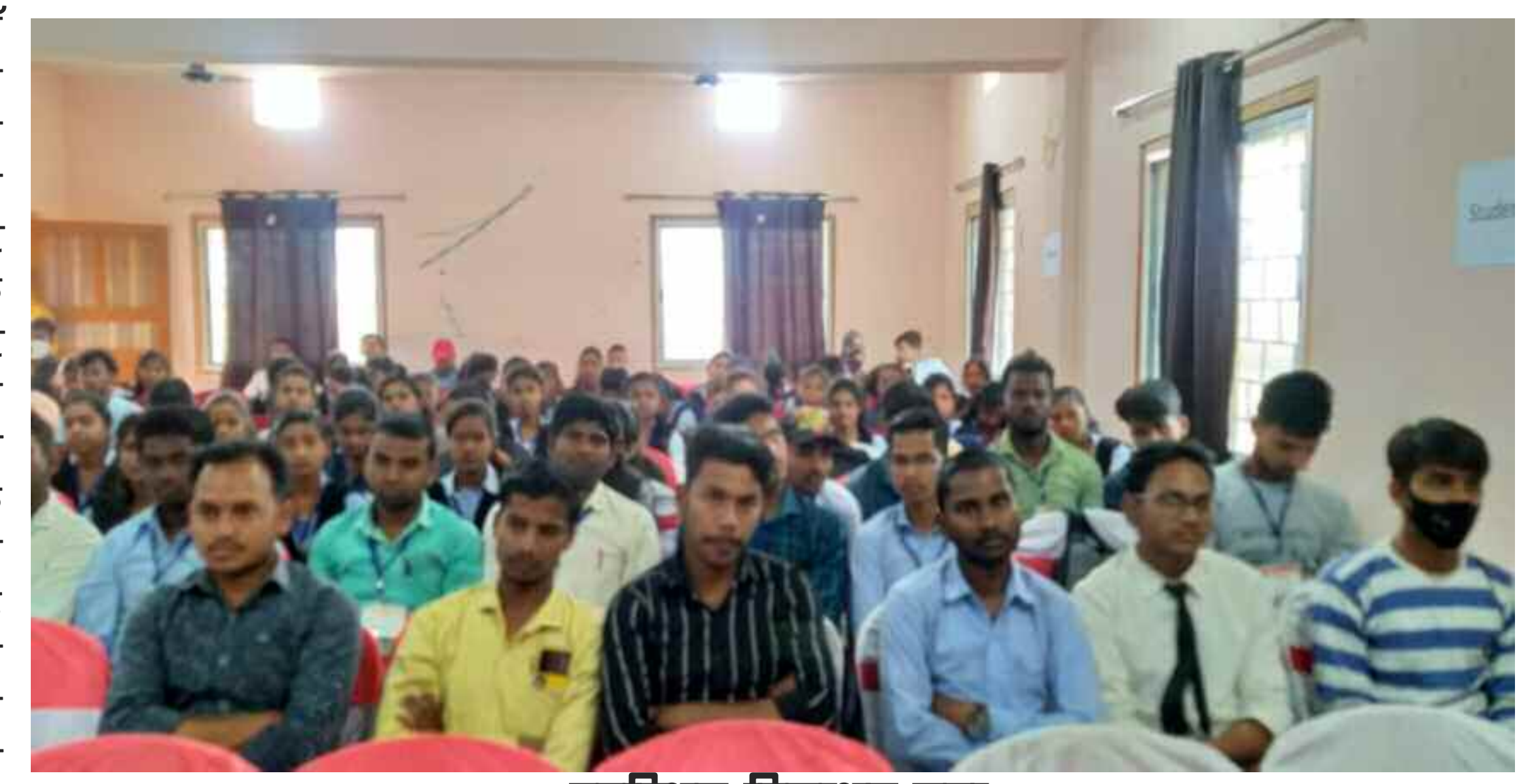
उपस्थित विद्यार्थ्य गण