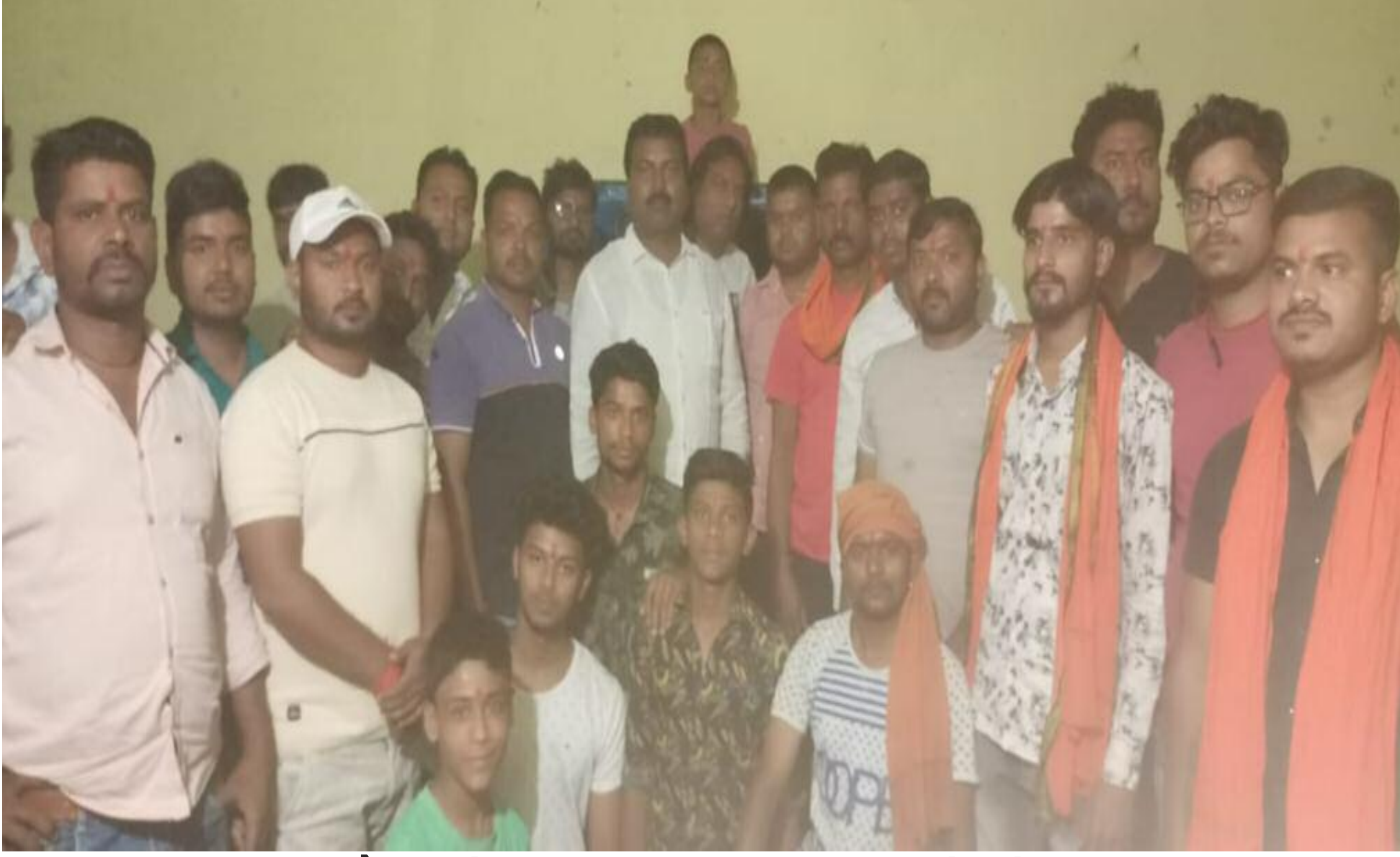
बैठक में शामिल अंजनी अखाड़ा के लोग