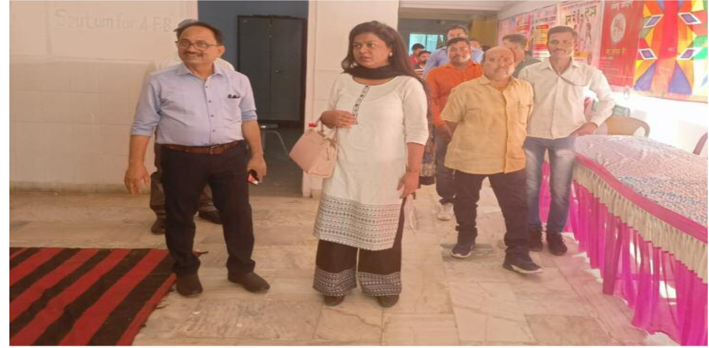
स्वास्थ्य मेला का निरीक्षण करती बरही बीडीओ