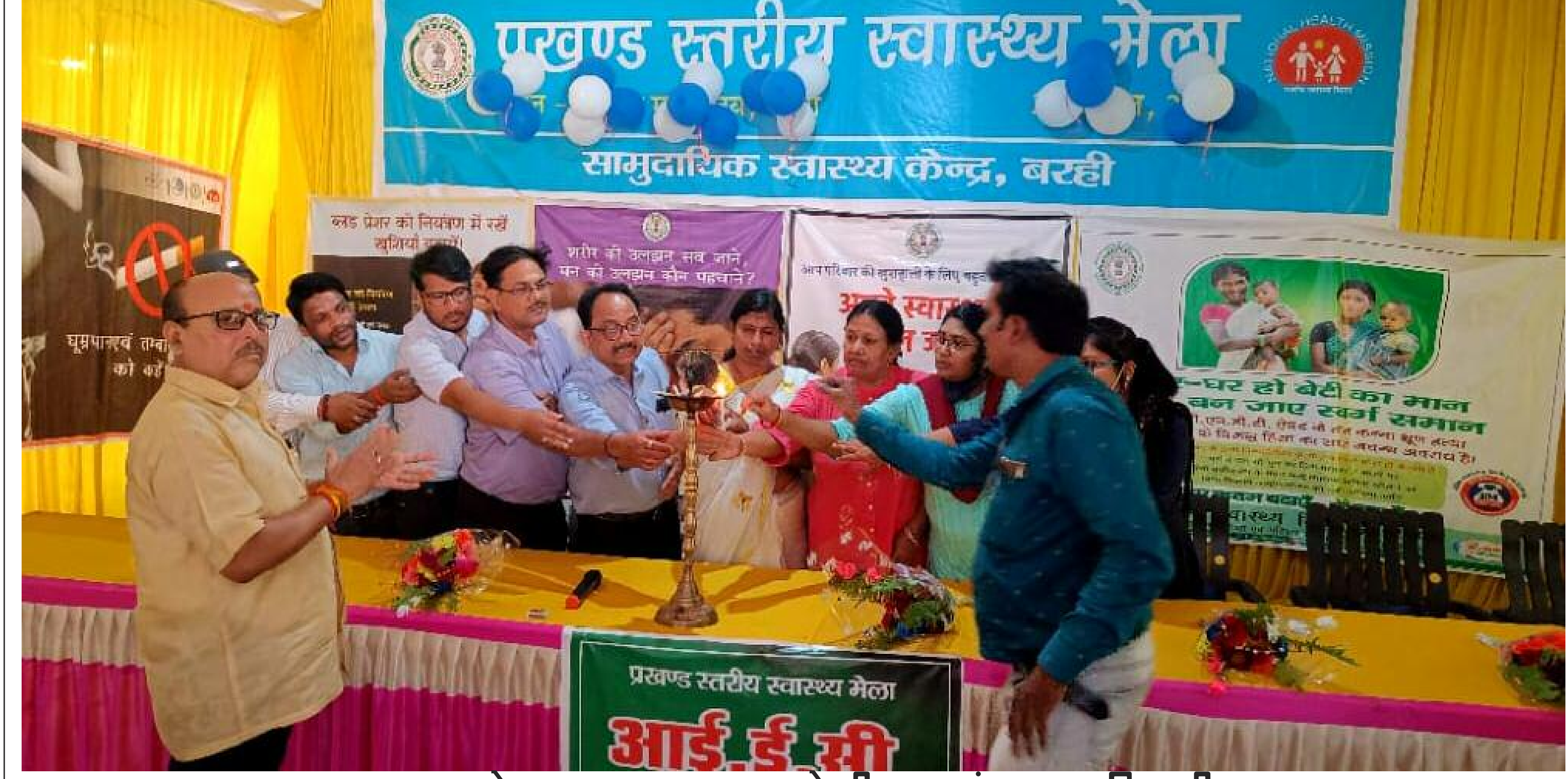
स्वास्थ्य मेला का उद्घाटन करते डीएस एवं अन्य अधिकारी