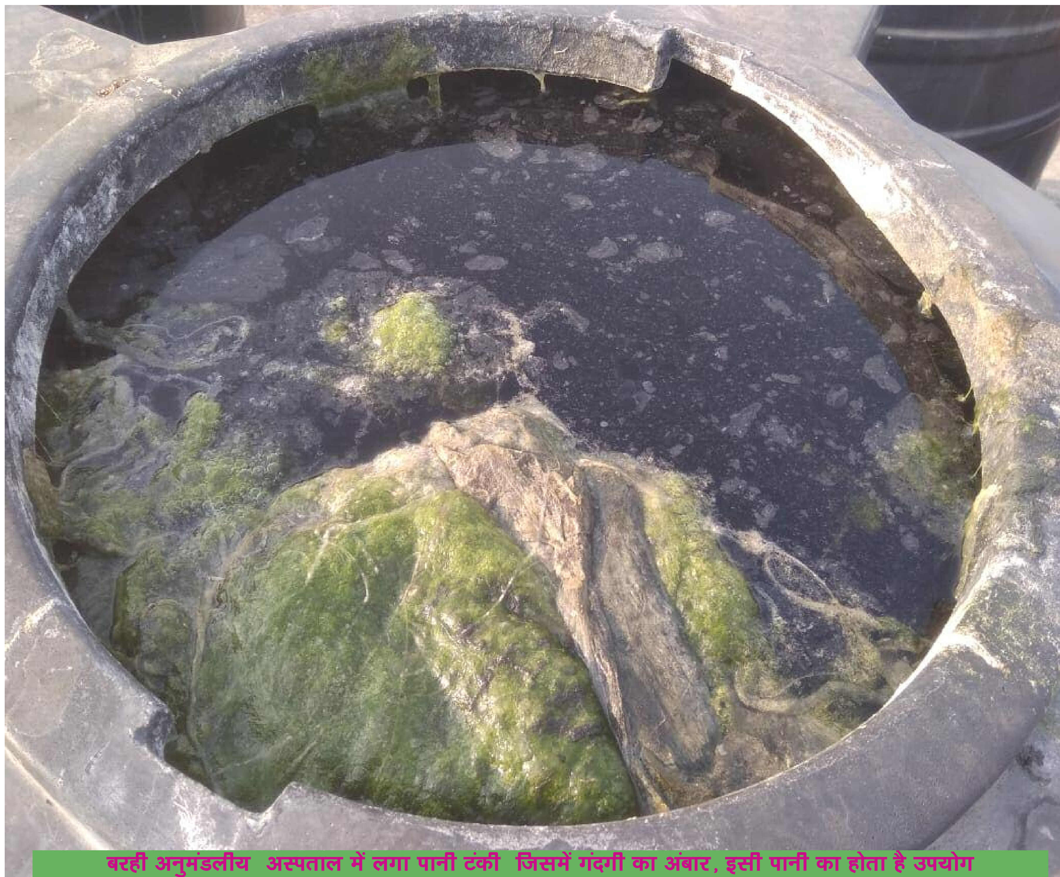
बरही अनुमंडलीय अस्पताल में लगा पानी टंकी जिसमें गंदगी का अंवार, इसी पानी का होता है उपयोग

बरही अनुमंडलीय अस्पताल के ऊपर दर्जनो पानी की टंकी लगाई गई है। जिससे अस्पताल के हर कोने तक सप्लाई की जाती है। लेकिन यदि आप पानी की टंकी को देखेंगे तो आपको उल्टी हो जाएगी। उसी पानी का उपयोग अस्पतालकर्मि एवं मरीज भी करते हैं। हालांकि पीने के लिए आरओ का पानी की व्यवस्था किया गया है। लेकिन पीने के अलावे अन्य कार्य इसी गंदे पानी से किया जाता है। 25 से अधिक पानी की टंकी है। इनमे अधिकांश टंकीयां बिना ढक्कन के हैं। जिसके कारण पंछियां भी उसी में शौच कर निकल जाती हैं। सूत्रों से मिली जानकारी के अनुसार ढक्कन खुला होने के कारण सफाईकर्मि भी उस पानी को गंदे कपडे धोने में करते हैं। यह स्थिती आज की नहीं , बल्कि कई महीनों से हैं। पानी की टंकी में काई और शैवाल को स्पष्ट तौर पर देखा जा सकता है। जो अस्पताल हमलोगों को स्वच्छता का पाठ सिखाता है। वही अस्पताल में