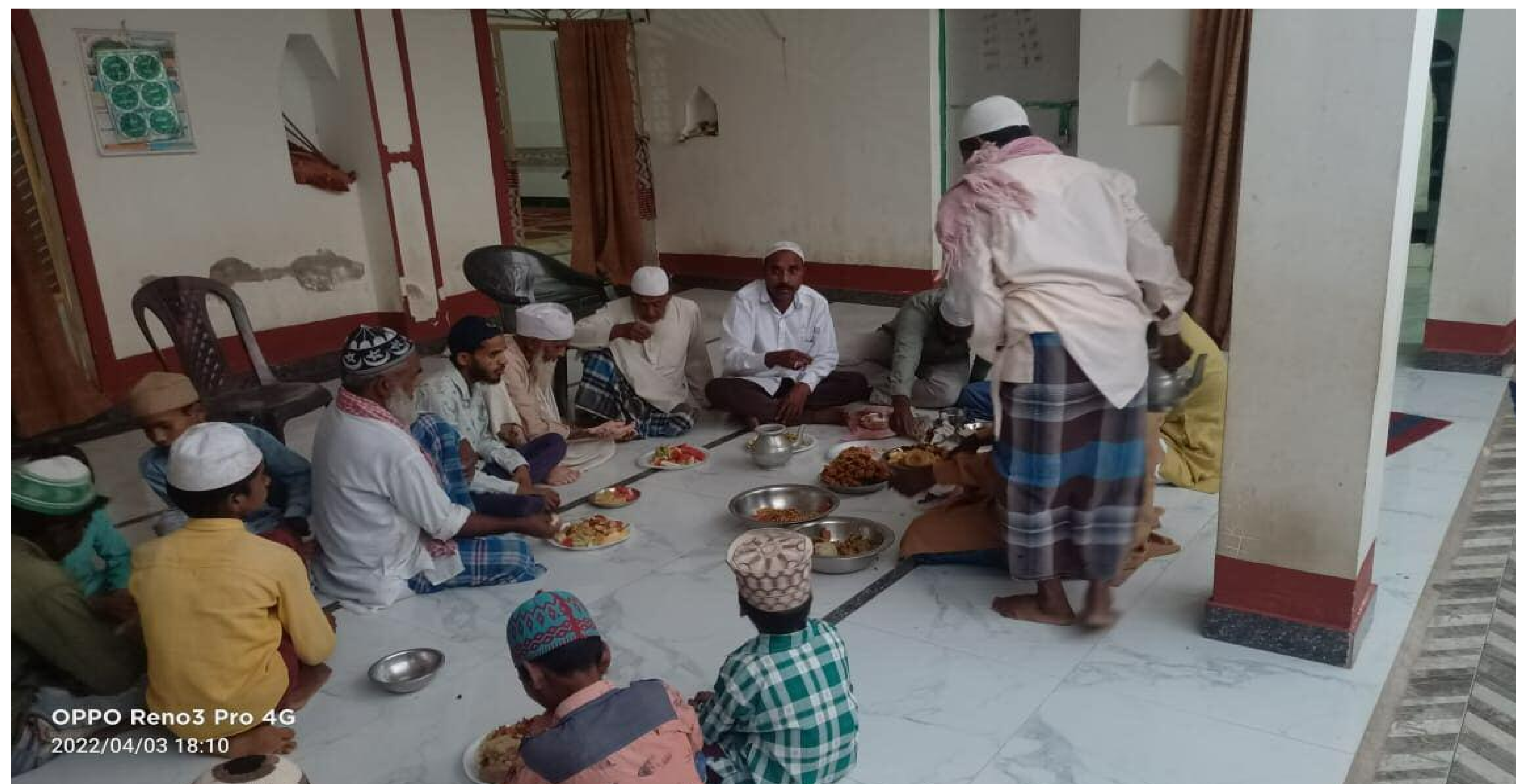
OPPO Reno3 Pro 4G 2022/04/03 18:10