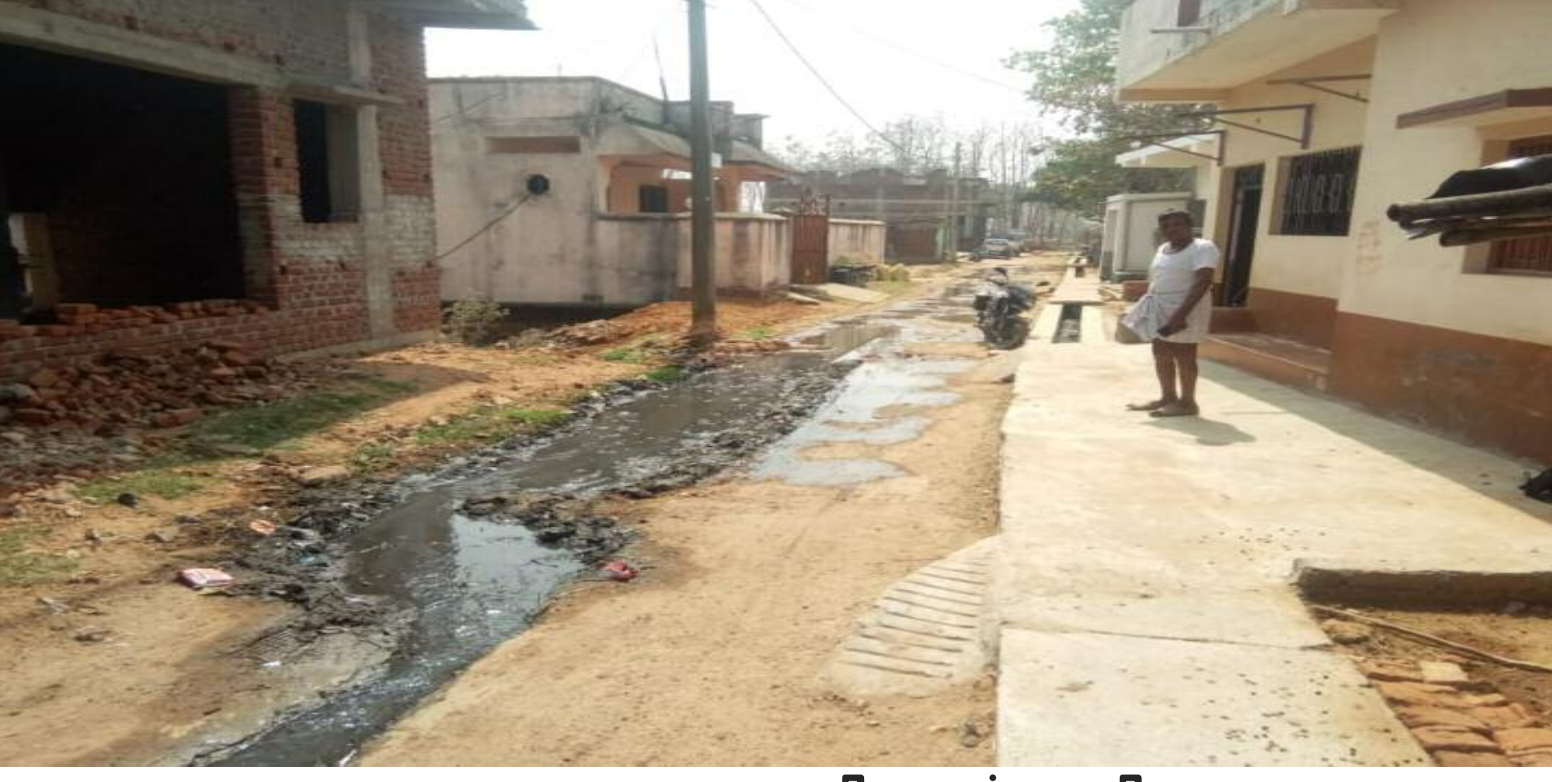
सड़क पर बहता नाली का गंदा पानी