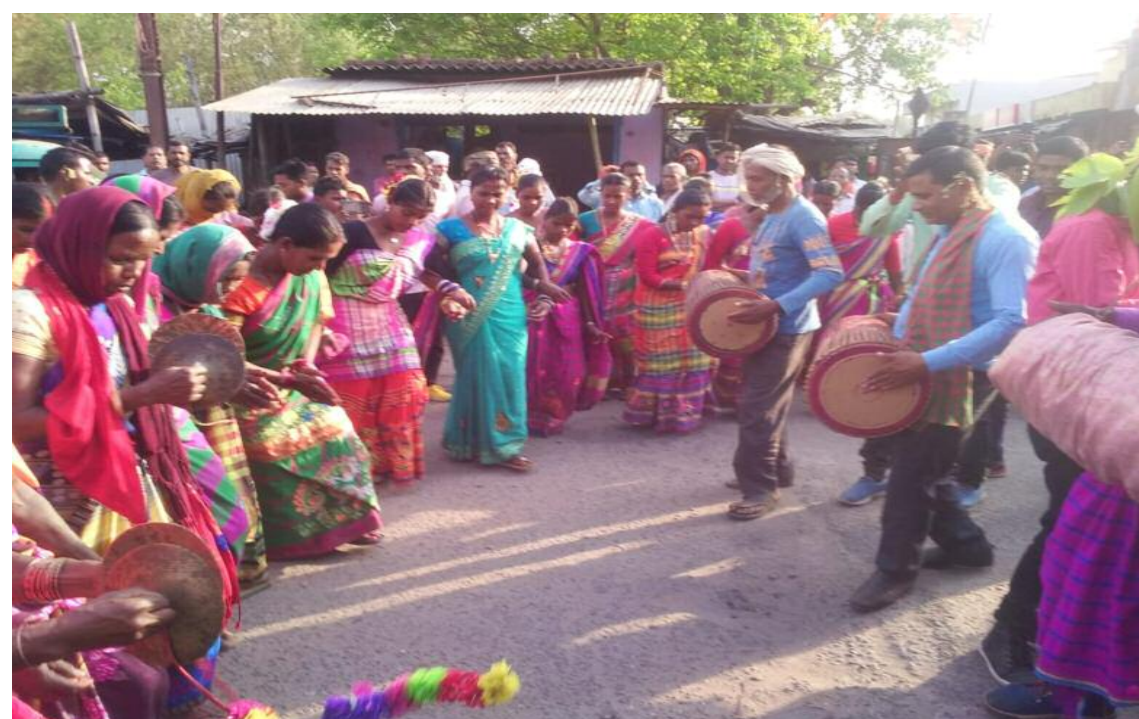
सरहुल पर निकाली गई शोभायात्रा में झूमते गाते आदिवासी समुदाय के लोग

विष्णुगढ़ और इसके आसपास के इलाकों में आदिवासी समुदाय का महापर्व सह प्रकृति पर्व सरहुल धूमधाम से मनाया गया। इसे लेकर झारखंड आदिवासी संथाल समिति के बैनर सोमवार को विष्णुगढ़ में भव्य शोभायात्रा निकाली गई। विष्णुगढ़-खरना रोड स्थित पड़वापोखर के मैदान में आदिवासी समुदाय के बड़ी संख्या में महिला पुरुष पा. रंपरिक गाजे-बाजे के साथ पारंपरिक पोशाक पहन शामिल हुए। इसके बाद सातमील मोड़, हॉस्पिटल चौक, अखाड़ा चौक, ब्लॉक रोड होते हुए शोभायात्रा का पुनः पड़वापोखर पहुंचकर समापन हुआ। पूरे शोभायात्रा के दौरान आदिवासी समुदाय के लोग झुमर गीतों के साथ नाचते-गाते झूमते रहे। इसके पूर्व सरना स्थल पर