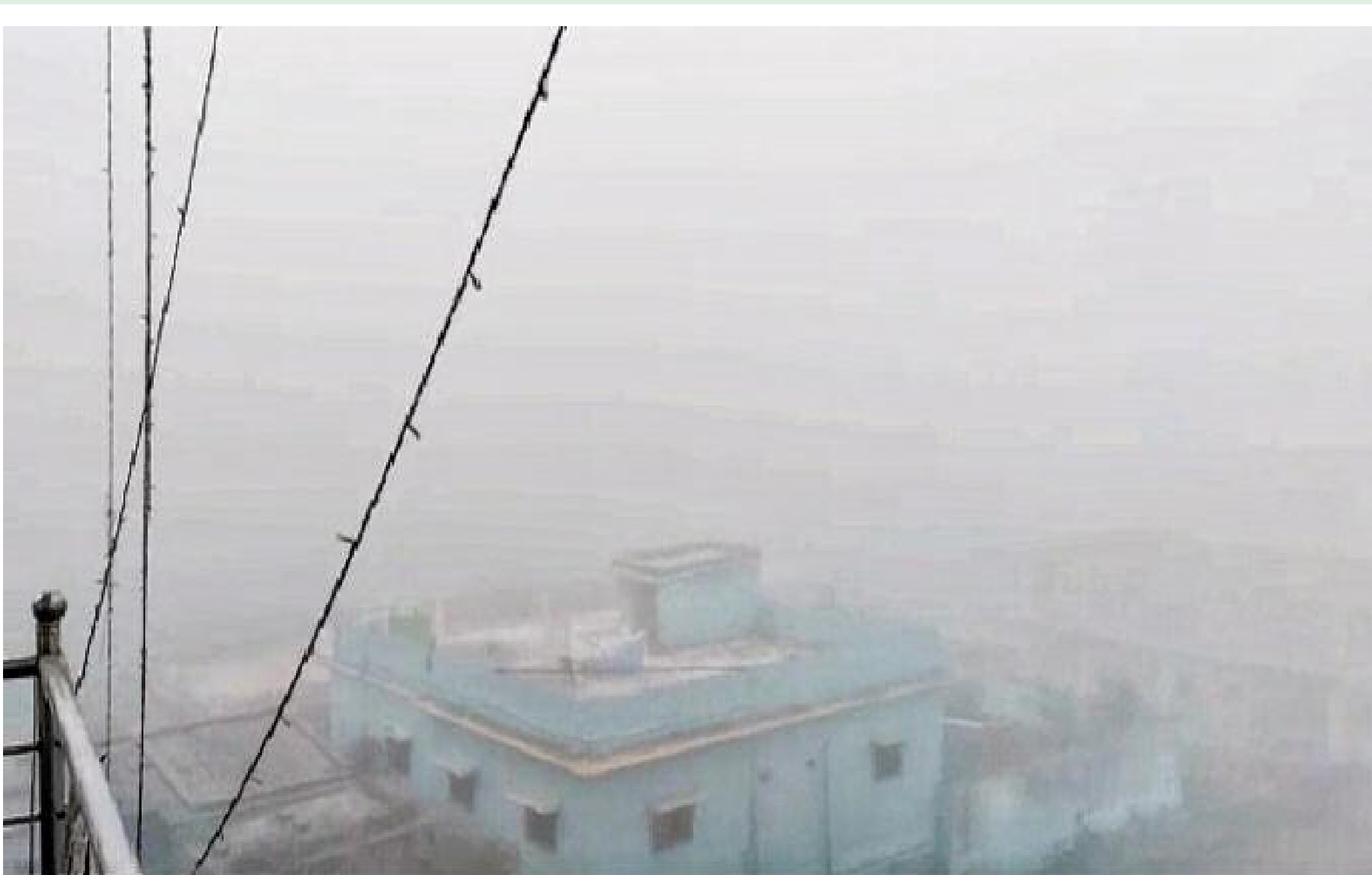
विष्णुगढ़ में मंगलवार की सुबह छाया घना कोहरा