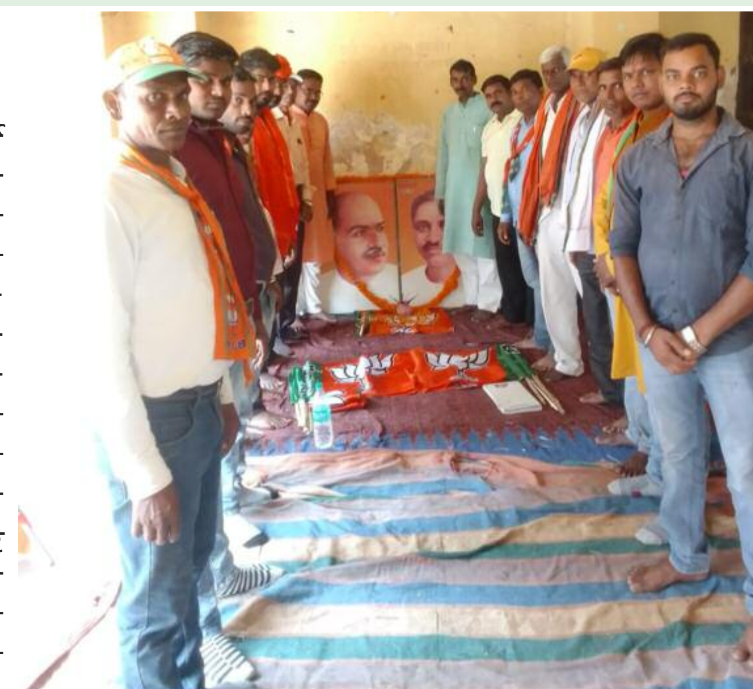
स्थापना दिवस मनाते भाजपाई