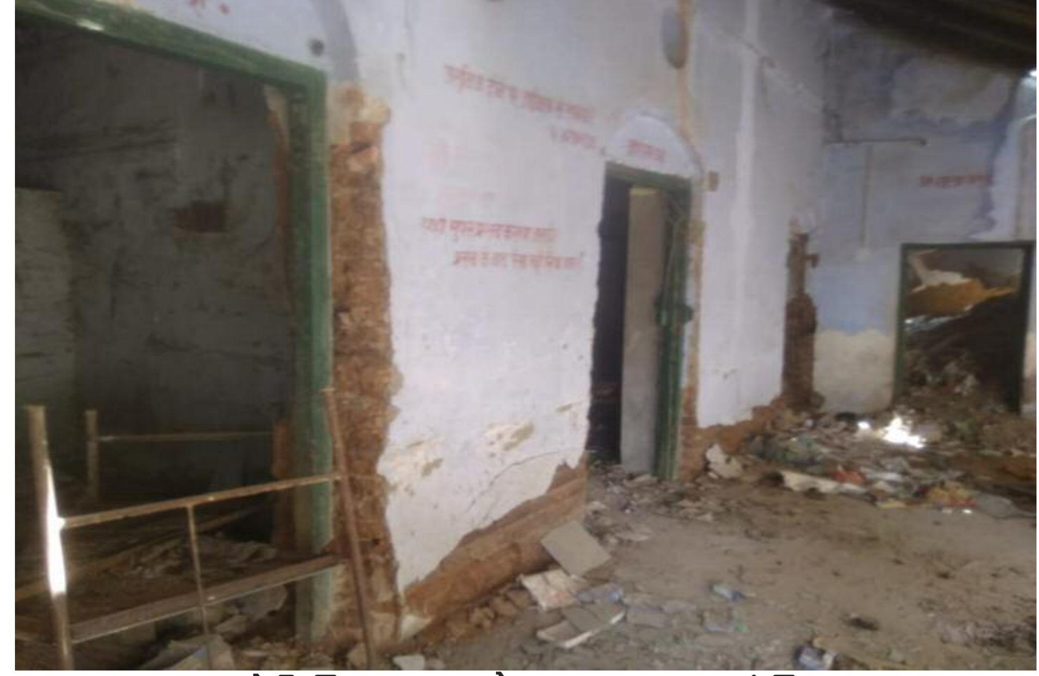
चोरी किया गया चौखठ, दरवाजा एवं झिल