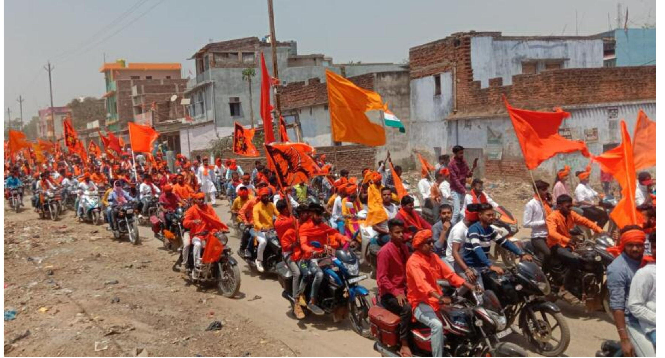
विष्णुगढ़ में रामनवमी महासमिति के जुलूस में शामिल रामभक्तों का जत्था

रामनवमी महापर्व से पूर्व महाअष्टमी को प्रखंड के बनासो स्थित मां महामाया बागेश्वरी मंदिर में परंपरागत अस्त्र-शस्त्रों के पूजन की परंपरा रही है। हजारों की संख्या में रामभक्त विष्णुगढ़ से बनासो पहुंचकर मां बागेश्वरी के दरबार में अस्त्र-शस्त्रों की विधि विधान से पूजा करते हैं। इसे लेकर शनिवार को विष्णुगढ़ रामनवमी महासमिति के द्वारा भव्य जुलूस निकाला गया। जिसमें विभिन्न अखाड़ों एवं रामनवमी समिति के बड़ी संख्या में रामभक्त शामिल हुए। रमुवां स्थित सार्वजनिक दुर्गा मंदिर परिसर से निकल कर जुलूस में रामभक्त जयकारा लगाते हुए पैदल हॉस्पिटल चौक, अखाड़ा श्रद्धालुओं के लिए फलाहार एवं शीतल पेय की बेहतर व्यवस्था की गई थी। दो