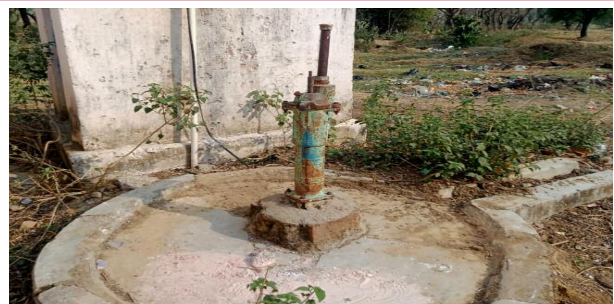
खराब पड़ा चापाकल