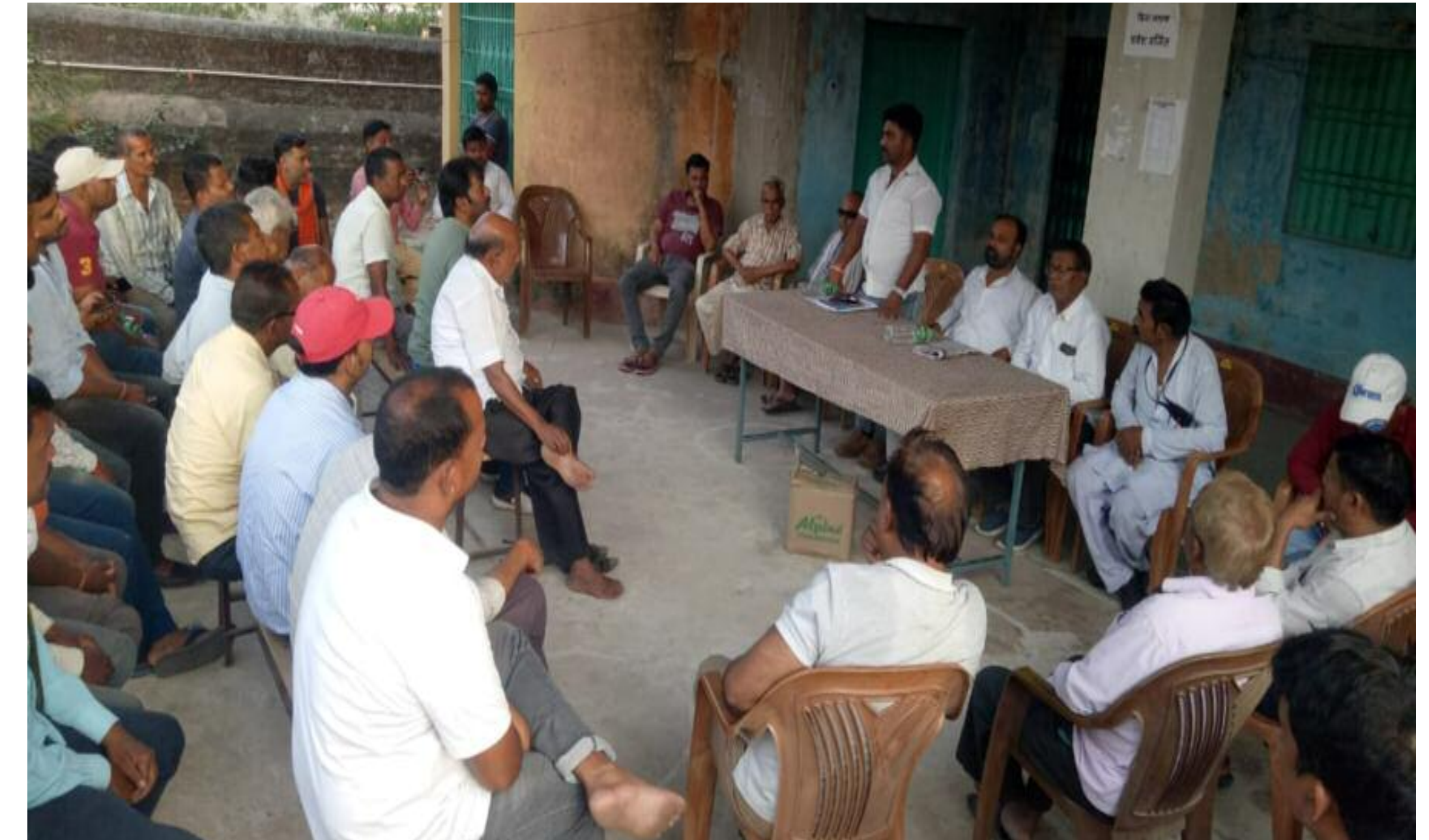
डोमचांच में बुद्धिजीवियों की बैठक