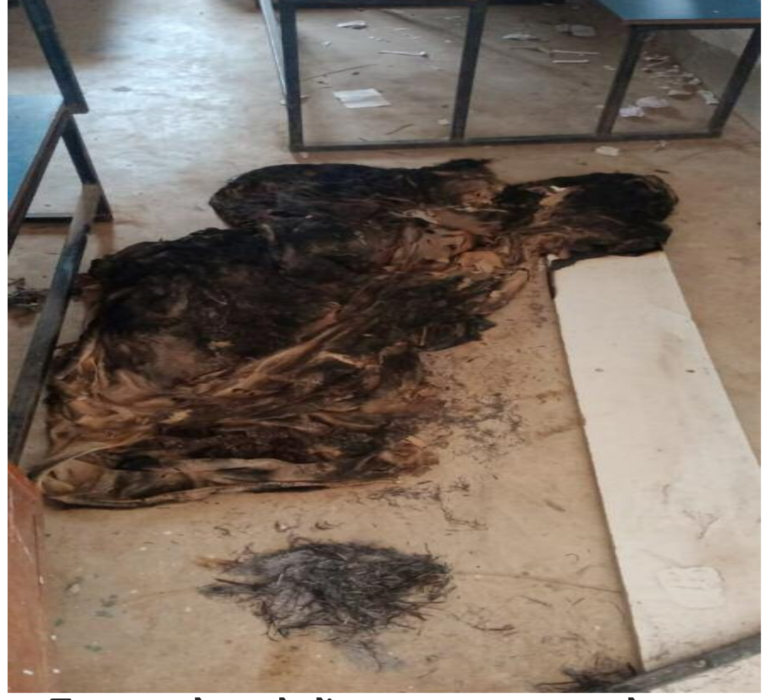
विद्यालय के कमरे में जलता हुआ दरह समेत अन्य

असामाजिक तत्वों ने मंगलवार को उत्कमित उच्च विद्यालय चौथा के कक्षा छह के कमरे में आग लगा दी। इससे कक्षा के कुछ बेंच, दर्सी तथा साफ सफाई के लिए रखा झाड़ू जलकर खाक हो गए। घटना स्कूल की छुट्टी होने के बाद लगभग दो बजे हुई। बताया जाता है कि दोपहर 12 बजे विद्यालय बंद कर शिक्षक समेत विद्यालयकर्मी घर चले गए। थोड़ी देर के बाद विद्यालय के कमरे से