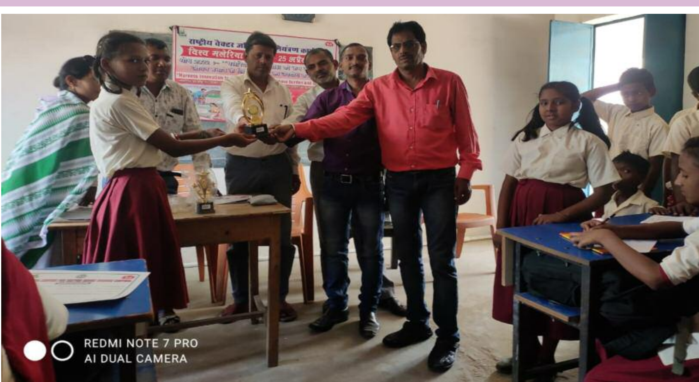
विश्व मलेरिया दिवस पर आयोजित प्रतियोगिता के सफल प्रतिभागियों को पुरस्कृत करते अतिथि

विश्व मलेरिया दिवस पर सामुदायिक स्वास्थ्य केन्द्र द्वारा जागरूकता अभियान चलाया जा रहा है। इसे लेकर नरकी स्थित राजकीयकृत मध्य विद्यालय में विजय, स्लोगन एवं चित्रांकन प्रतियोगिता का आयोजन किया गया। वेक्टर जनित रोग नियंत्रण कार्यक्रम के तहत बच्चों को मलेरिया, फाइलेरिया, डेंगू, कालाजार, जेई, चिकनगुनिया आदि रोगों के बारे में जानकारी दी गई। इसके अलावा इसके बचाव के उपायों के बारे में भी बताया गया। कार्यक्रम का उद्देश्य बच्चों के बीच वेक्टर जनित रोगों से बचाव की जानकारी उपलब्ध कराना है। बच्चे घर जाकर अपने