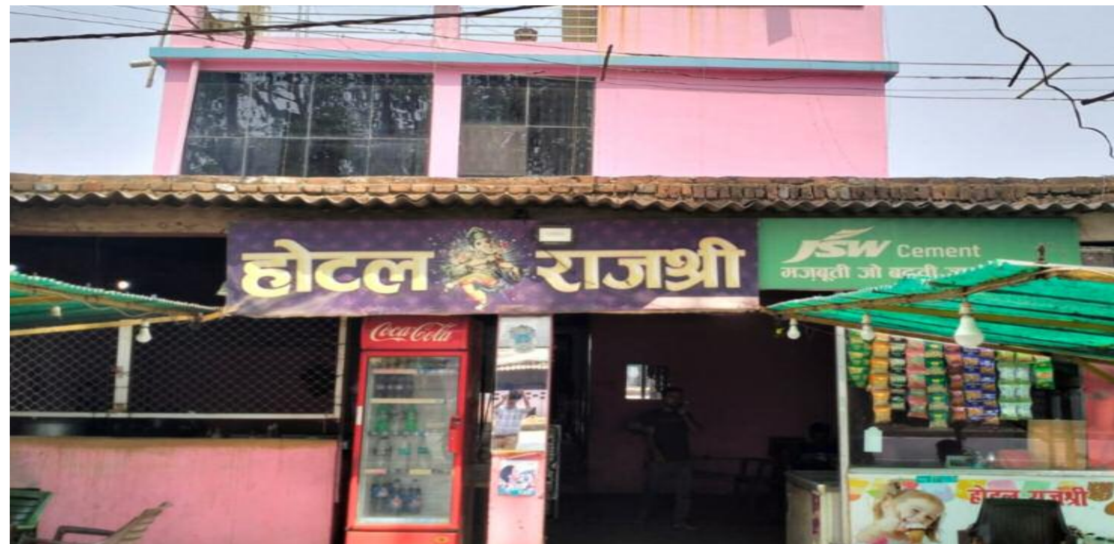
इसी होटल के ऊपर चल रहा था गोरखधंधा