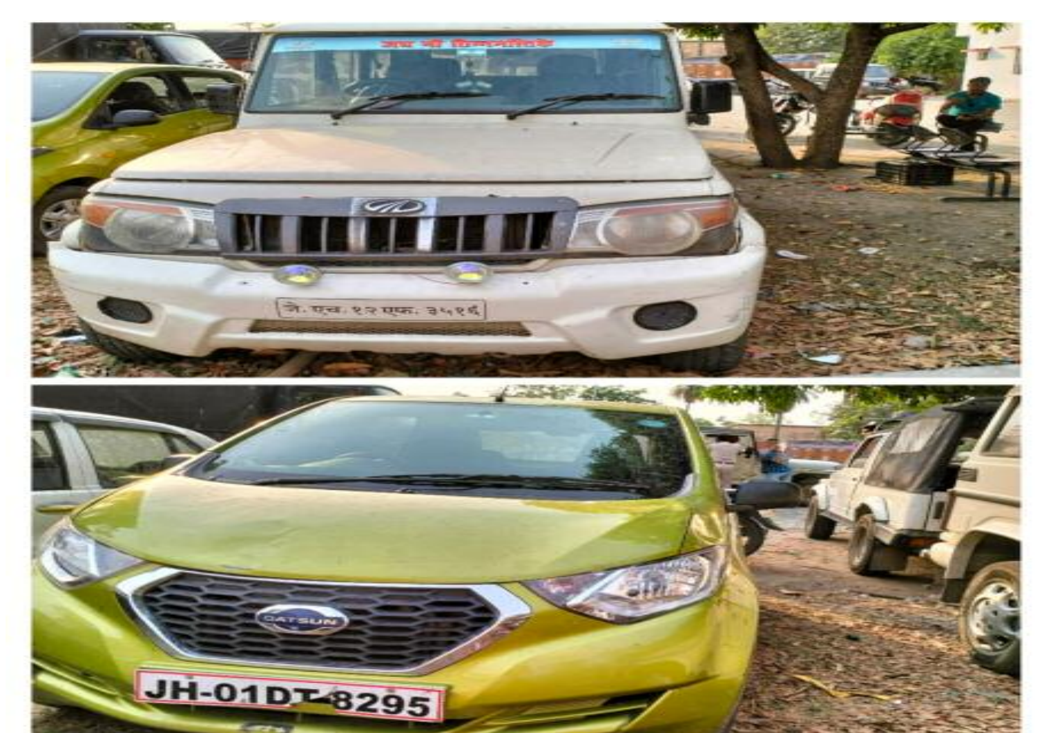
पकड़ा गया कार एवं बोलेरो

लड़कियों को पहुंचाने का काम किया जाता था। हलांकि पुलिस इस मामले में हर पहलुओं पर जांच कर रही है।