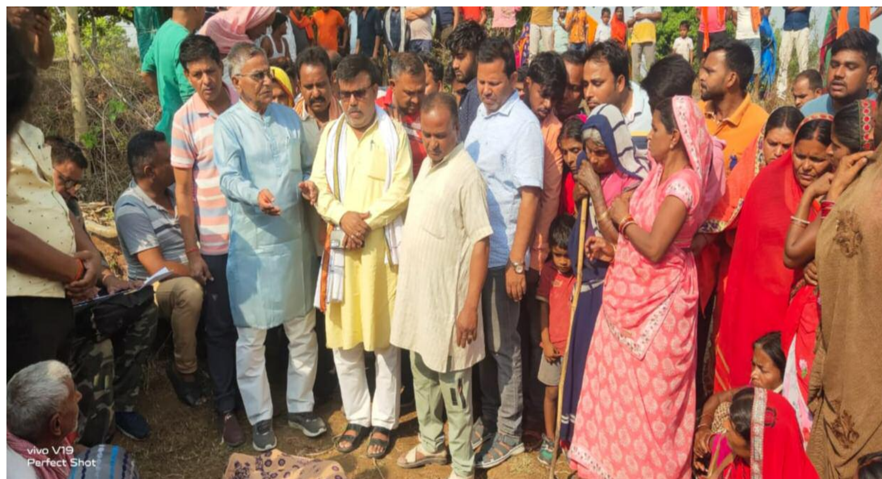
घटना स्थल पर मौजूद लोग