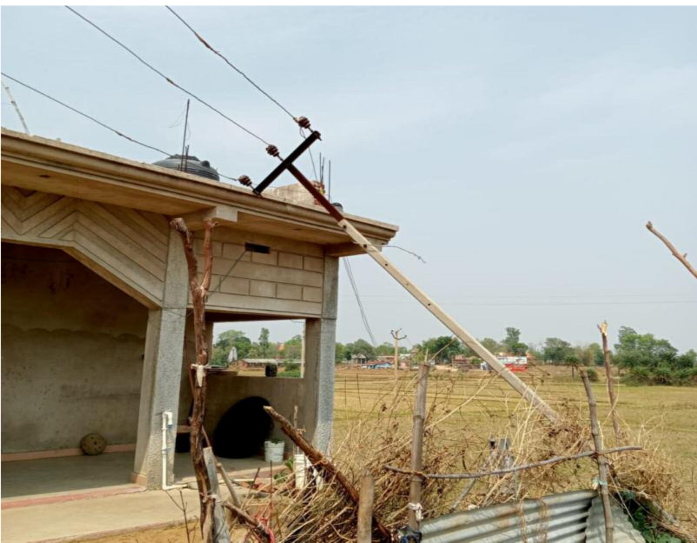
घर पर गिरा पोल सहित 11 हजार वोल्ट का बिजली तार

आंधी तूफान से घर पर गिरा बिजली पोल सहित 11000 वोल्ट का तार, बाल बाल बचे लोग