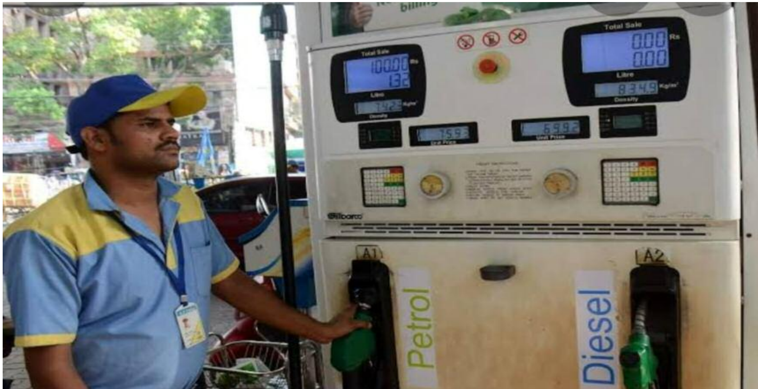
बरहीवासियों में खुशी

पेट्रोल डीजल, एवं घरेलू गैस के दाम घटने से