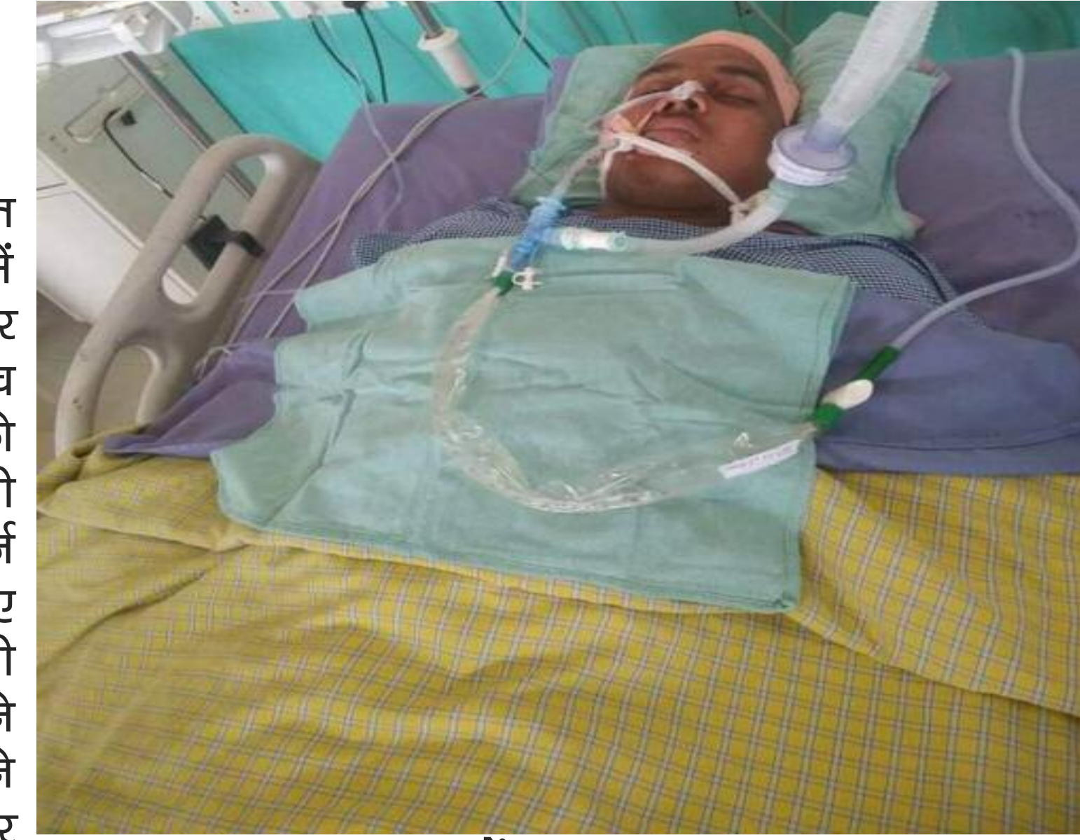
अस्पताल में इलाजगत घायल