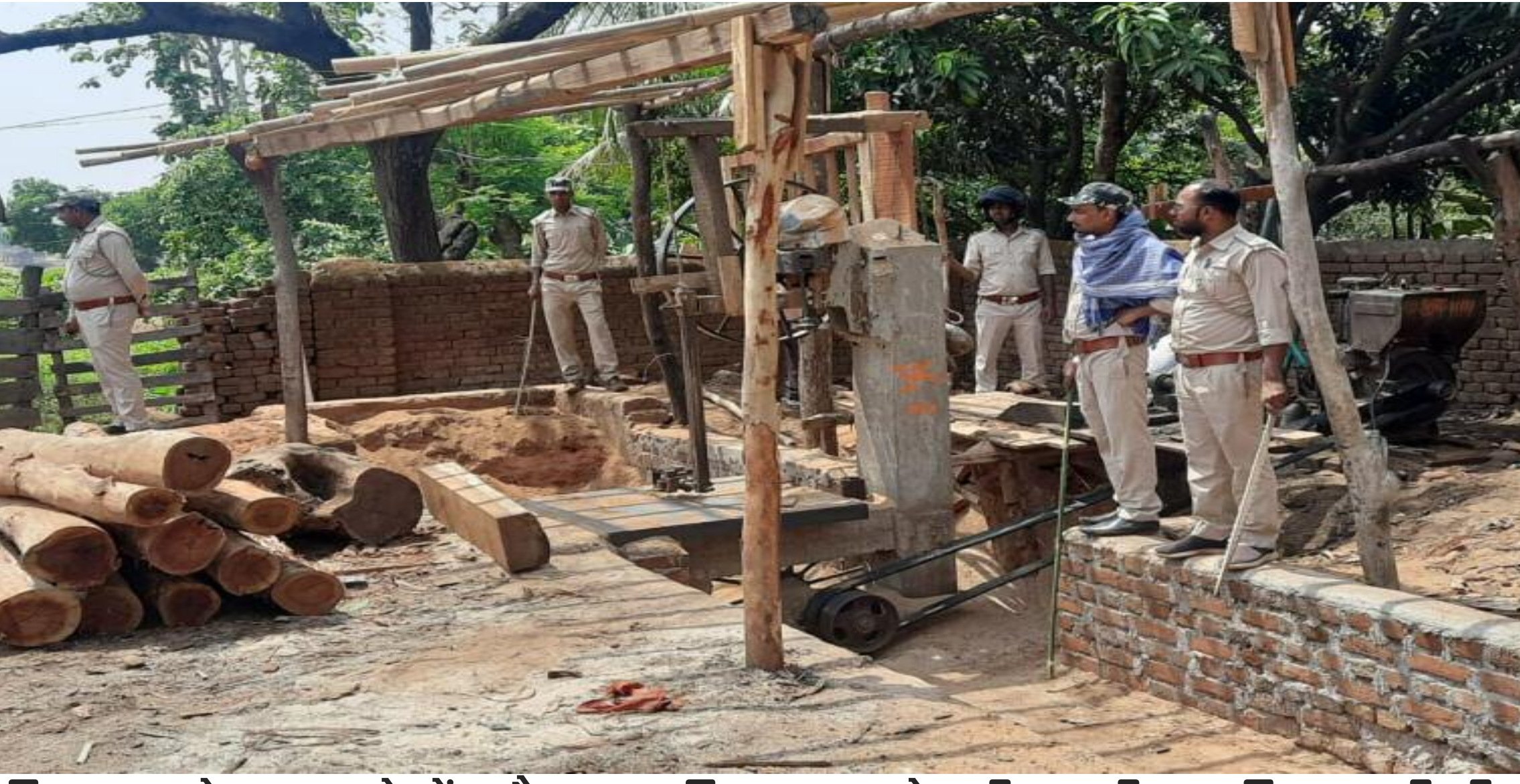
विष्णुगढ़ के करगालो में अवैध आरामिल पर छापेमारी करती वन विभाग की टीम