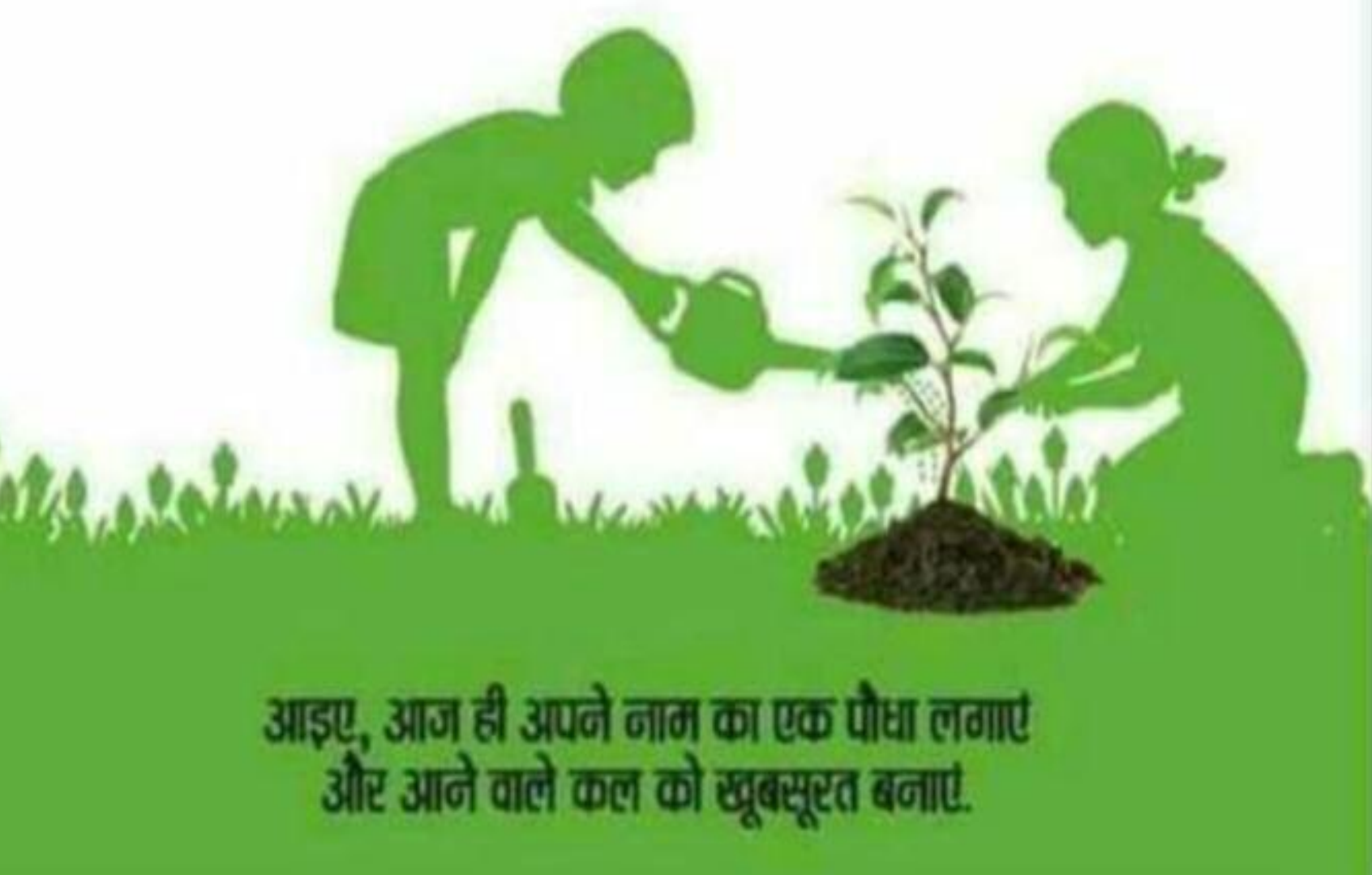
आइए, आज ही अपने नाम का एक पौधा लगाएं और आने वाले कल को खूबसूरत बनाएं।