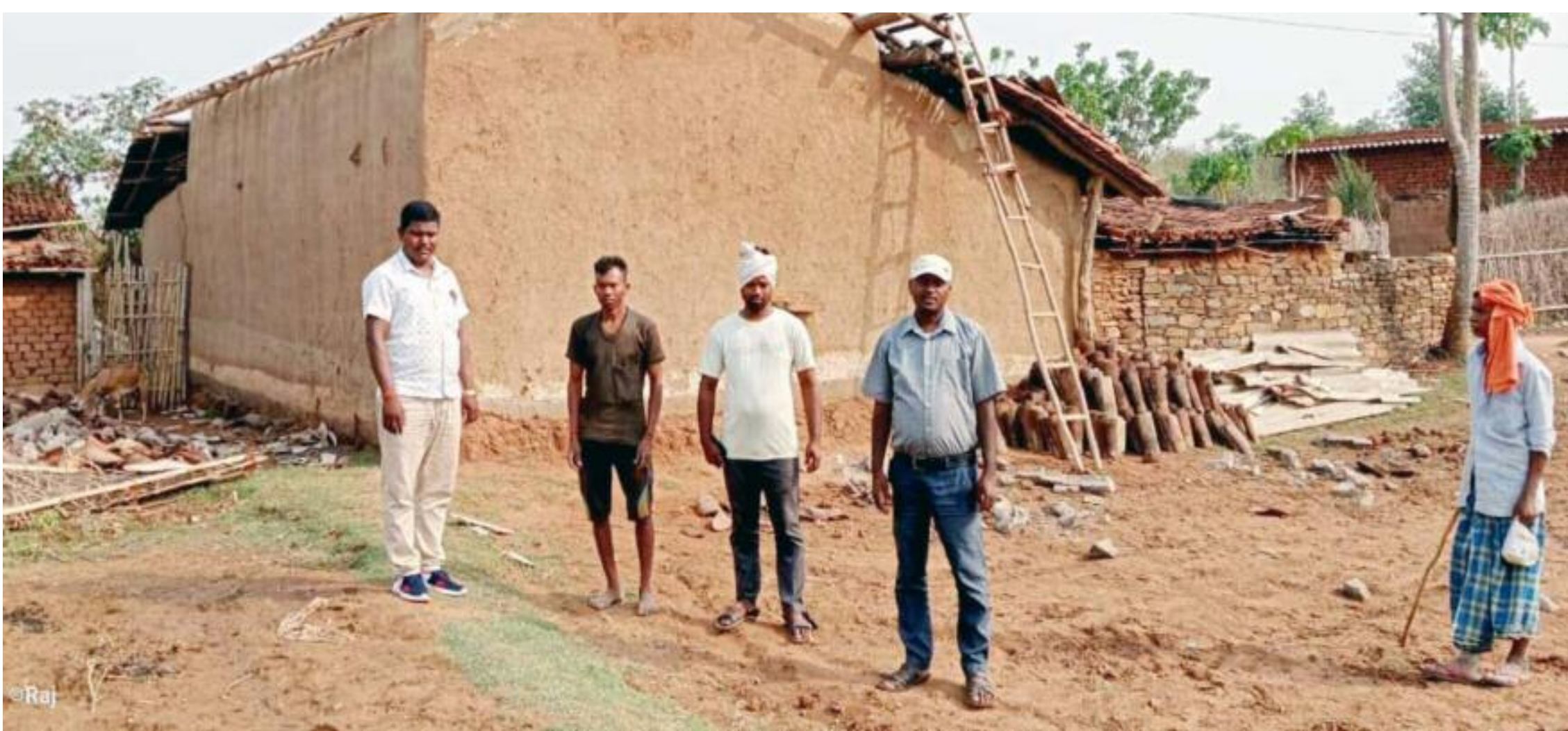
विष्णुगढ़ के मड़मो में तेज तूफान के कहर से क्षतिग्रस्त हुआ घर