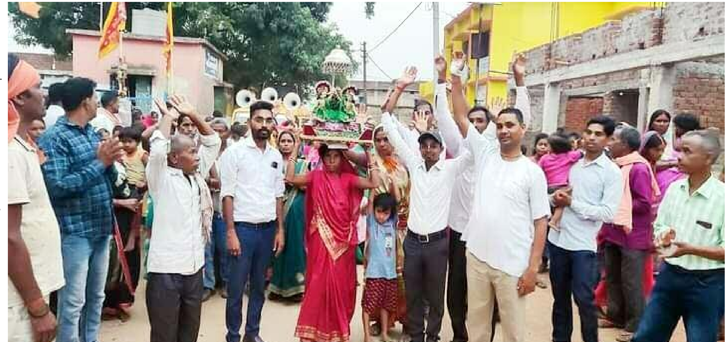
विष्णुगढ़ में राधे कृष्ण नगर संकीर्तन करते श्रद्धालु एवं ग्रामीण