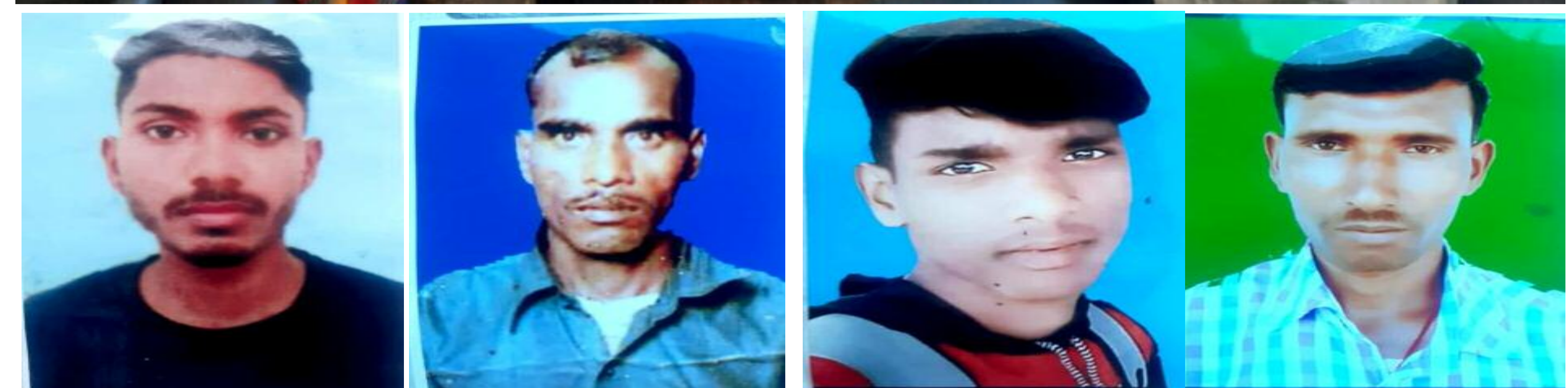
केरल में बंधक बनाए गए व्यक्ति