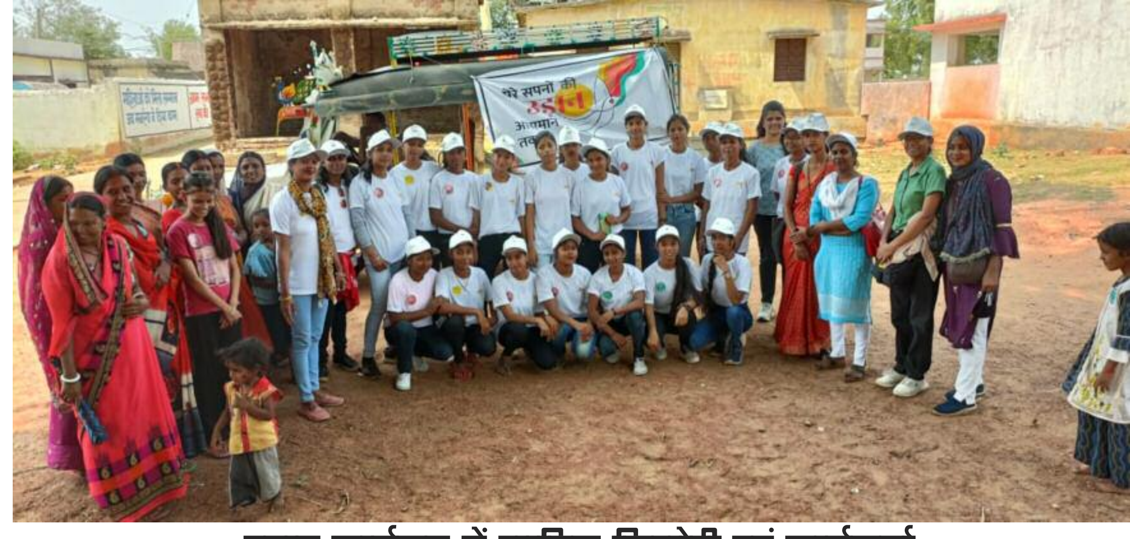
उड़ान कार्यक्रम में शामिल किशोरी एवं कार्यकर्ता