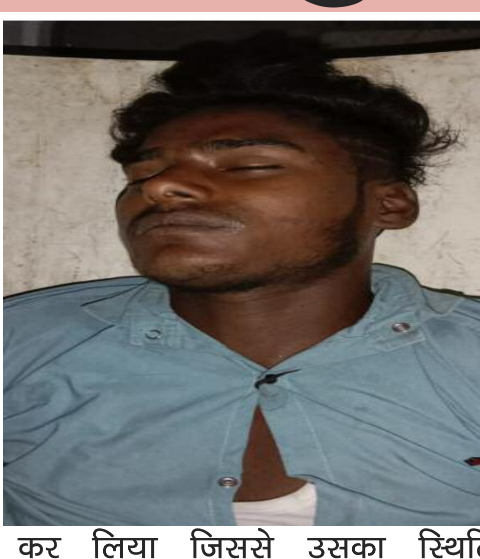
कर लिया जिससे उसका स्थिति