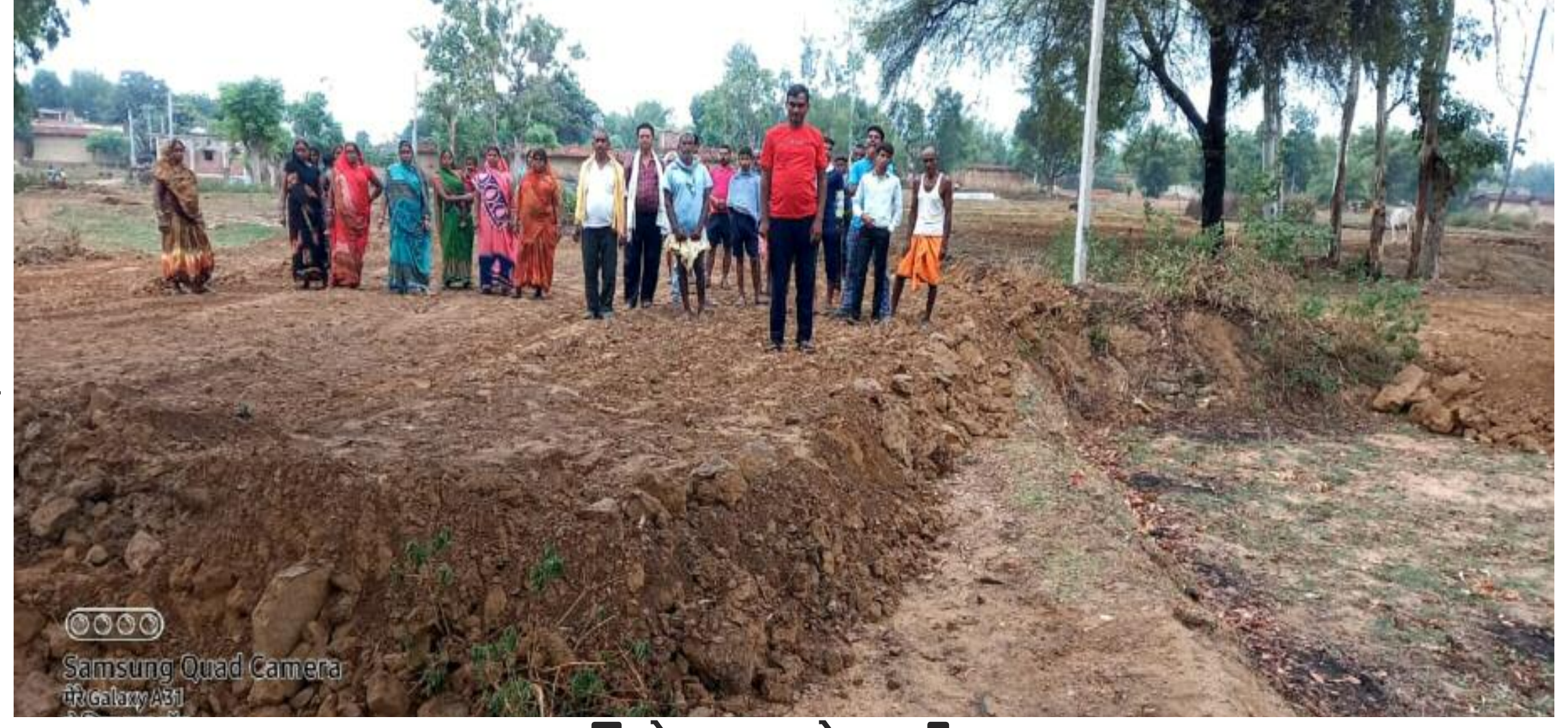
विरोध जताते ग्रामीण

विजैया पंचायत अंतर्गत खूटवाटांड से बैजलाडीह तक में सार्वजनिक मुख्य सड़क को कुछ लोगों ने जेसीबी मशीन लगाकर समतल कर दिया है। सड़क को घरबारी बना दिया है। जिसके कारण सड़क की अस्तित्व हो खत्म होता दिख रहा है। ज्ञात हो कि 2000 में विधायक विकास कोष से 20 फीट चौड़ा एवं 2100 फीट लंबा सड़क बनाया गया था। लेकिन कुछ लोग सड़क को ही अतिक्रमण कर सड़क की चौड़ाई को संकरा कर दिया है। सड़क जर्जर हो गया है। इस वजह से पुनः वर्तमान में आर ई ओ विभाग से सड़क बनाने की प्रक्रिया चल रही है। इधर इस तरह