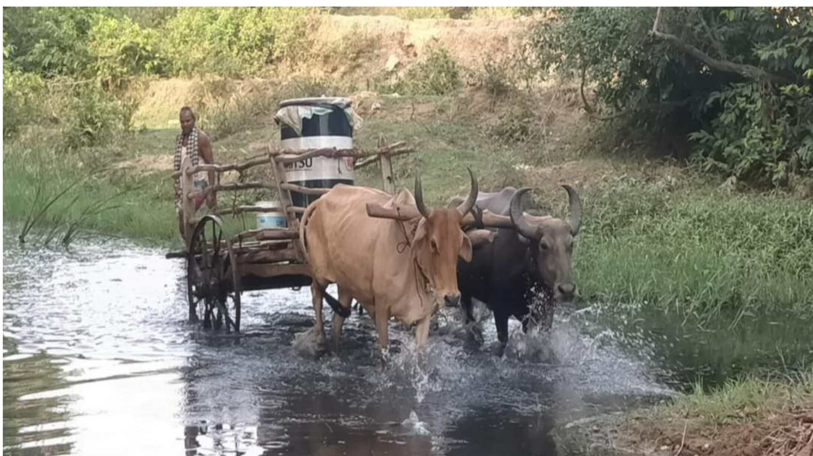
बैलगाड़ी में ड्राम में पानी ले जाते लोग

बरही प्रखंड अंतर्गत पंचमाधव पंचायत के कारीमाटी गांव के लोग गंभीर पेयजल संकट से जूझ रहे हैं। पेयजल संकट की समस्या कोई नई नहीं बल्कि तिलैया डैम निर्माण वर्ष 1952 से चल रहा है। पेयजल संकट होने का मुख्य कारण यह गांव पथरीली भूमि पर अवस्थित होना है। जमीन के अंदर लगभग 500 फीट गहरा तक पानी का लेयर नहीं है। अंदर केवल और केवल पत्थर है। इस कारण यहां चापानल हेतु किया गया बोरिंग एवम डीप बोरिंग सफल नहीं हो पाता है। कारीमाटी के लोग खुद भी दर्जनों बोरिंग कराए हैं लेकिन उससे पानी नहीं निकल पाता है। ग्रामीण वर्षों से पानी आपूर्ति के लिए आंदोलन करते रहे हैं। लेकिन स्थायी समाधान नहीं निकल पाया है। गर्मी में कभी कभी कोबरा 203 के द्वारा टैंकर से पानी उपलब्ध कराया जाता रहा है। वह भी हर वर्ष संभव नहीं हो पाता है। कई सालों तक झामुमो नेता बिनोद विश्वकर्मा के द्वारा भी टैंकर से पानी उपलब्ध कराने का प्रयास