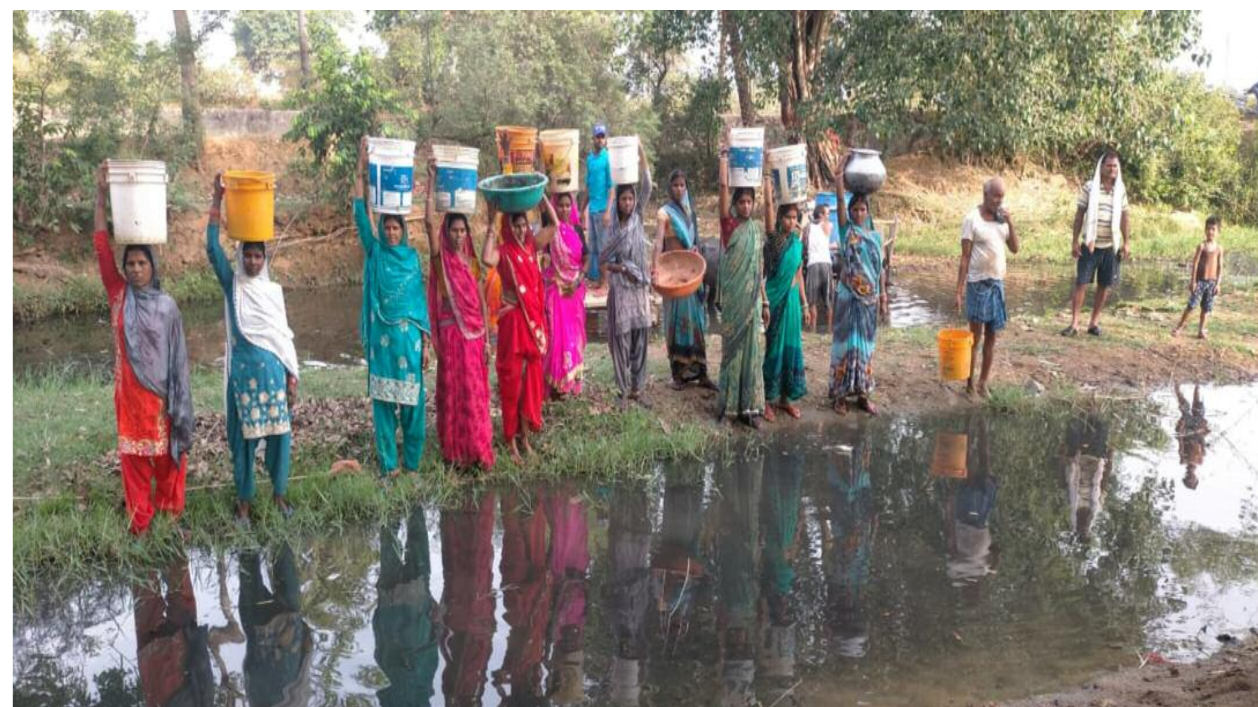
नाले से पानी ले जाती महिलाएं

किया गया। स्थायी समाधान नहीं हो पाया। नाला का पानी का उपयोग करते हैं ग्रामीणरू ग्रामीणों के साथ मवेशियों को भी पानी पिलाने की चुनौती रहती है। इसमें खुद का पानी पीने एवं मवेशियों को पानी पिलाने के लिए गांव से एक किमी दूर स्थित नाला का पानी का