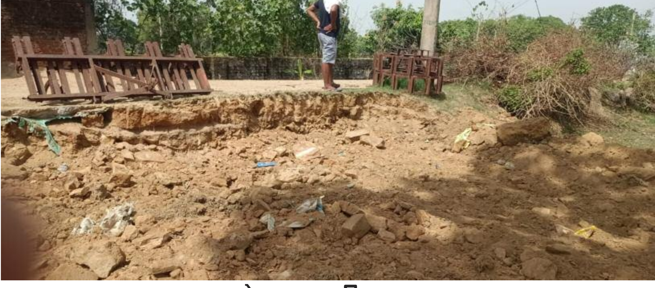
सड़क को काट कर किया गया गढ़ा

गौरियाकर्मा पंचायत के पीडब्लूडी रोड से बिचकिला तक बनी पक्की सड़क को कुछ असामाजिक तत्वों ने बीते रात सड़क का किनारा काटकर गढ़ा कर दिया है। जिसके कारण आवागमन में परेशानी हो रही है। साथ ही सड़क के किनारे गढ़ा कर देने से दुर्घटना की संभावना भी बढ़ गई है। गौरतलब हो कि पुराने समय में यह रोड जिला परिषद के माध्यम से ग्रेड बनाया गया था। उसके कुछ साल बाद इस रोड का निर्माण प्रधानमंत्री ग्राम सड़क