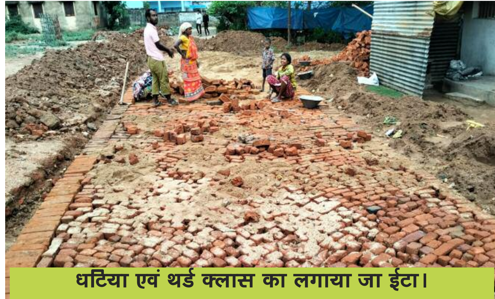
घटिया एवं थर्ड क्लास का लगाया जा ईटा।