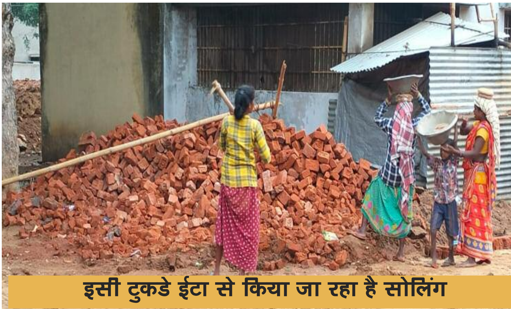
इसी टुकड़े ईटा से किया जा रहा है सोलिंग