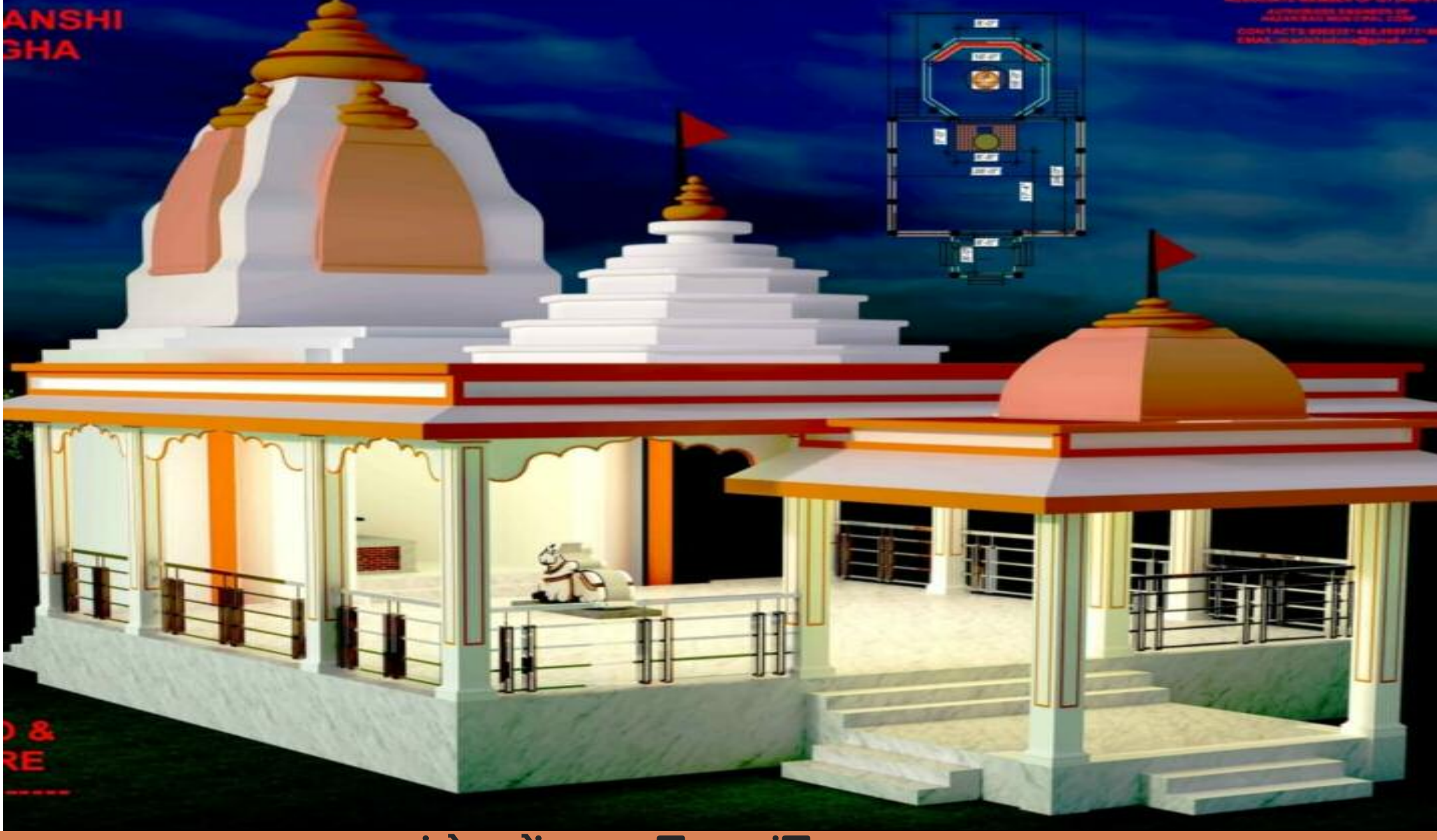
इंसेट में भव्य शिव मंदिर का प्रारूप