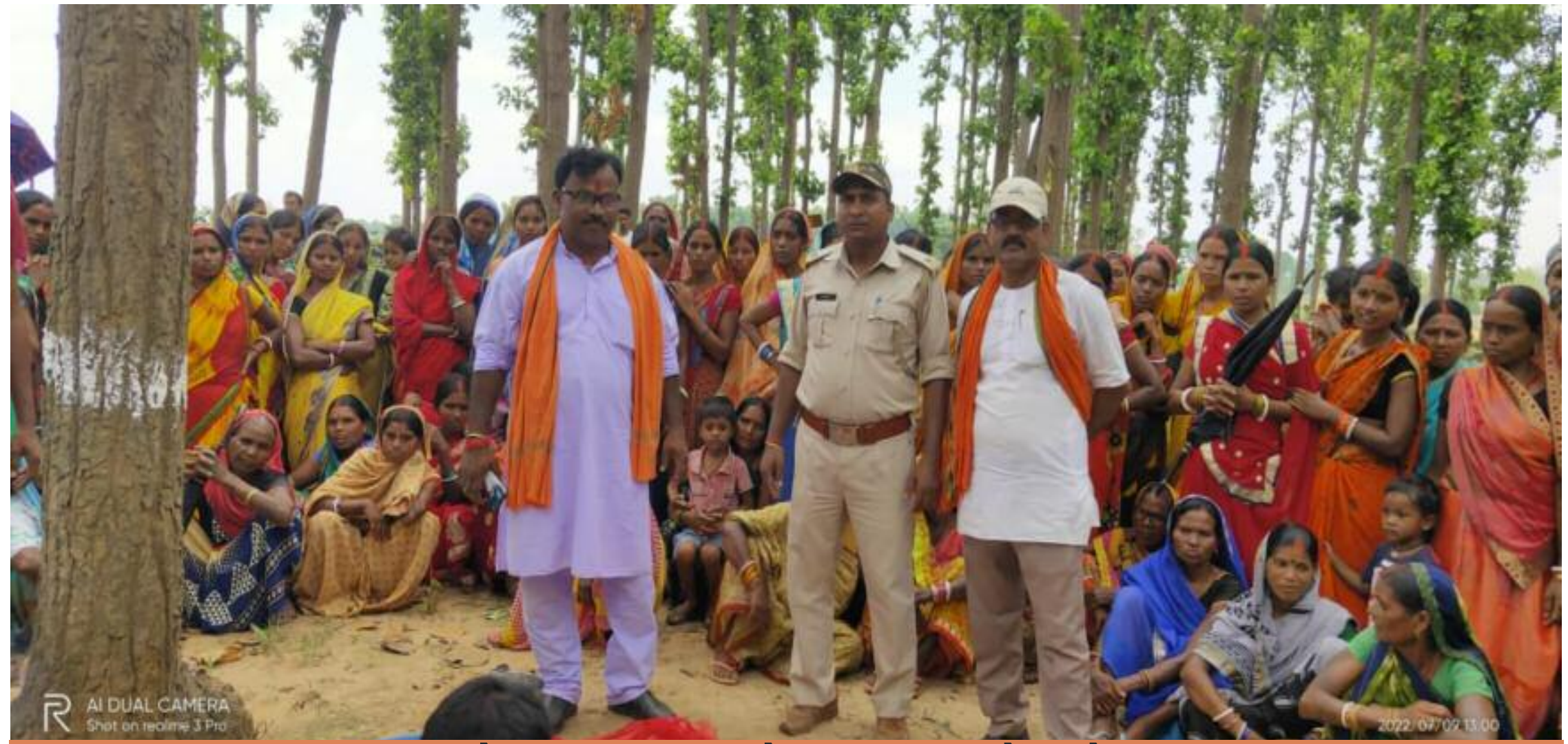
विष्णुगढ़ के डंडिया वन के रक्षाबंधन में जुटे ग्रामीण।

वन तथा वन्य जीवों की रक्षा, संवर्धन तथा विस्तार के उद्देश्य को लेकर शनिवार को प्रखंड के बकसपुरा स्थित डंडिया जंगल का रक्षाबंधन किया गया। इसके पूर्व स्कूली बच्चों द्वारा प्रभातफेरी निक. ली गई। जिसमें पर्यावरण जागरूकता संबंधी विविध नारों के माध्यम से लोगों को जागरूक किया गया। डंडिया वन पहुंचकर वनदेवी की विधि-विधान से पूजा आराधना की गई। जिसमें बड़ी संख्या में ग्रामीण महिलाएं, बच्चे एवं युवा शामिल हुए। सबों से सामूहिक रूप से वन की रक्षा करते हुए पेड़-पौधे नहीं काटने, नए पौधे लगाने तथा इसके संवर्धन का संकल्प लिया। इसके बाद लोगों के बीच प्रसाद वितरण हुआ। डंडिया जंगल