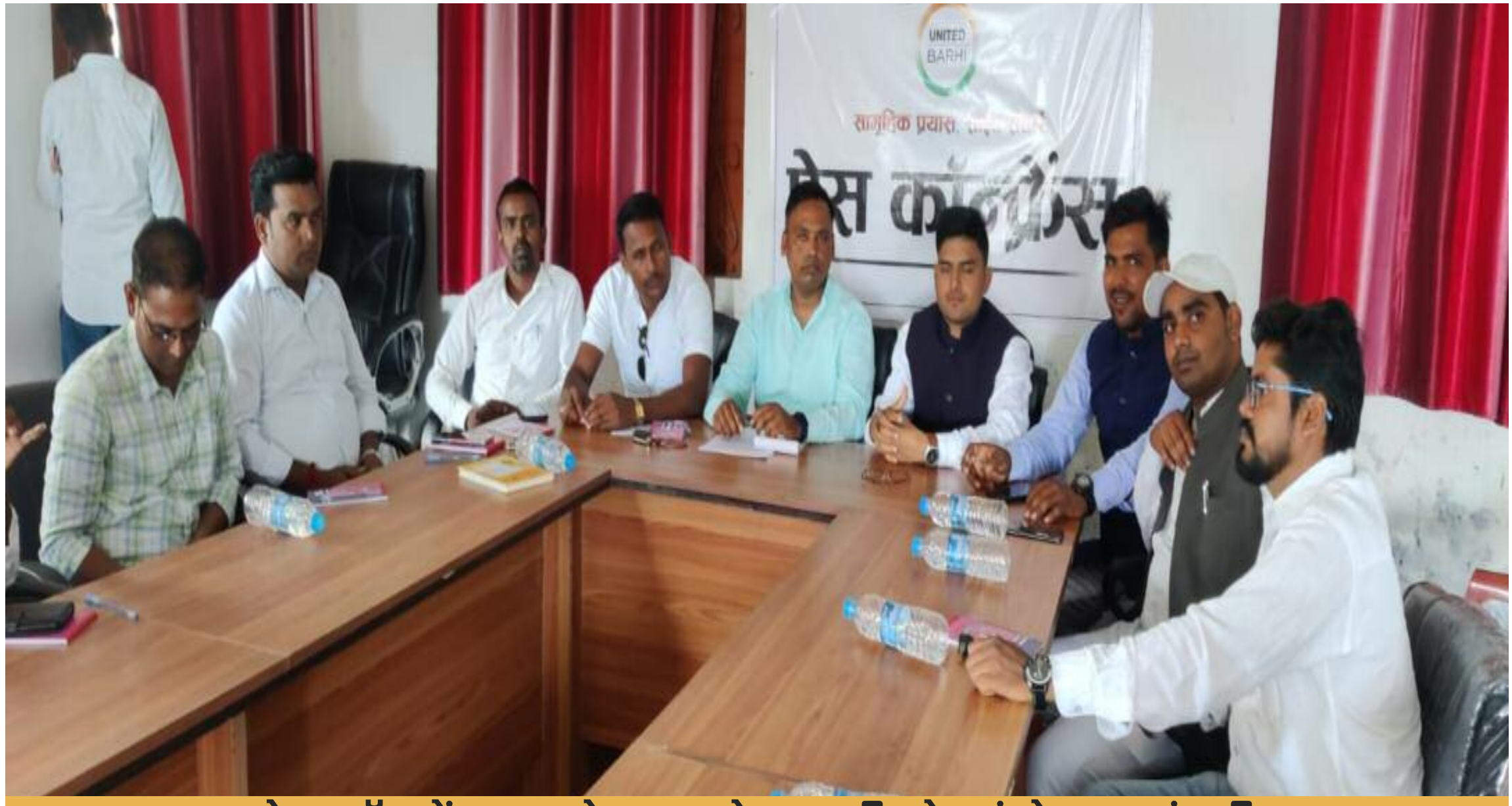
प्रेस कॉन्फ्रेंस करते यूनाइटेड बरही के संयोजक मंडली

बरही विधानसभा में यूनाइटेड बरही नामक एक संगठन का निर्माण किया गया है। यूनाइटेड बरही जनमुद्दों की आवाज को बुलंद करने वाला एक सामूहिक संगठन है। यह संगठन विभिन्न राजनीतिक दलों, सामाजिक संगठनों, सामाजिक कार्यकर्ताओं, बुद्धिजीवियों का एक साझा मंच है। इस संगठन का निर्माण बरही के चिंतनशील युवाओं के द्वारा किया गया है। संगठन निर्माण से पहले लगभग 5 दौर की बैठकें की गईं। बैठकों में सबकी राय ली गयी जिसमें सर्वसम्मति से यह पारित हुआ की एक साझा मंच बनना चाहिए। इसके बाद यूनाइटेड बरही संगठन के नाम पर सहमति बनी। संगठन बरही विधानसभा के भीतर हक और अधिकार की आवाज को एक नए फलक पर स्थापित करेगा। बरही की बेहतरी के लिए जो भी जनमुद्दे होंगे संगठन उन सभी पहलुओं पर एक्शन लेगा।