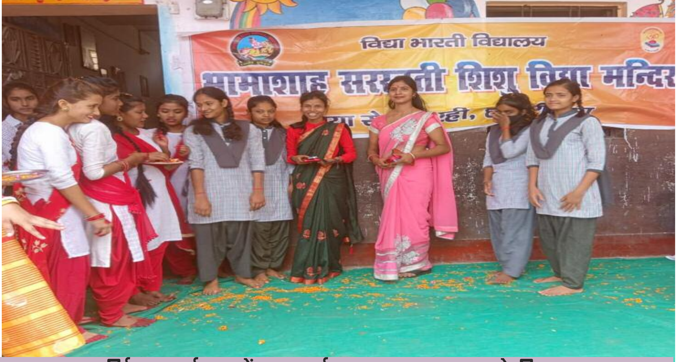
गुरु पूर्णिमा कार्यक्रम में आचार्यगण का स्वागत करते विद्याथरगण