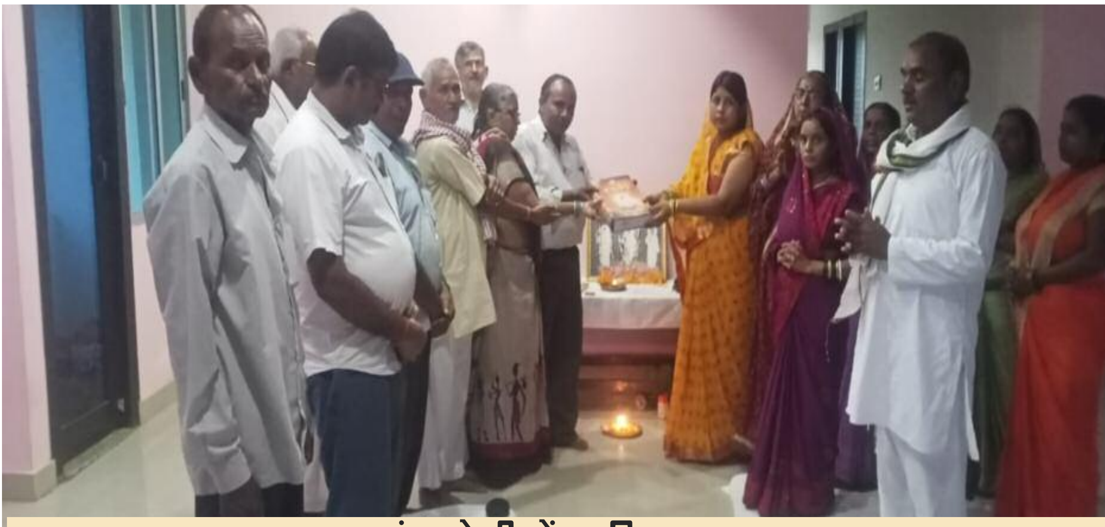
सत्संग गोष्ठी में शामिल भक्तजन