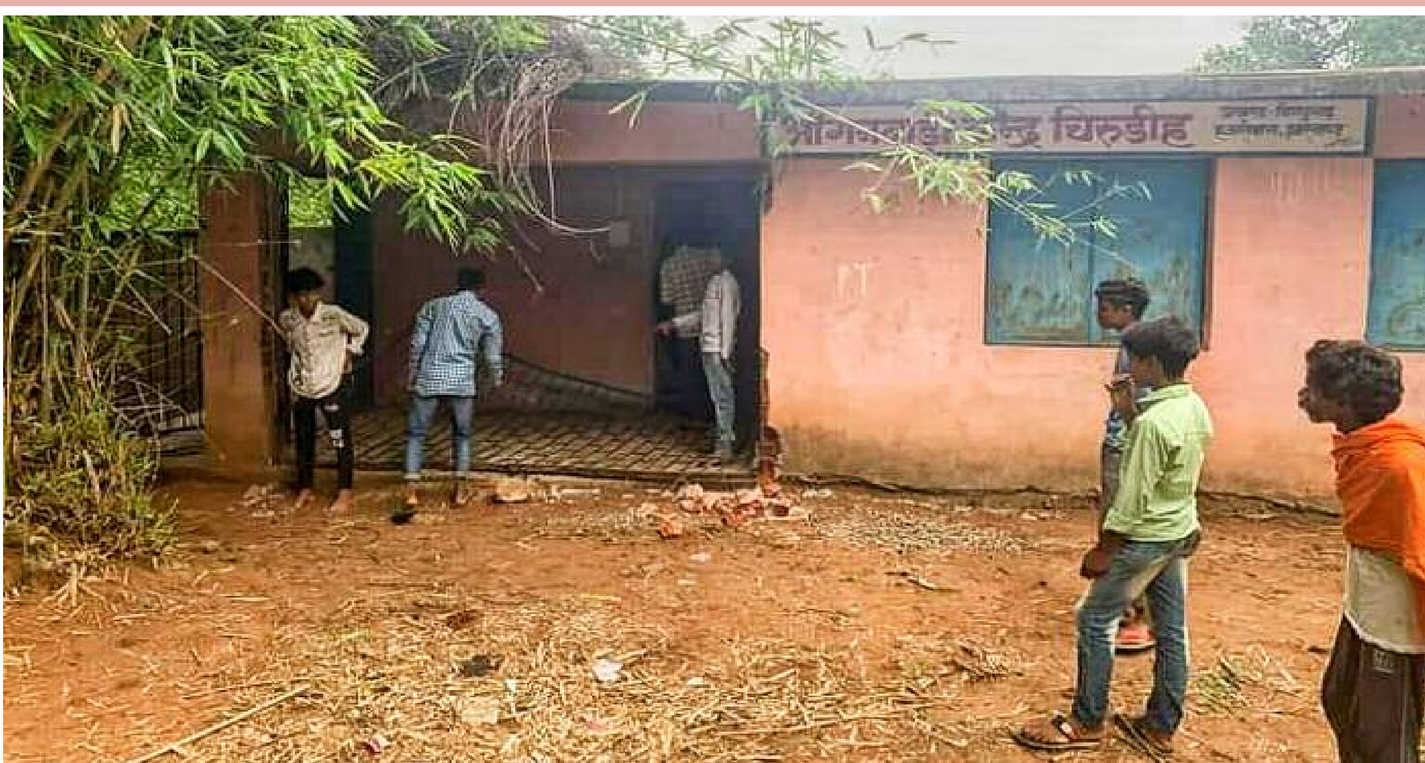
चिरुडीह आंगनबाड़ी केन्द्र में हाथियों द्वारा किए गए नुकसान को देखते ग्रामीण

जंगली हाथियों का झुंड सोमवार की रात गिरिडीह जिला से विष्णुगढ़ प्रखंड की सीमा पर प्रवेश कर गया। जिसके बाद झुंड ने तबाही मचाना शुरू कर दिया। झुंड में हाथियों की संख्या लगभग 25 बताई जाती है। रात में हाथियों ने मड़मो पंचायत के चिरुडीह में संचालित आंगनबाड़ी केन्द्र को निशाना बनाया। केन्द्र का दरवाजा तथा खिड़की को तोड़कर उसमें रखा लगभग 50 किलो चावल तथा दस किलो दाल चट कर गए। इसके अलावा परिसर में लगे चापाकल को क्षतिग्रस्त कर दिया। बताया जाता है गिरिडीह वन विभाग की टीम ने झुंड को खदेड़कर हजारीबाग जिला में प्रवेश करा दिया। इसके बाद हाथी विष्णुगढ़ क्षेत्र में तबाही