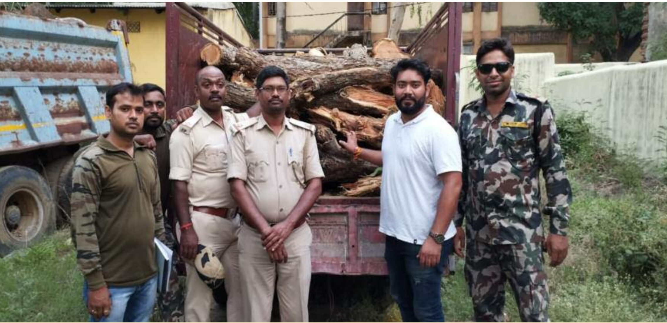
जब्त पिकअप के साथ वन विभाग की टीम

बरही वन विभाग की पुलिस ने मंगलवार को बड़ी कार्रवाई करते हुए। बेलादोहर से लकड़ी से लदा पिकअप जब्त किया है। जब्त पिकअप में कीमती लकड़ी भरी हुई है। प्राप्त जानकारी के अनुसार पिकअप संख्या जेएच 10 एएम 6311 मालवाहक पिकअप में खैरा लकड़ी को लोडकर बरही के रास्ते कोडरमा भेजने की तैयारी थी। इस बात की सूचना मिलते ही बरही वन विभाग की टीम ने बड़ी कार्रवाई करते हुए लकड़ी से लदा पिकअप को जब्त कर लिया। हालांकि चालक