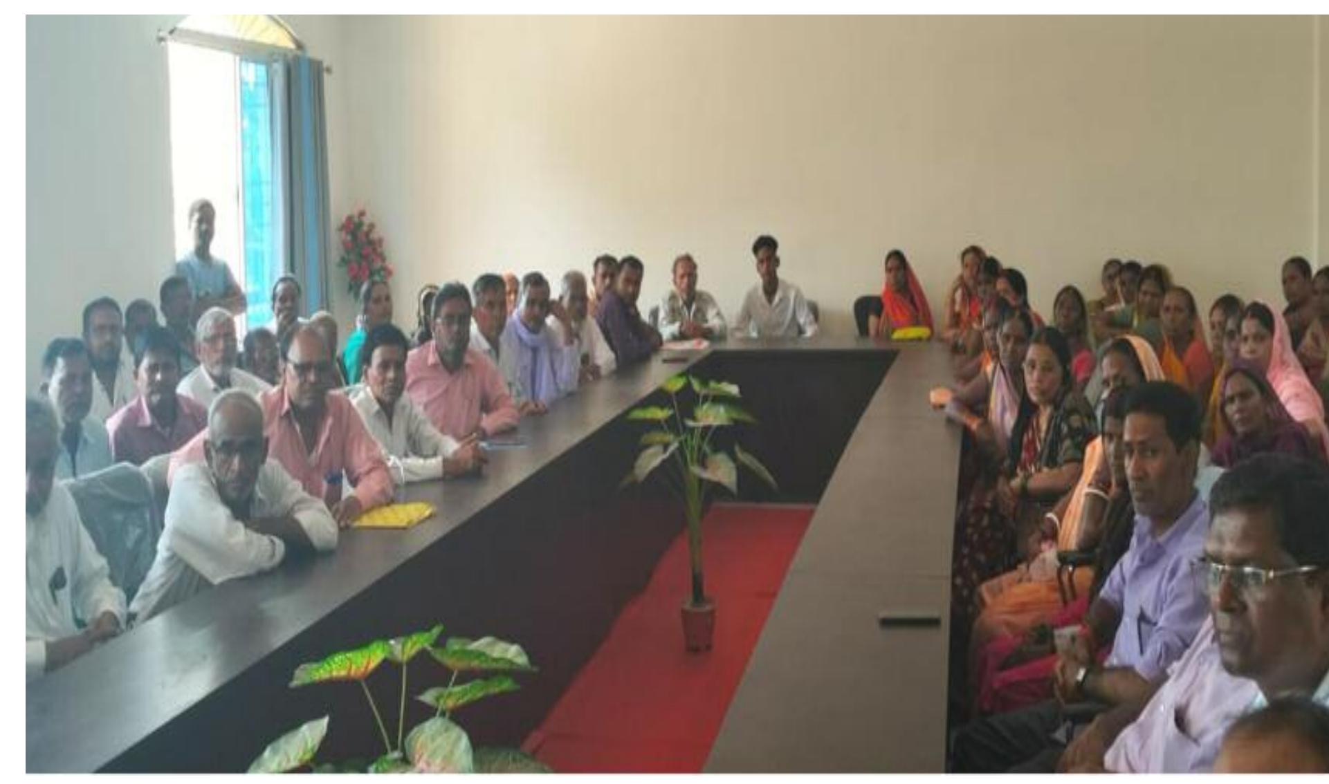
बैठक में शामिल डीलर

सभी को राशन कार्ड का लाभ दिया जा सके। यदि सरेंडर नहीं करते है तो प्रशासन सभी लोगो पर कार्रवाई करेगी और कार्ड रद्द कर खदान का दाम भी वसूला जाएगा। और समय से राशन कार्ड धारियों को उनका राशन मिलना चाहिए। मौके पर बरही एसडीओ