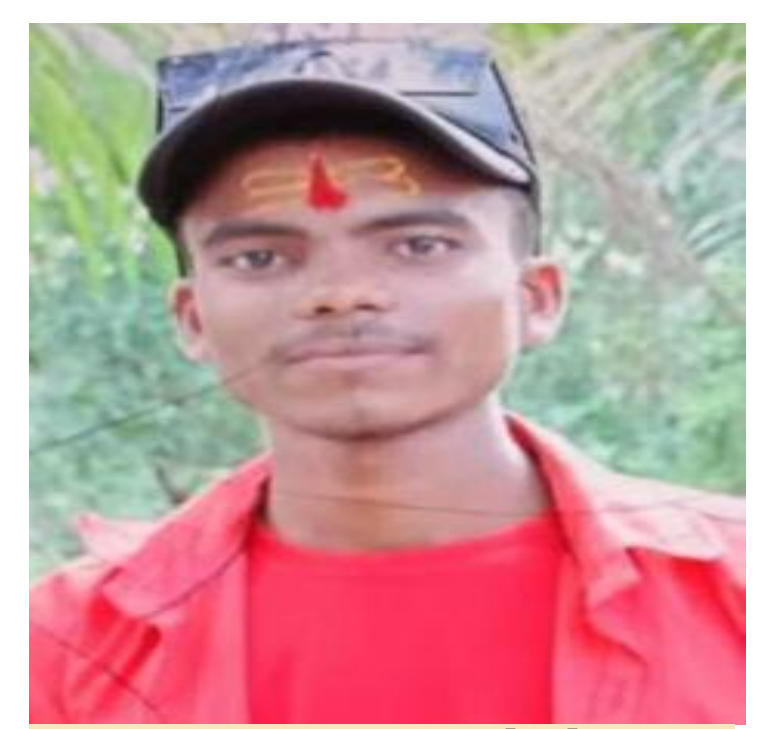
मृतक का फोटो