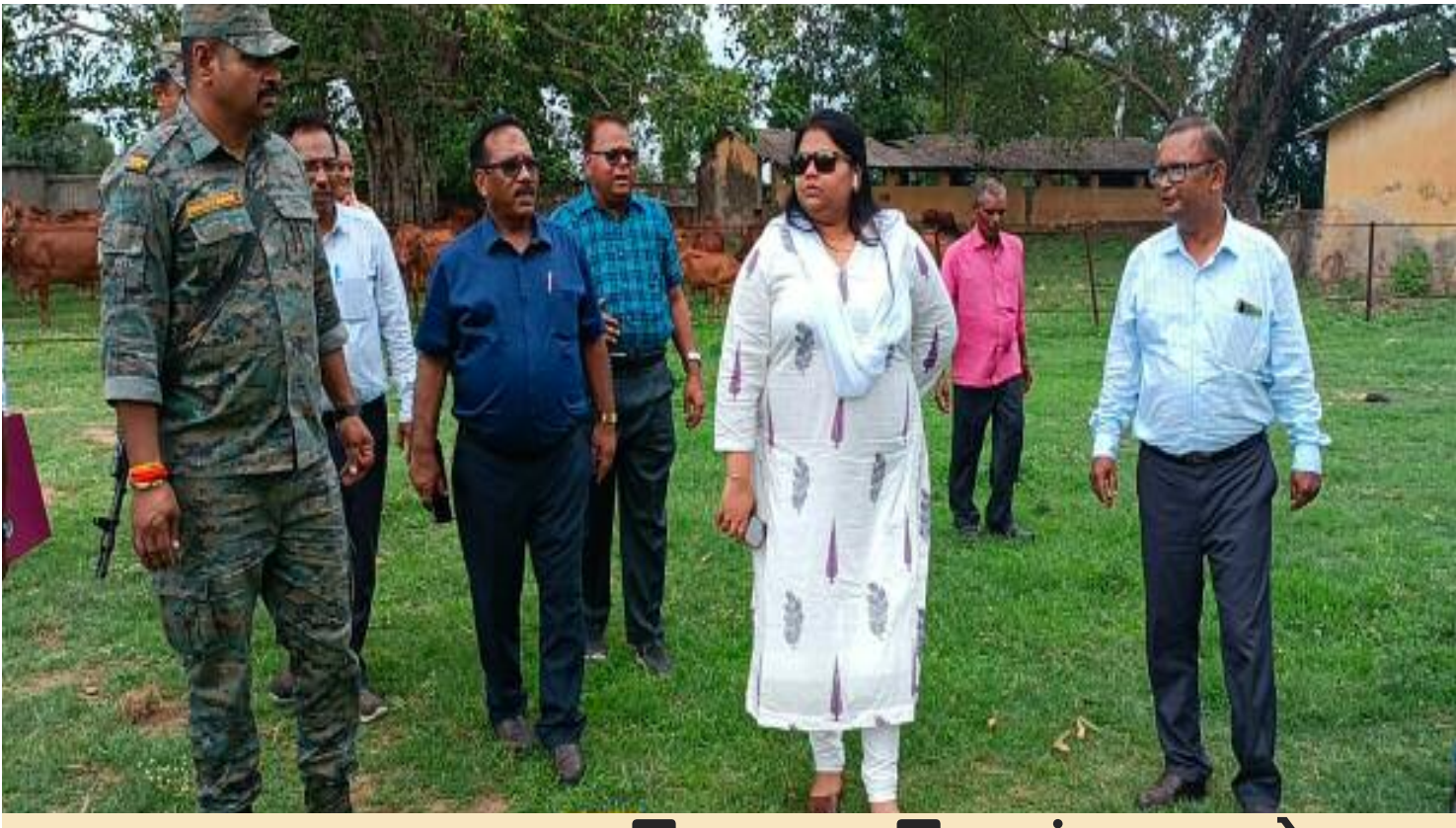
बिरसा कृषि एवं पशु प्रक्षेत्र का निरीक्षण करती डीसी एवं एसी

चिन्हित अतिक्रमणकारी के खिलाफ एफआईआर एव अतिक्रमण हटाने को लेकर सीओ को कड़ा निर्देश