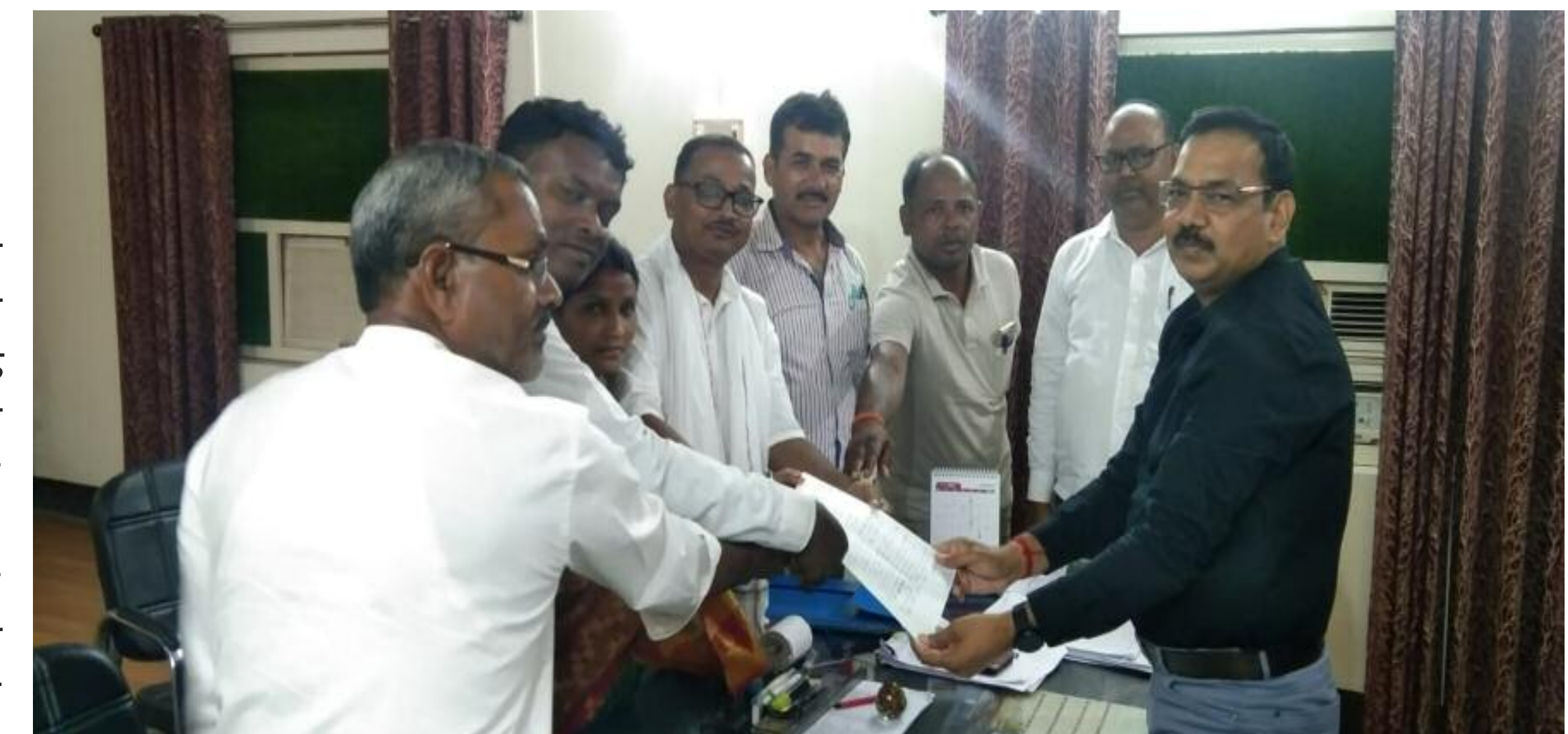
अधिकारियों को ज्ञापन सौंपते मुखिया संघ का प्रतिनिधिमंडल

प्रखंड में बिजली, पानी, पेंशन, राशन समेत अन्य बुनियादी सुविधाओं की समस्या को लेकर विष्णुगढ़ मुखिया संघ का प्रतिनिधिमंडल जिला में संबंधित विभागों के अधिकारियों से मिले। इनमें विद्युत विभाग के अधीक्षण अभियंता, पेयजल एवं स्वच्छता विभाग के कार्यपालक अभियंता, जिला कल्याण पदाधिकारी, सामाजिक सुरक्षा पेंशन पदाधिकारी, जिला खाद्य आपूर्ति पदाधिकारी समेत अन्य अधिकारियों से मिलकर व्याप्त समस्याओं को रखा। प्रखंड में बिजली की निर्बाध आपूर्ति को लेकर कहा कि सभी फीडर