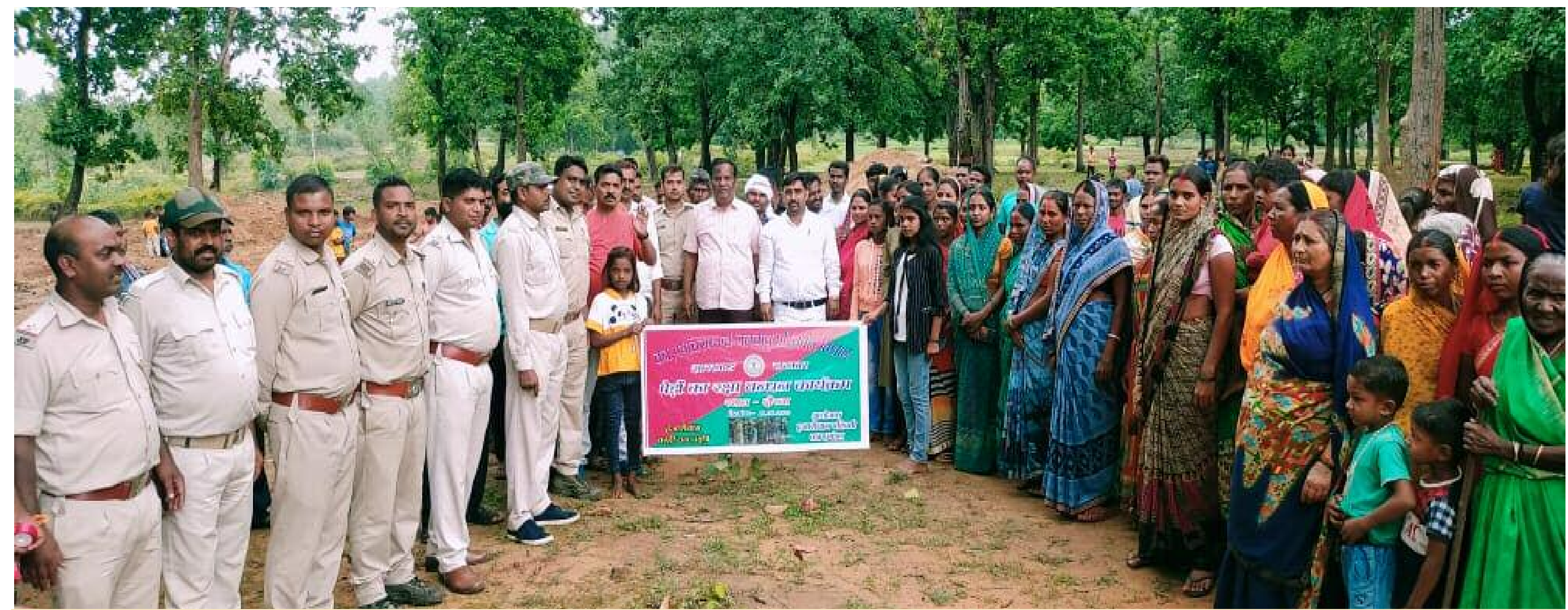
वन रक्षा बन्धन उत्सव में शामिल वन अधिकारी एवं ग्रामीण