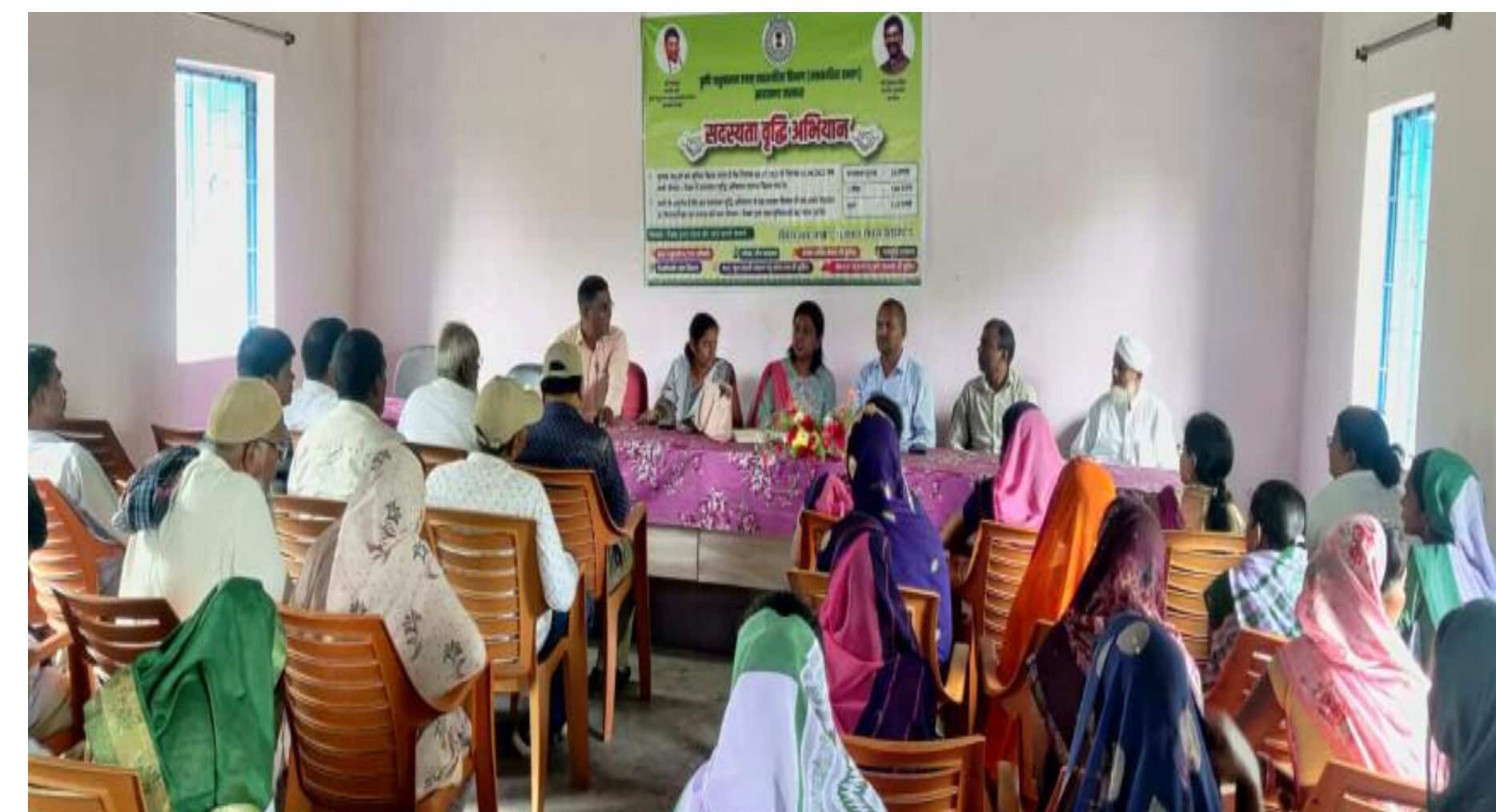
बैठक में शामिल लोग