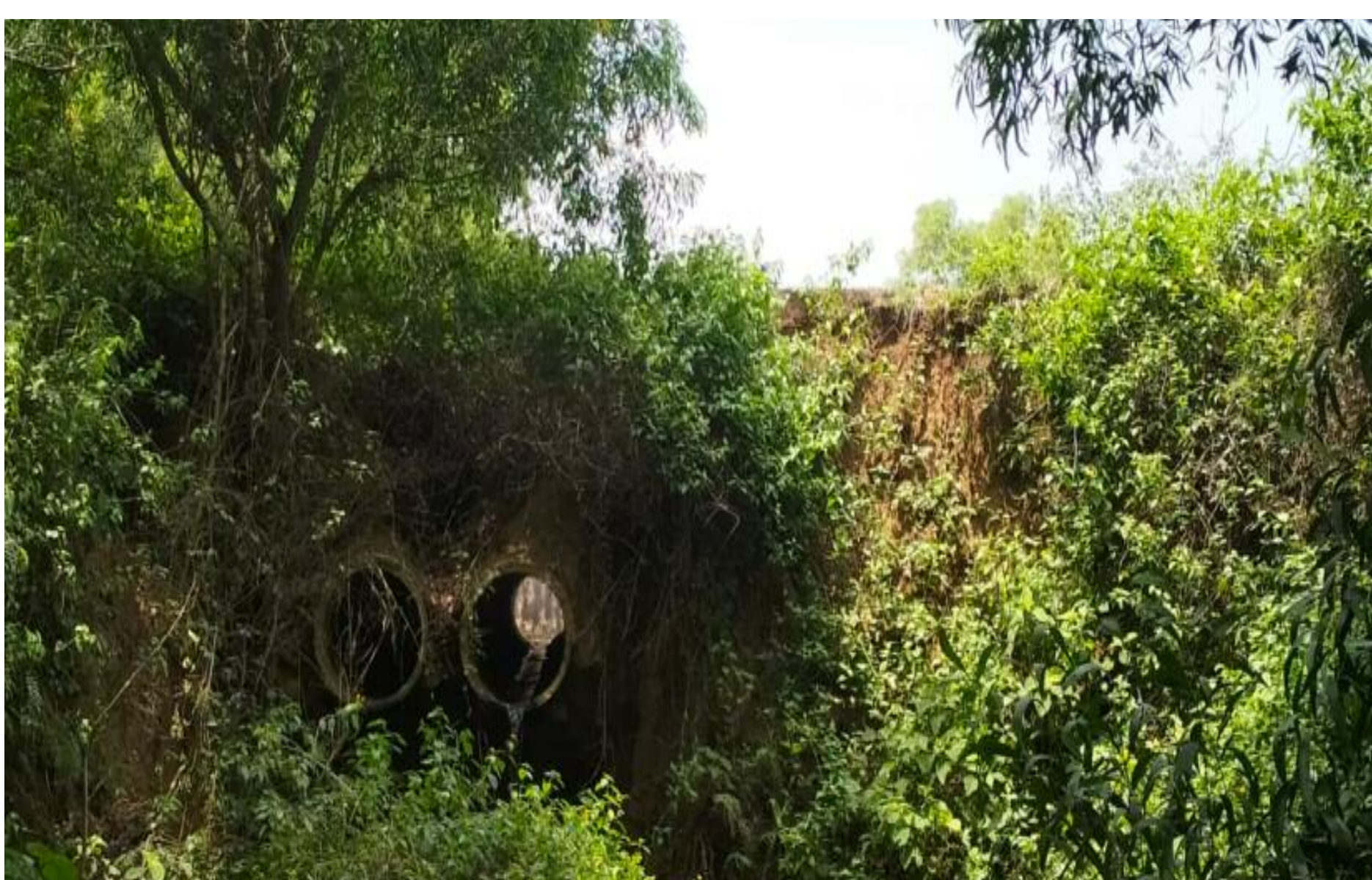
टूटा हुआ पुलिया

हुआ था। और इस तालाब लाभान्वित होने वाले गांवों में से पांच गांव जैसे विजैया, बैजलाडीह, अलगडीहा, जवाड़ एवं भंडारों शामिल है। उन्होंने कहा की इससे पूर्व अधिकारियों ने इस तालाब का जीर्णोधार के बारे में सोचा। जिसके कारण तालाब धीरे धीरे मिट्टी से भर गया है। इस तालाब के सूखने से आस पास के सैकड़ों एकड़ जमीन पर खेती नहीं हो पा