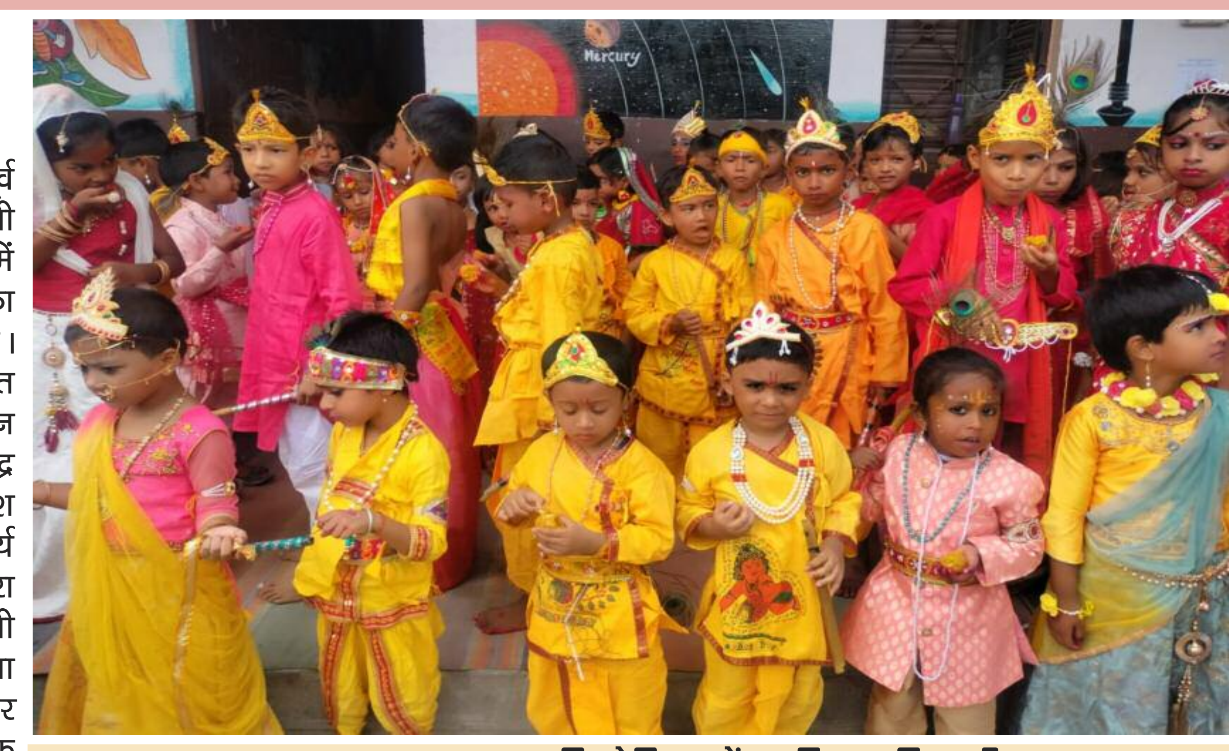
कृष्ण राधा सज्जा प्रतियोगिता में शामिल प्रतिभागी