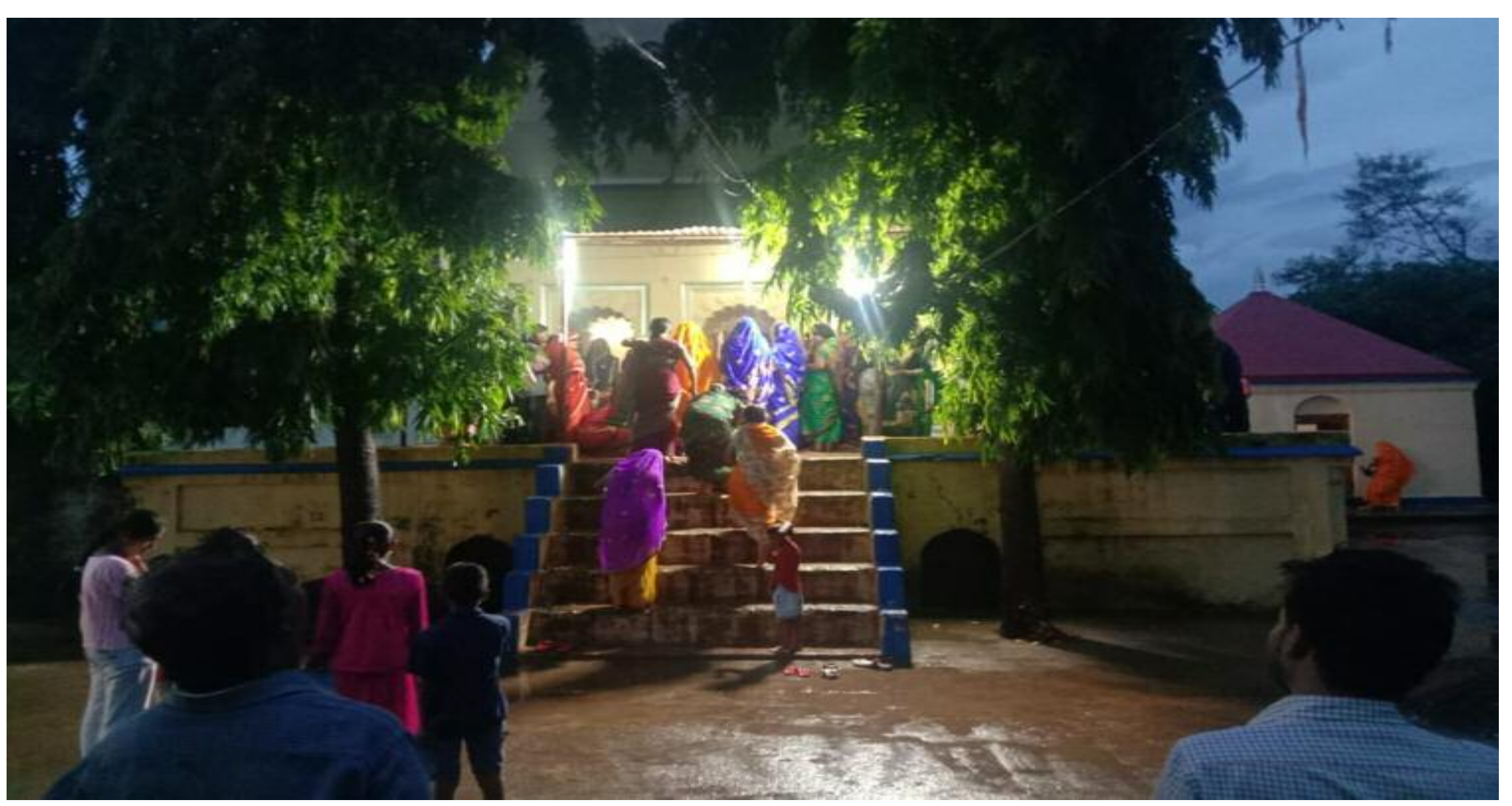
विष्णुगढ़ के बंशीधर मंदिर में पूजा अर्चना के लिए पहुंचे श्रद्धालु

विष्णुगढ़ और इसके आसपास के इलाकों में शुक्रवार को श्रीकृष्ण जन्माष्टमी का त्योहार धूमधाम से मनाया गया। इसके लिए सभी राधा कृष्ण मंदिरों में विशेष रूप से साज-सज्जा की गई थी। शाम होते ही मंदिरों में पूजा अर्चना के लिए श्रद्धालुओं की भीड़ उमड़ने लगी। पूजा व्रत के लिए महिला श्रद्धालु सुबह से ही उपवास पर थी। विष्णुगढ़ के महंत अखाड़ा चौक स्थित बंशीधर मंदिर, बाजारटांड स्थित राम-कृष्ण मंदिर, हेठली बोदरा में राधा-कृष्ण मंदिर, मड़मो का राधा कृष्ण मंदिर