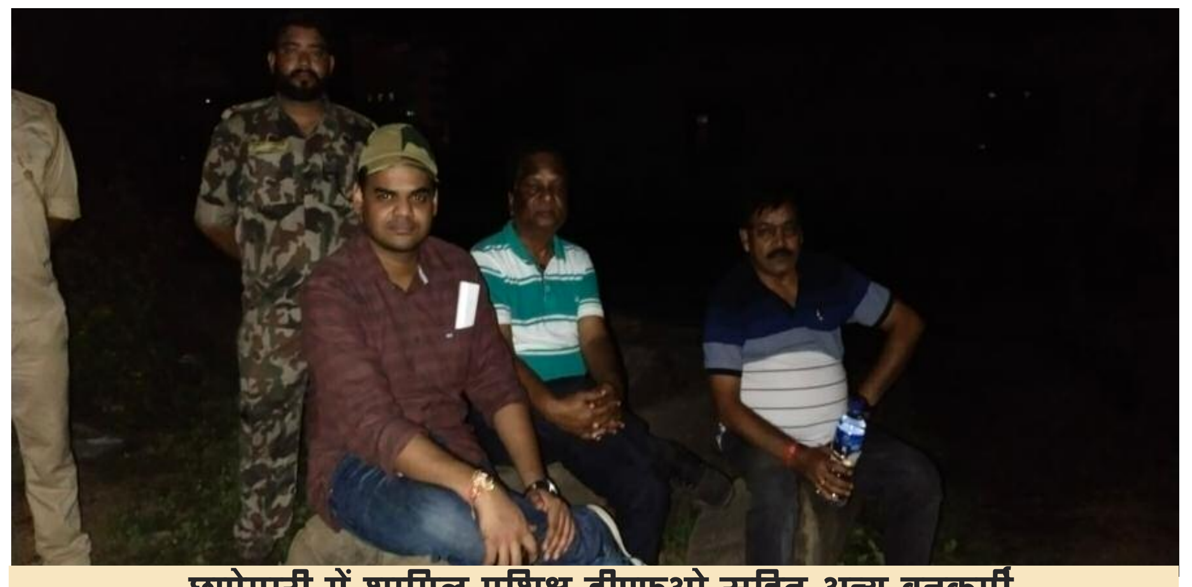
छापेमारी में शामिल प्रशिक्षु डीएफओ सहित अन्य वनकर्मी