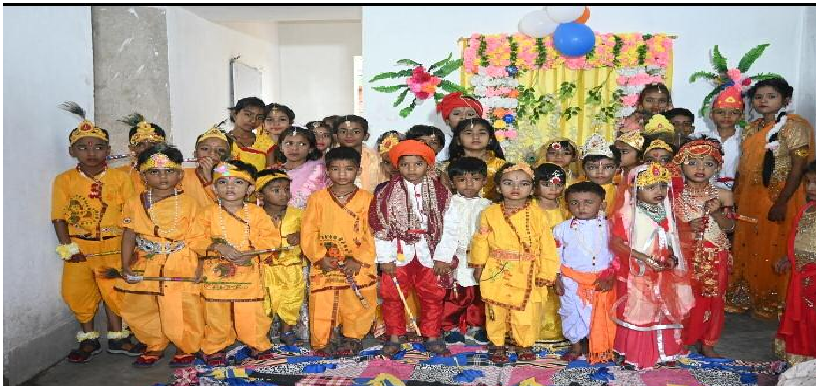
कान्हा राधा रूप सज्जा प्रतियोगिता में शामिल बच्चे