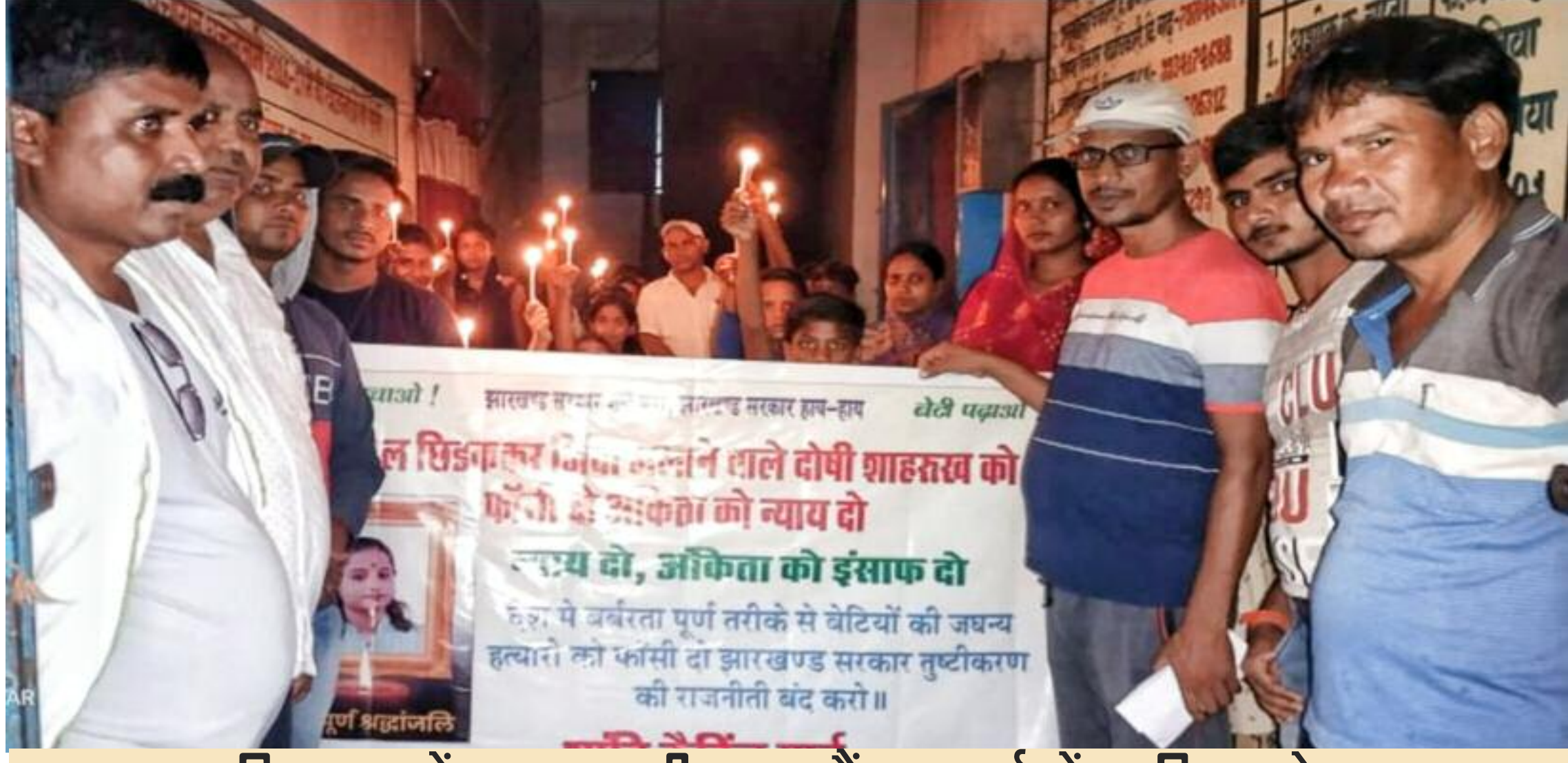
विष्णुगढ़ में शुक्रवार की शाम कैंडल मार्च में शामिल लोग

दुमका जिले की छात्रा हत्याकांड के विरोध में न्याय की मांग को लेकर शुक्रवार की शाम प्रखंड के अचलजामो न्याय संघर्ष समिति के बैनर तले कैंडल मार्च निकाला गया। पूरे गांव का भ्रमण कर मार्च का समापन किया गया। इसके पश्चात दिवंगत छात्रा की आत्मा के शांति के लिए एक मिनट का मौन रखकर भावभीनी श्रद्धांजलि दी गई। मार्च में शामिल लोगों ने इस जघन्य हत्याकांड में शामिल आरोपी को फास्ट ट्रैक कोर्ट के माध्यम से