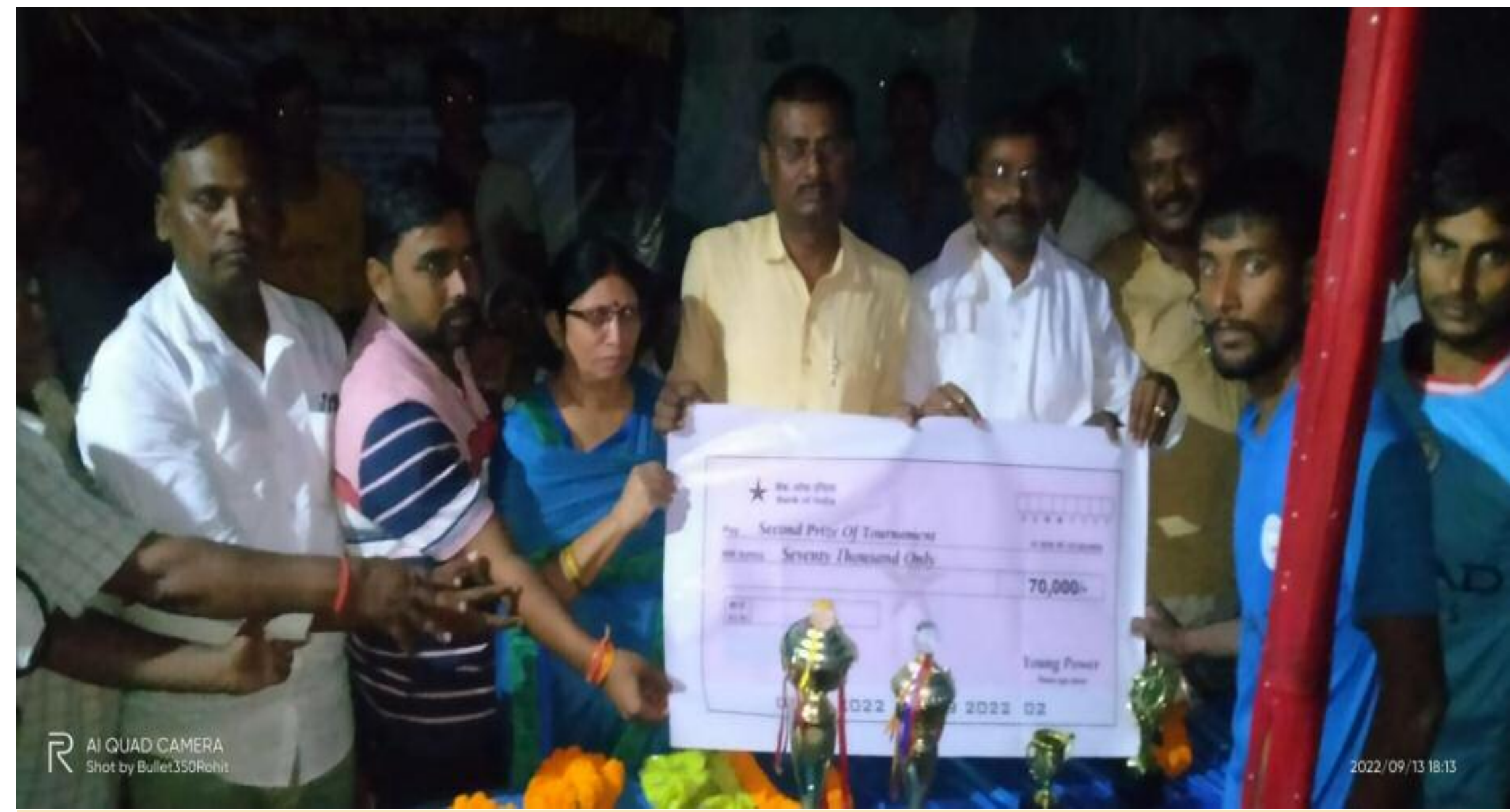
विजेता टीम को पुरस्कृत करते अतिथि