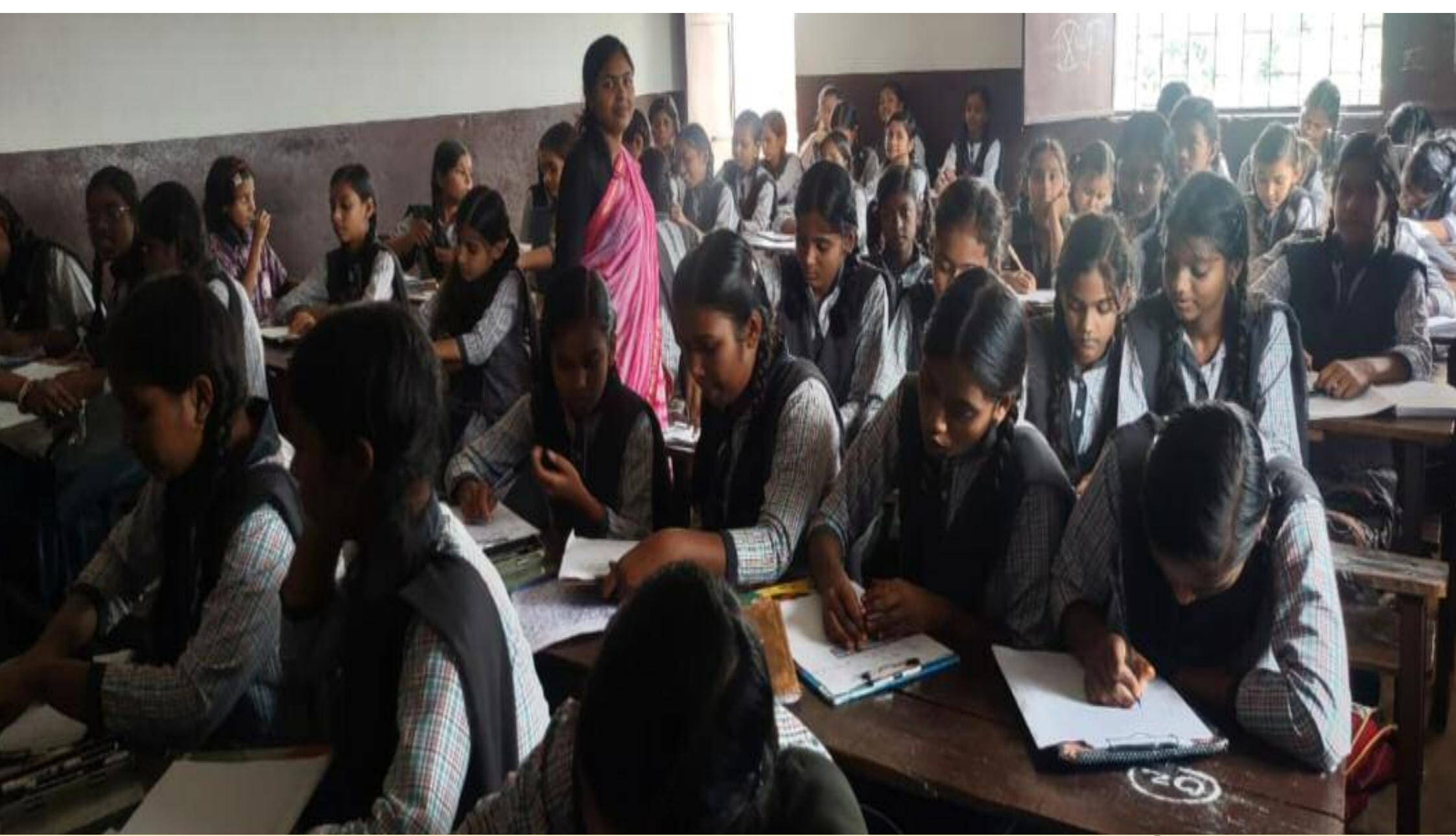
निबन्ध लेखन प्रतियोगिता में भाग लेते विद्यार्थी

हिंदी दिवस के अवसर पर विद्या भारती संस्कृति बोध परियोजना के अंतर्गत अखिल भारतीय निबंध प्रतियोगिता का आयोजन भामाशाह सरस्वती शिशु विद्या मंदिर बरही में किया गया। यह प्रतियोगिता कक्षा चतुर्थ से लेकर दशम तक के भैया-बहनों के बीच आयोजित की गई। जिसे शिशु वर्ग, बाल वर्ग और किशोर वर्ग में बांटकर किया गया। शिशु वर्ग में कुल 55, बाल वर्ग में 61 और किशोर वर्ग में 70 भैया बहनों ने भाग लिया। इस निबंध प्रतियोगिता में शिशु वर्ग के लिए छपे घर