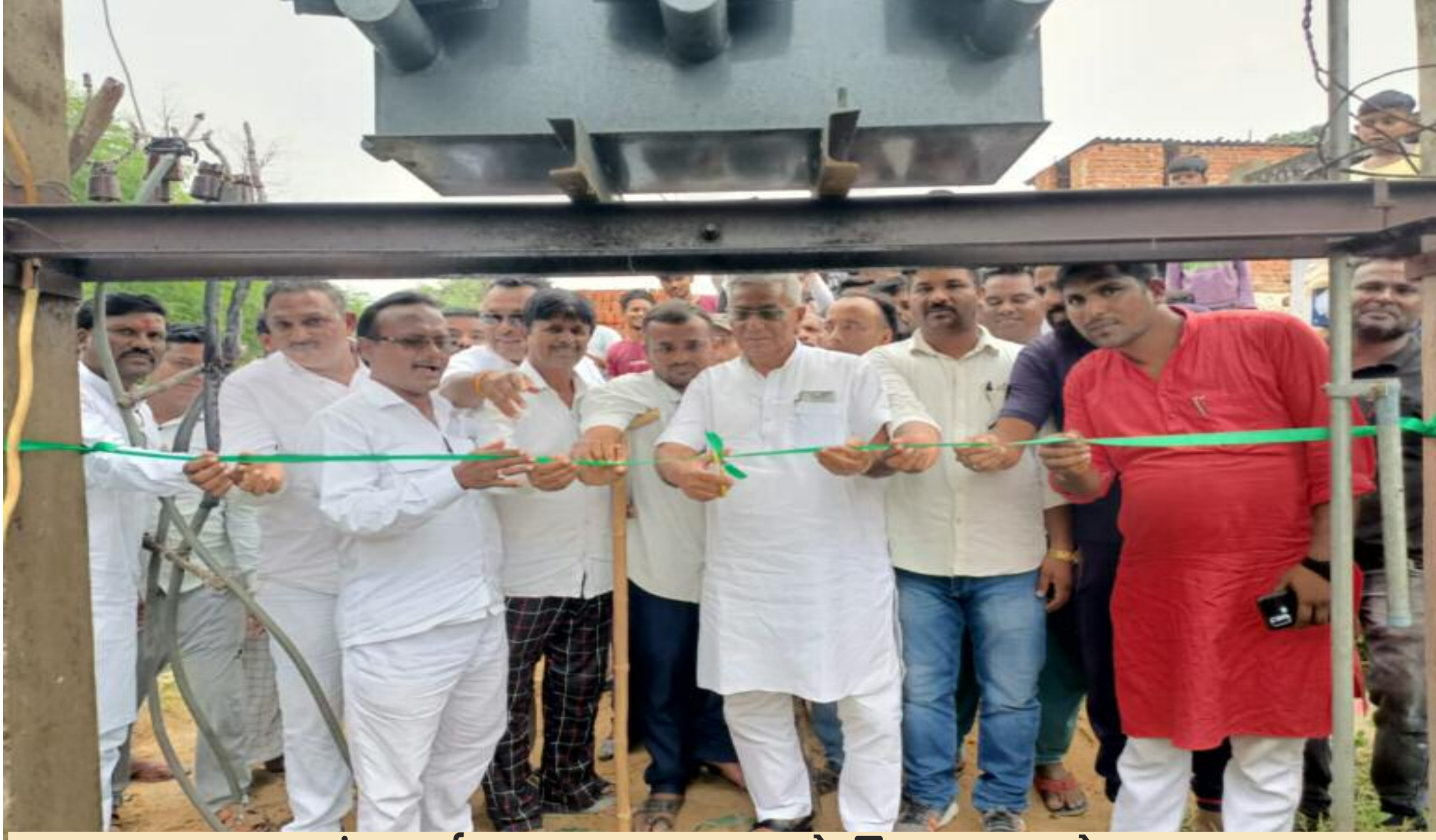
ट्रांसफार्मर का उद्घाटन करते विधायक अकेला

बरही प्रखण्ड के धनवार पंचायत अंतर्गत बाबू गांव में 200 केवीए ट्रांसफार्मर का विधायक उमाशंकर अकेला ने फीता काटकर उद्घाटन किया। इस दौरान विधायक श्री अकेला ने कहा कि ग्रामीणों की मांग पर और विधायक के प्रयास से तुरंत ट्रांसफार्मर मुहैया हुआ, जिसका विधायक उद्घाटन विधायक ने किया और कहा कि मेरे कार्यकाल में बिजली की किल्लत नहीं होगी। कहा कि क्षेत्र की जनसमस्याओं को लेकर वह हमेशा से मुखर रहे हैं। आम व्यक्ति को किसी प्रकार की समस्या होने पर उनसे संपर्क करें। उनका प्रयास