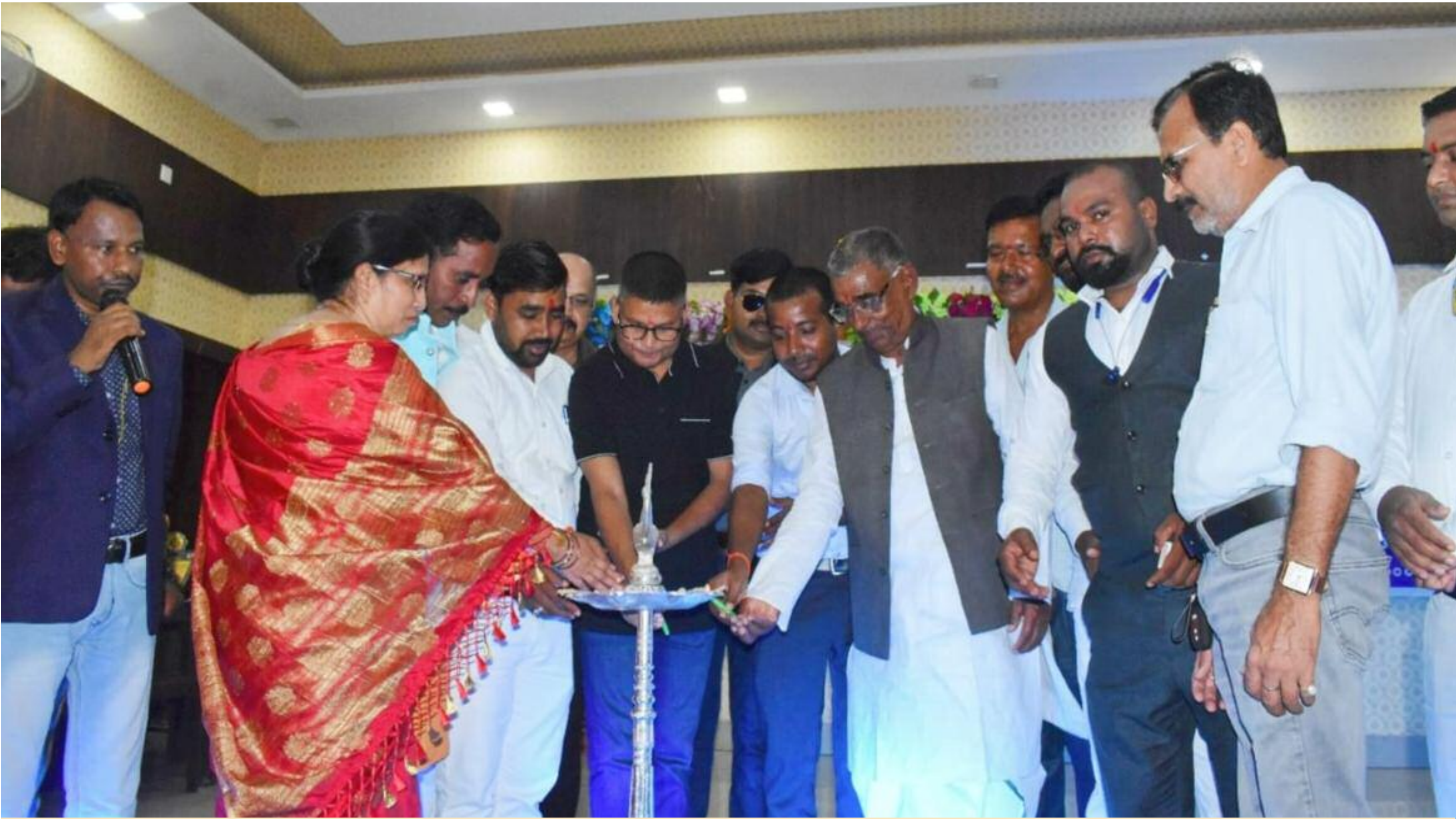
समारोह का उद्घाटन करते अतिथिगण

चाणक्य आईएस एकेडमी की ओर से करियर काउंसलिंग, 17 स्कूलों के बच्चों एवं बच्चियों ने दी नृत्य संगीत की प्रस्तुति