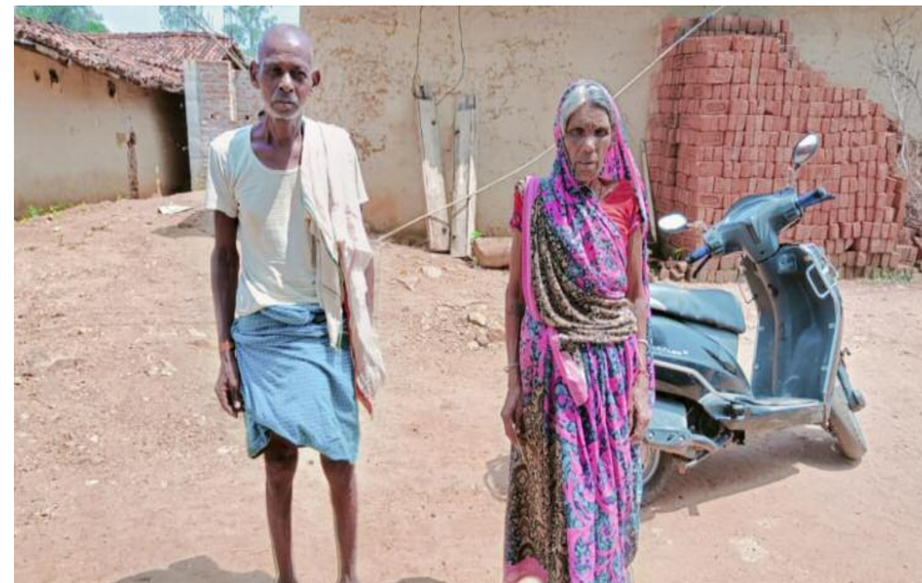
पेंशन योजना से वंचित बुजुर्ग

ठीक नहीं कराया है। पूछने पर बताते हैं कि जब कोई फंड आएगा तो बनवा देंगे। मौके पर मौजूद लोगों ने बताया कि हमें सिर्फ वोट के लिए इस्तेमाल किया जाता है। जब चुनाव का समय आता है तब सभी जनप्रतिनिधि सुख दुख में साथ और हर विकट परिस्थिति में साथ देने का