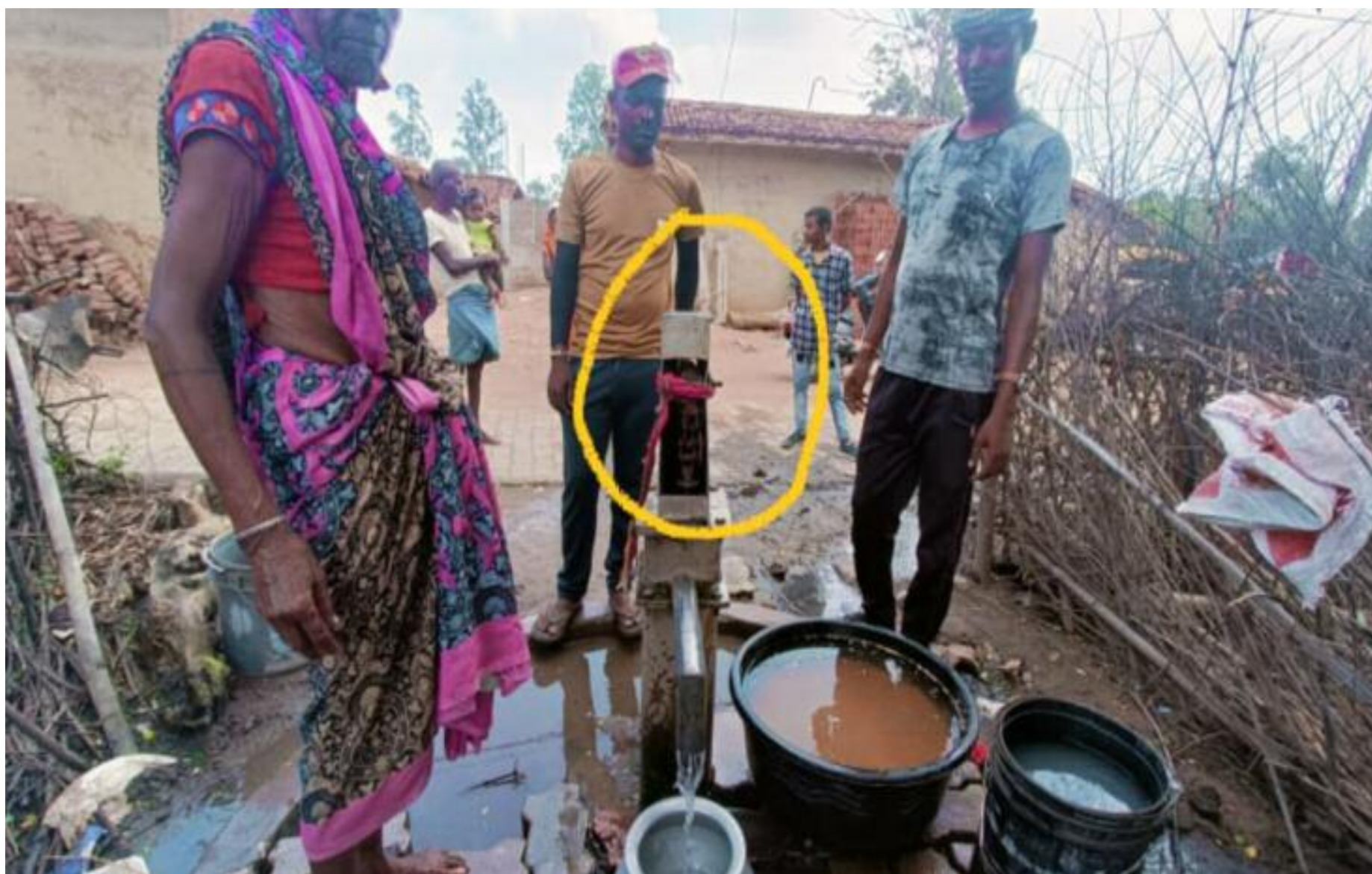
रस्सी बांधकर हैंडपंप से पानी भरते ग्रामीण

बरही प्रखंड अंतर्गत डपोक पंचायत के घटवार टोला आजादी के सात दशक बाद भी विकास के मामले में कोसो दूर है। घटवार टोला में दो चापाकल तो हैं परंतु एक कई महीनों से खराब पड़ा हुआ है वहीं दूसरा चापाकल भी चैन टूट गया जिसे ग्रामीणों द्वारा रस्सी से बांधकर चला रहे हैं। पूछने पर उन्होंने बताया कि कई हैंडपंप का चैन टूट गया है जिसके कारण चैन को रस्सी से बांधकर हैंडपंप चला रहे हैं। वही स्थिति पोल पर लगी लाइट की है। ग्रामीणों ने बताया कि स्ट्रीट लाइट पिछले एक साल से खराब पड़ा हुआ है। लेकिन पंचायत के किन्हीं जनप्रतिनिधियों को इस और ध्यान नहीं है कहा की खराब पड़े हैंडपंप और लाइट को लेकर स्थानीय मुखिया को कई बार सूचना दिया गया है परंतु आज तक उन्होंने