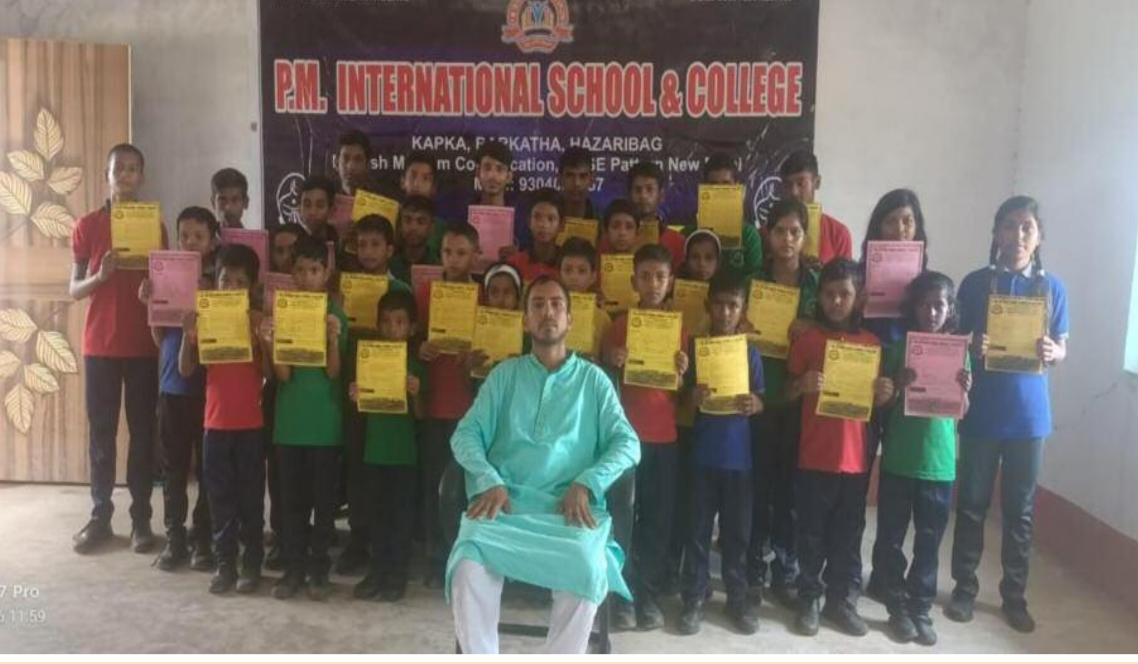
बरकट्टा परीक्षा परिणाम के साथ पीएम स्कूल के छात्र