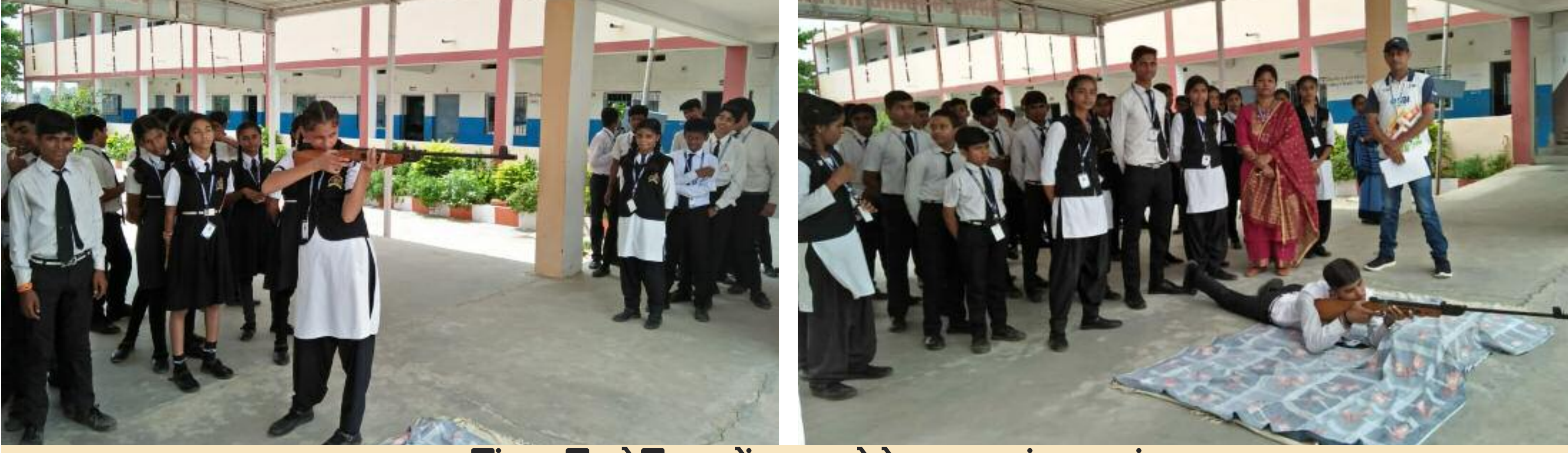
शूटिंग प्रतियोगिता में भाग लेते छात्र एवं छात्राएं

इंटर हाउस प्रतियोगिता आयोजित कर किया गया बेहतर शूटर का चयन