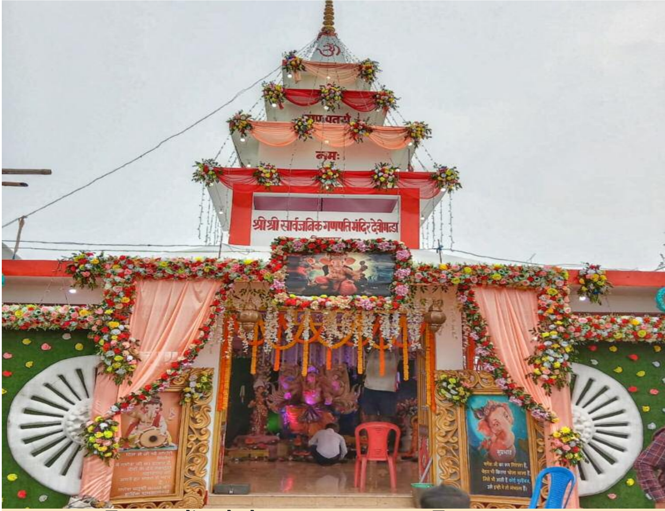
विष्णुगढ़ में गणेशोत्सव पर सजा गणपति बाबा का द्वार

विष्णुगढ़ और इसके आसपास के इलाकों में बुधवार से श्री गणेश महोत्सव की शुरुआत हो गई। महोत्सव लगातार कहीं तीन दिन तो कहीं पांच दिनों तक चलेगा। विष्णुगढ़ के गोविन्दपुर, चलंगा, नवादा, बेड़ा हरियारा समेत अन्य कई गांवों में गणपति महोत्सव मनाया जा रहा है। विष्णुगढ़ के देवी मंडप प्रांगण में पांच दिवसीय गणपति पूजा का विशेष आयोजन किया गया है। मंदिर को पुष्प एवं लाइटिंग के माध्यम से आकर्षक सजा कर भव्य प्रतिमा की स्थापना की गई है। मंदिर में पूजा-अर्चना एवं दर्शन के लिए बड़ी संख्या में श्रद्धालु उमड़ रहे हैं। मंदिर प्रांगण में लगा मेला भी लोगों को खूब आकर्षित कर रहा है। मेले में ब्रेक डांस, झूला, नाव झूला, जंपिंग झूला, मिकी माउस तथा मोनो रेल में युवाओं एवं बच्चों की मस्ती देखते बन रही है। बुधवार की