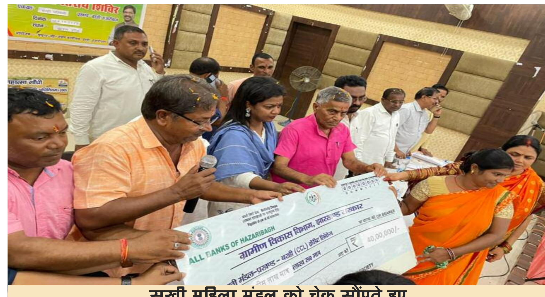
सखी महिला मंडल को चेक सौंपते हुए