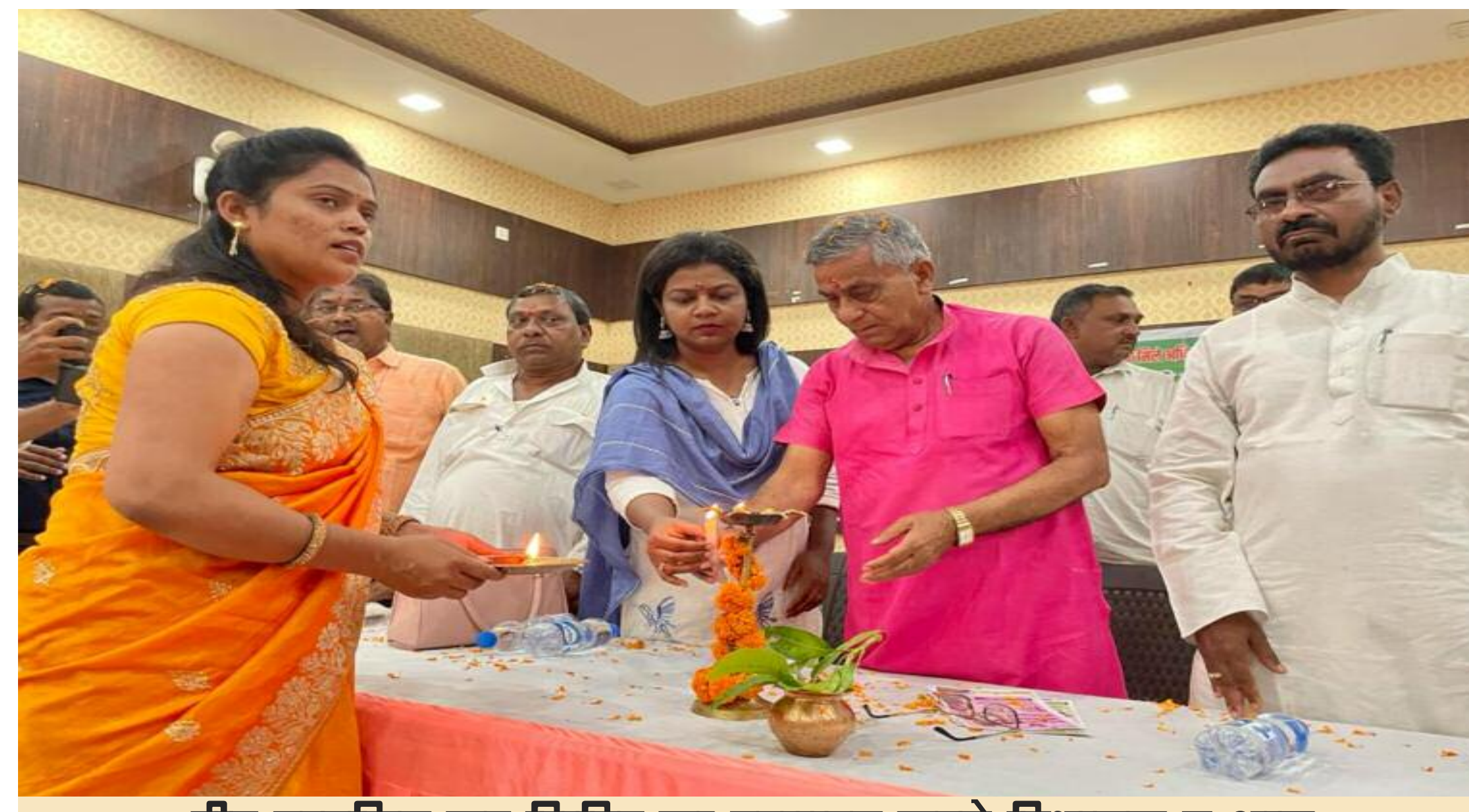
दीप प्रज्वलित कर शिविर का उद्घाटन करते विधायक व अन्य