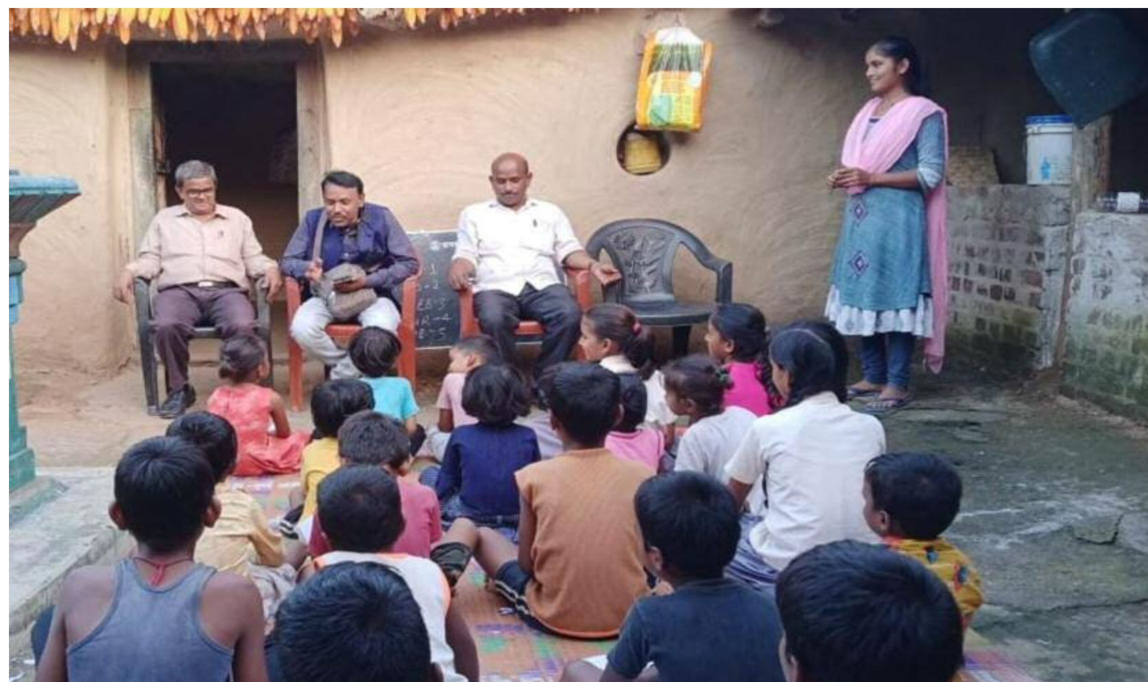
एकल विद्यालय का निरीक्षण करती अंचल समिति की टीम

ग्रामीणों को दी गई पंचमुखी शिक्षा एवं वर्मी कंपोस्ट खाद बनाने की जानकारी