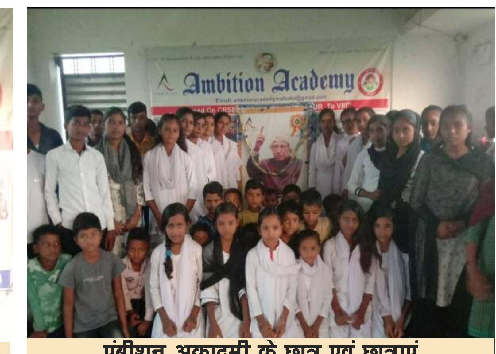
एंबीशन अकादमी के छात्र एवं छात्राएं