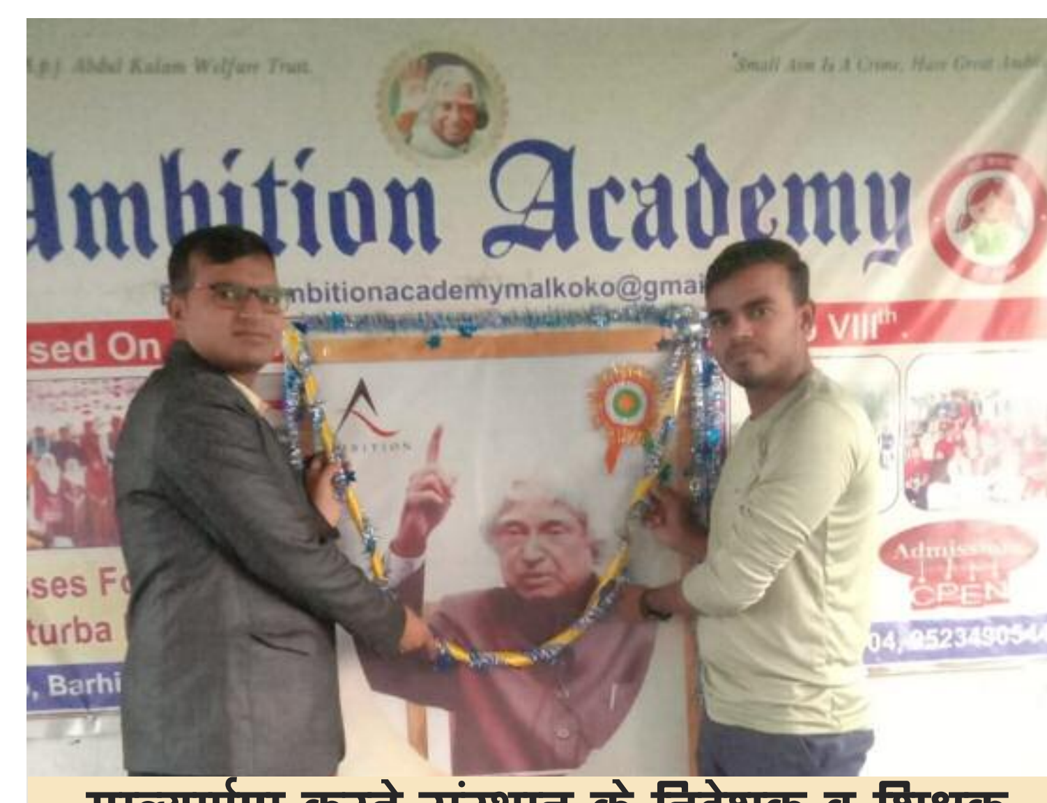
माल्यार्पण करते संस्थान के निदेशक व शिक्षक