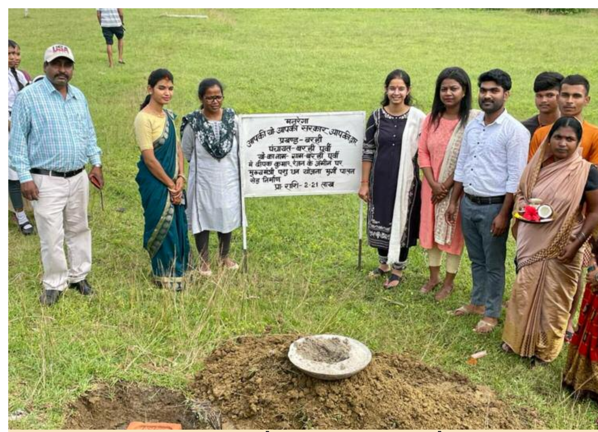
कुक्कुट पालन शोड का उद्घाटन करते हुए

आधार शुद्धिकरण का कार्य किया गया। नए राशन कार्ड लाभुको का आवेदन लिया गया। शिविर में लगे विभिन्न विभागीय स्टालों में सरकार द्वारा संचालित लोक कल्याणकारी योजनाओं के बारे में जानकारी दी गई एवं योग्य लाभुकों से योजना से संबंधित आवेदन प्राप्त करते हुए उनका त्वरित निष्पादन किया गया। मौके पर विधायक उमाशंकर अकेला ने बड़ी संख्या में उपस्थित ग्रामीणों को संबोधित किया तथा पंचायतों में