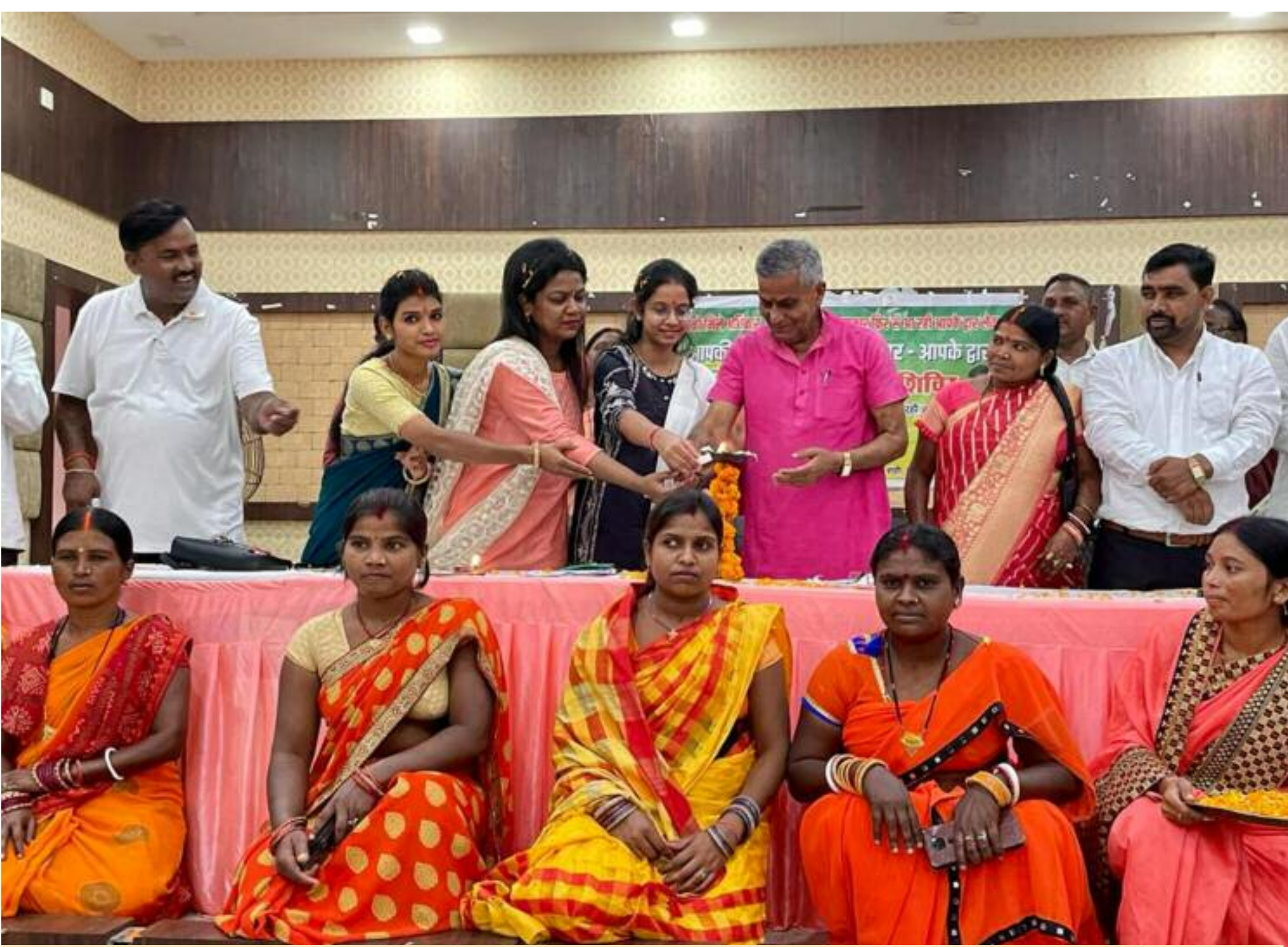
दीप प्रज्वलित कर शिविर का उद्घाटन करते हुए