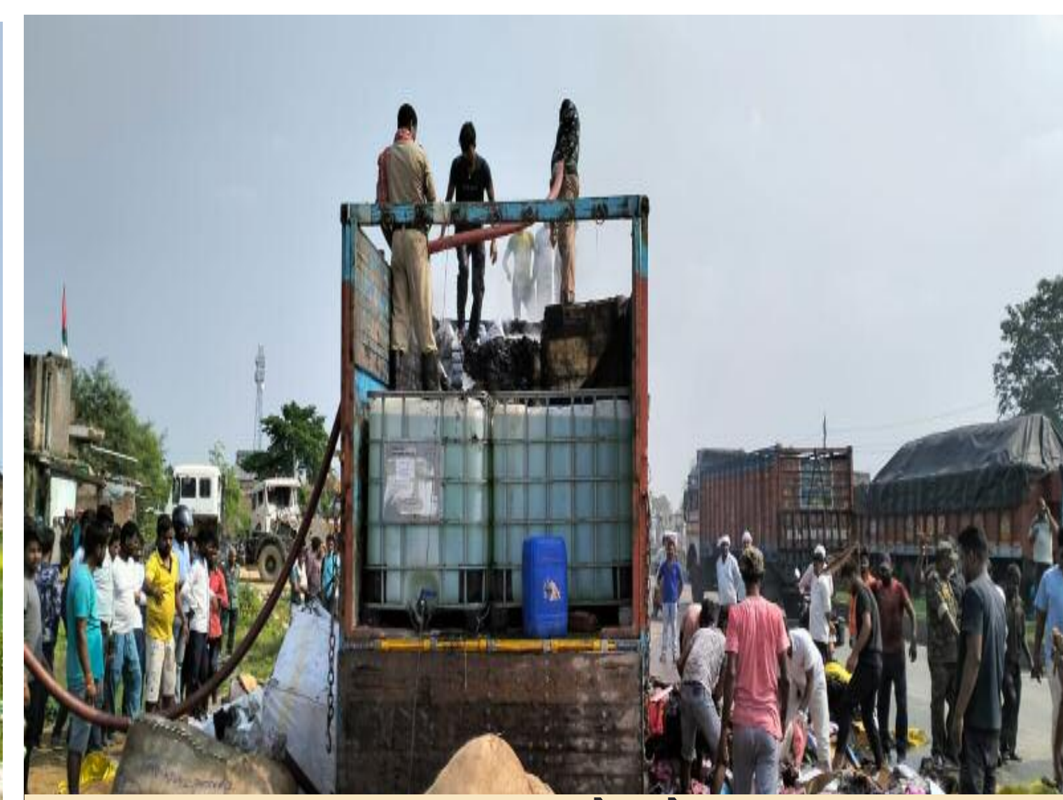
आग बुझाते लोग