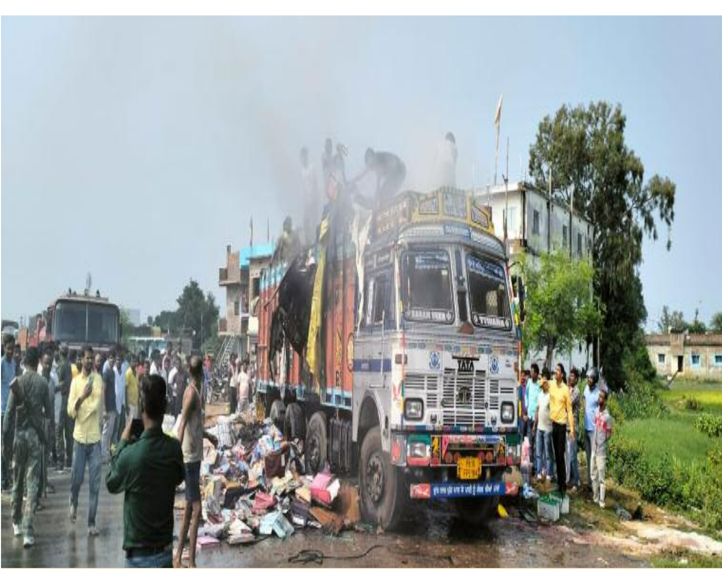
ट्रक में लगी आग

पंजाब के लुधियाना से रांची जा रही थी ट्रक