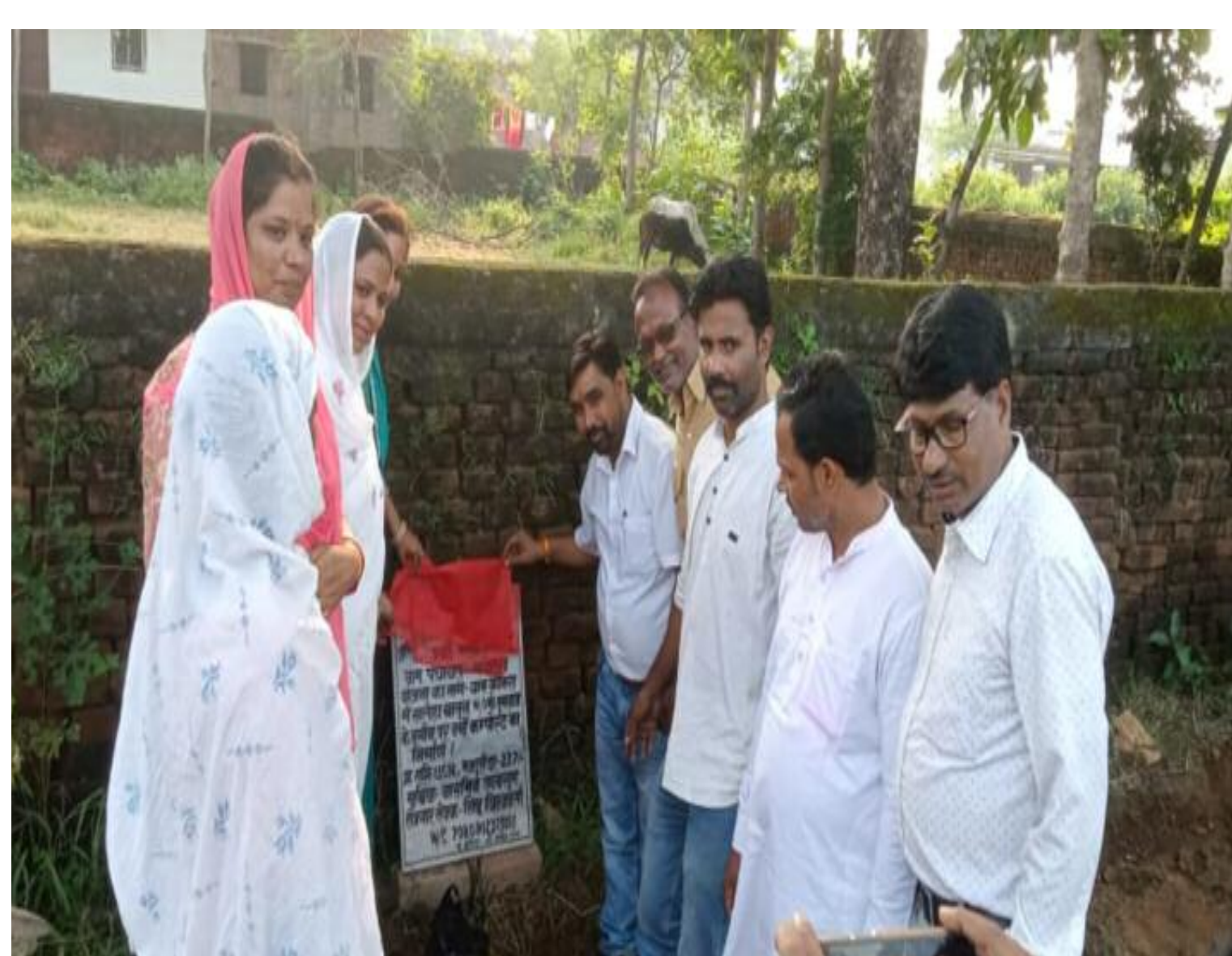
वर्मी कंपोस्ट का शिलान्यास करते हुए