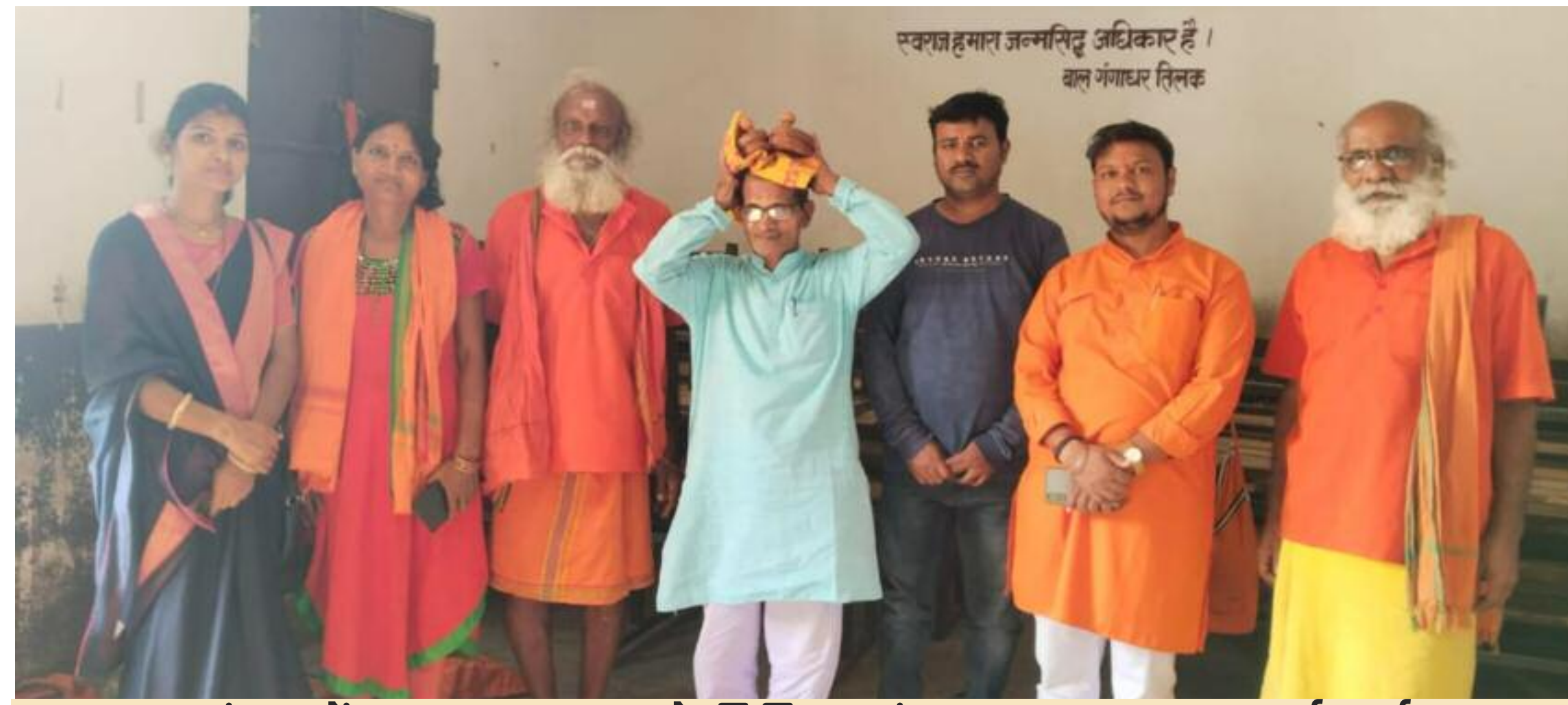
संतजनों का स्वागत करते विहिप एवं आरएसएस का कार्यकर्ता

भामाशाह विद्यालय बरही में एअरिल भारतीय हरे राम हरे कृष्ण फाउंडेशन के 18 सदस्यीय संतजन का आगमन हुआ। सभी पैदल यात्रा कर आंध्रप्रदेश काकीनाड़ा जिला के गुंचाला ग्राम श्री वेंकटेश्वर स्वामी मंदिर से चरण पादुका पुजित कर 21.08.2022 प्रस्थान करते हुए कशी विश्वनाथ मंदिर दर्शन-पूजन करते हुए श्रीराममंदिर अयोध्या पहुंचने वाले हैं। अयोध्या में चरण पादुका विधिवत पूजन करके अपने स्थानीय ग्राम में नवनिर्मित भव्य राममूर्ति मंदिर स्थापित करने की योजना