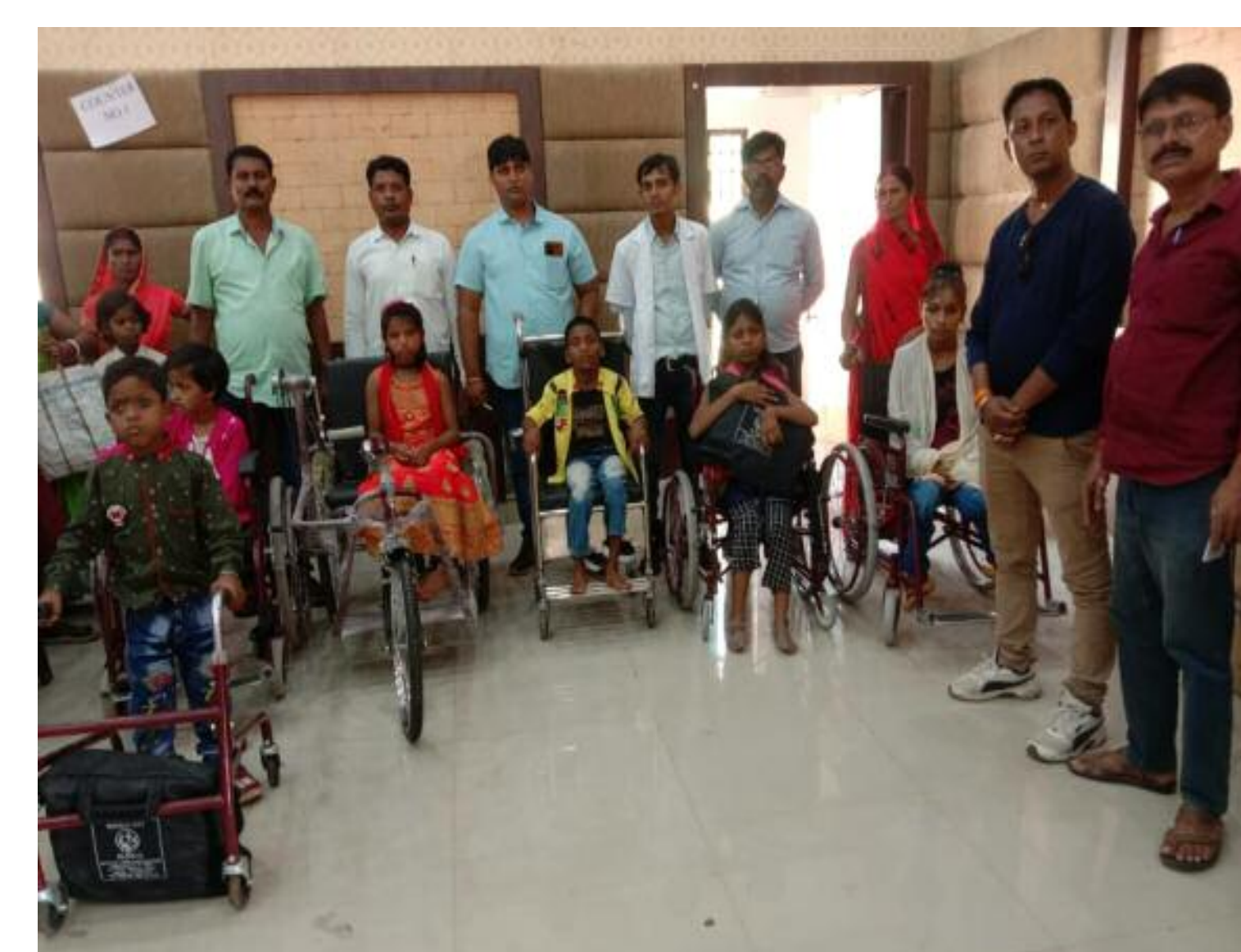
दिव्यांग बच्चों को दिया गया उपकरण