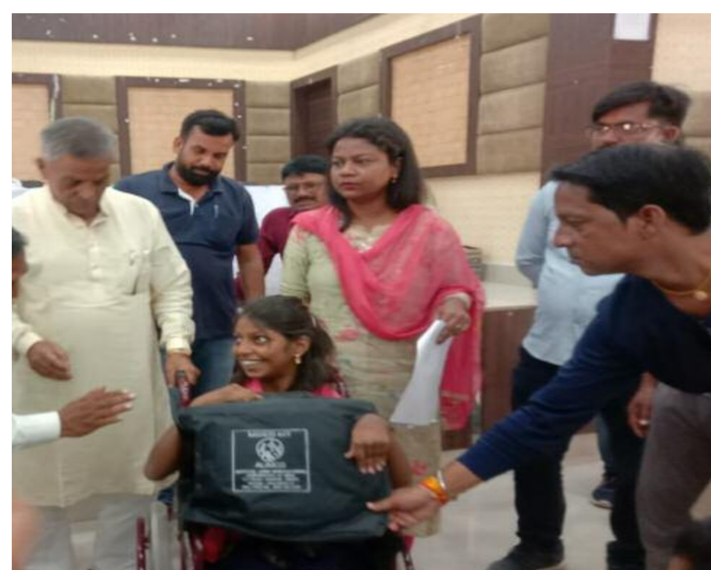
दिव्यांग बच्चों से बात करते विधायक