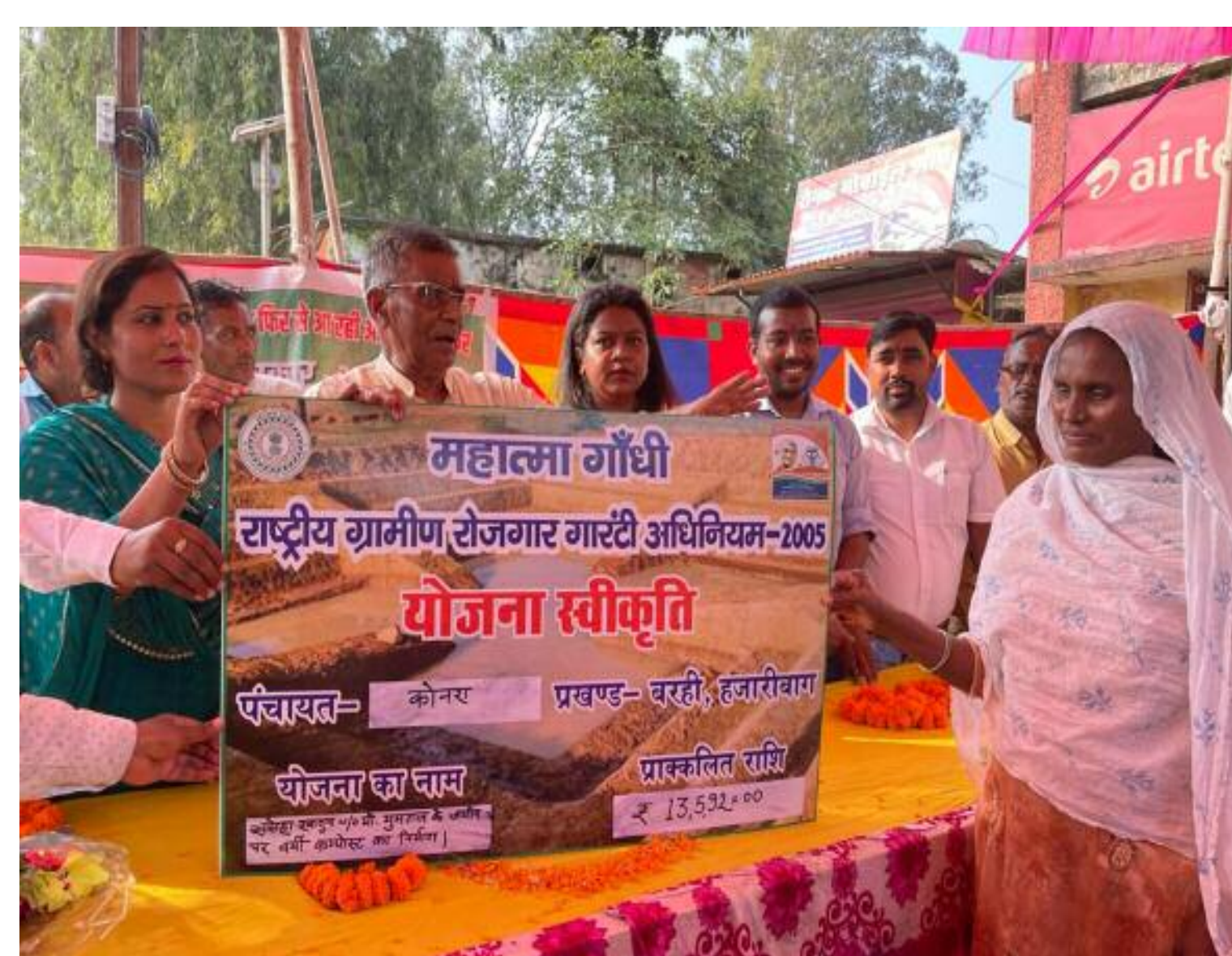
लाभुक को चेक सौंपते विधायक वा अन्य