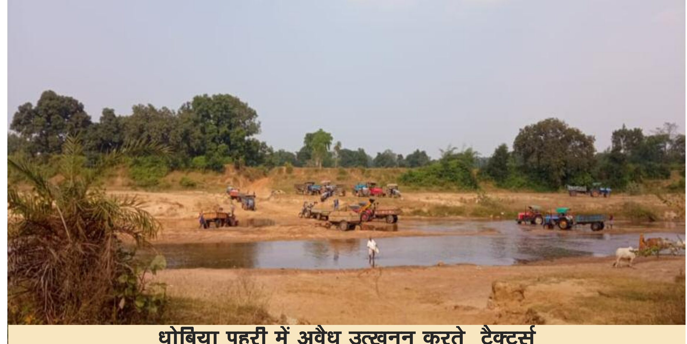
धोबिया पहरी में अवैध उत्खनन करते ट्रैक्टर